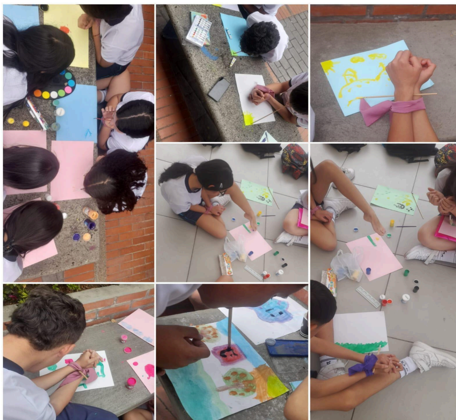
Collage de sesión con pintura