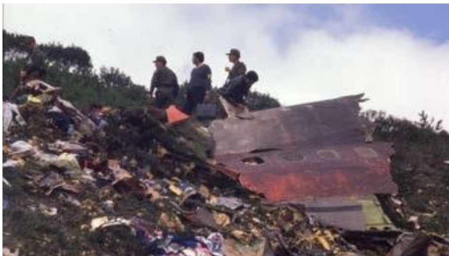
Fotografía Restos de avión HK-1803

Nota. El avión explotó en el aire. Todos los pasajeros murieron Foto: Archivo El Tiempo (26 de noviembre 2020).