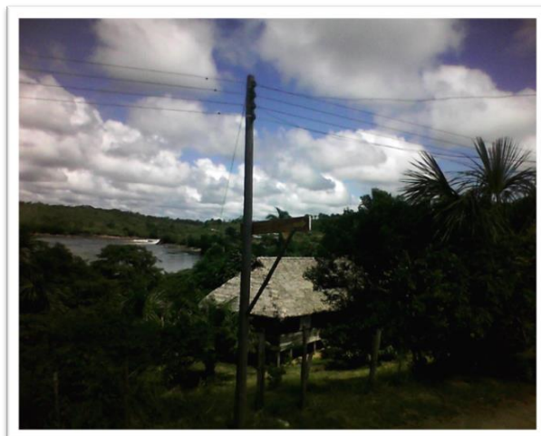
Foto 2. Vista panorámica de la Chorrera

La población que habita la zona Chorrera (en adelante zona AZICATCH), pertenece a los pueblos Uitotos, Bora, Okaina y Muinane, que tiene una historia y tradición milenaria común como parte de la cultura del tabaco, la coca y yuca dulce: la tradición ancestral esta expresada en los mitos de origen de la tierra, del hombre y de los seres que conviven con la naturaleza.