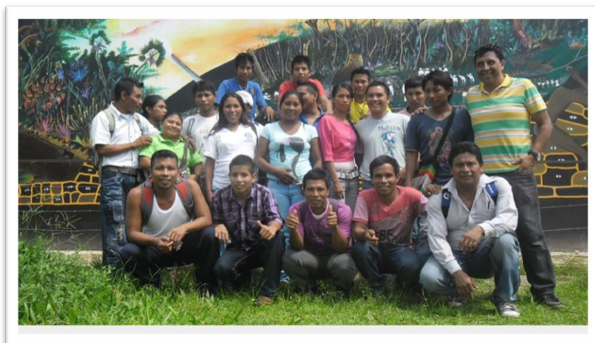
Foto. 4 Estudiantes U.P.N CERES La Chorrera (Registro, Edgar Balbuena Abril de 2013)

cuenta con varios profesionales indígenas principalmente del sector educativo con nombramiento oficial y contrato indefinido. Al igual que en la actualidad que con miembros de las diferentes etnias que se encuentran cursando carreras universitarias en algunas universidades del país.