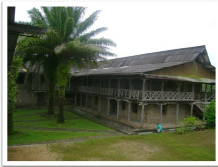
Foto 1. Antiguas instalaciones Casa Arana actual casa del conocimiento

casa Arana, por su crueldad cauchera .La chorrera donde se realiza esta investigación, fue en un tiempo el centro de imposición y dominación cultural y social sobresaliendo innumerables crímenes a través de la esclavitud, el genocidio y holocausto cometido por los barbaros caucheros peruanos, patrocinados por la multinacional RUBER PERUVIAN COMPANY de Inglaterra, más conocida como la casa Arana, a cargo del señor Julio Cesar Arana y hermanos hacia finales de la década de 1890.