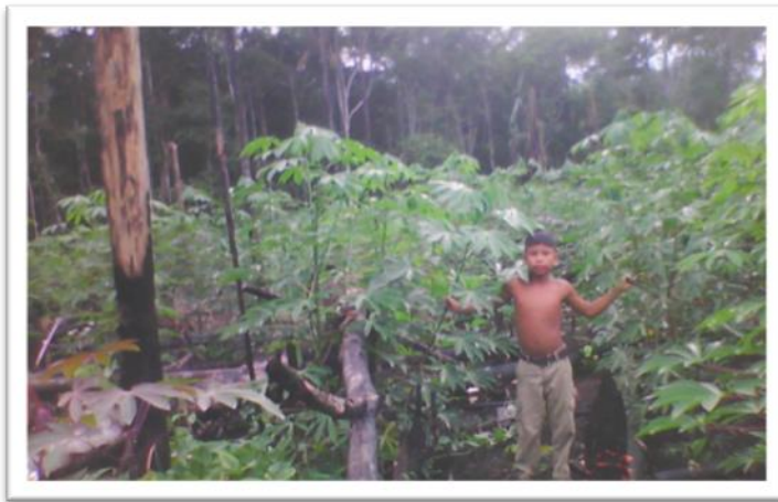
Foto 3. La chagra Uitoto conocimiento milenario de vida. (Registro, Agapito Buinaje abril de 2012)

La chagra es el espacio tradicional de enseñanza y aprendizaje del conocimiento, su práctica implica una corresponsabilidad por parte de las familias indígenas frente a sus espacios cultivados, la existencia de normas tradicionales, son necesarias de asumir y practicar a nivel comunitario para hacer una buena chagra y obtener una buena producción que sustente a la familia y a la comunidad en los espacios de bailes tradicionales. La chagra no solo permite contar con la abundancia de alimentos y de bienestar de las familias, sino también el cuidado y el sostenimiento del medio natural, así como la reproducción de los conocimientos y prácticas tradicionales básicas para el manejo de los espacios cultivados.