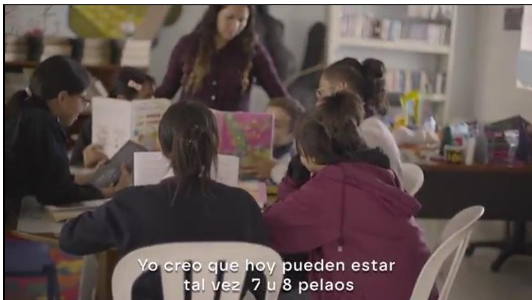
Imagen 7. Fragmento filminuto