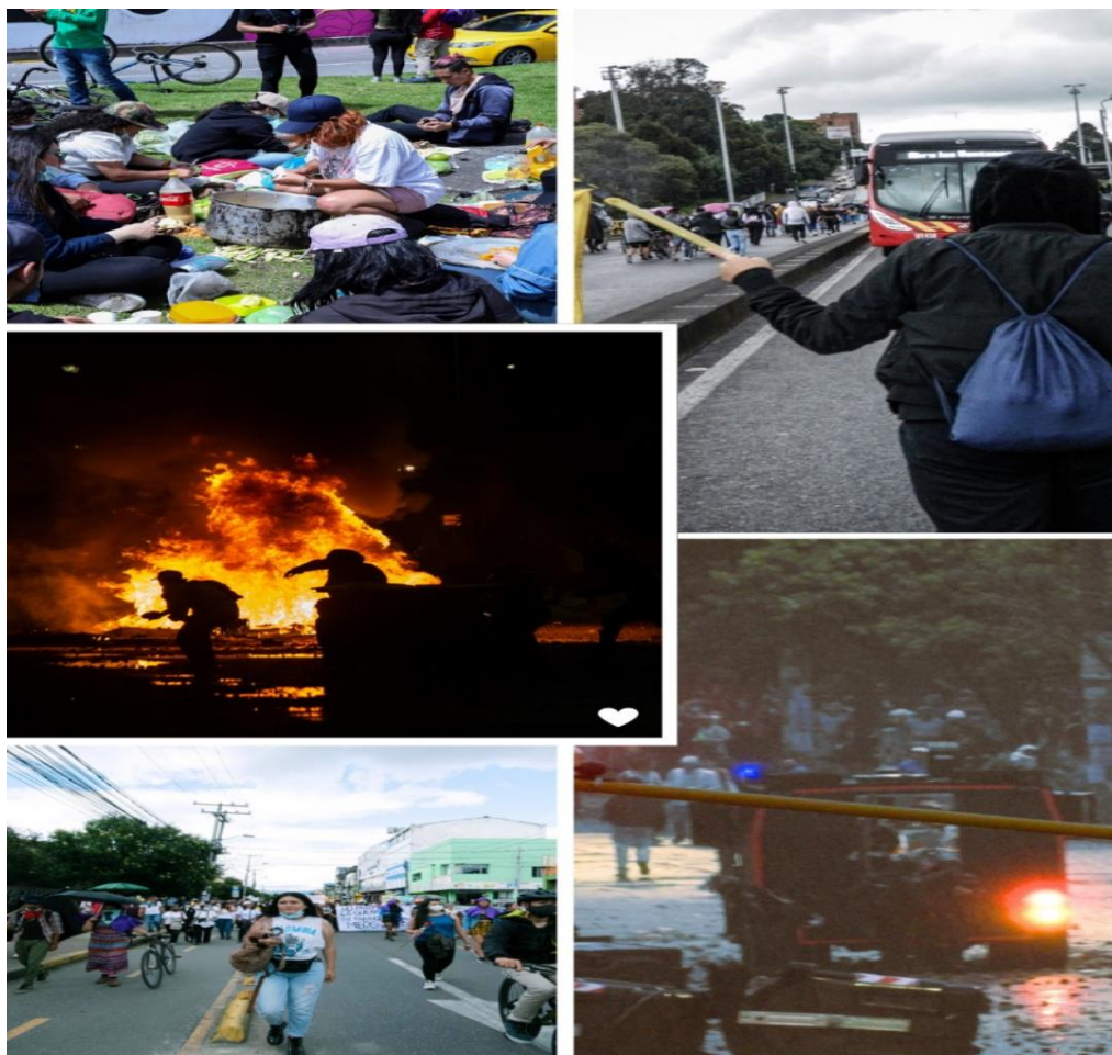
Imagen 3. Estallido social en Suba – 2021

factor que contribuyó a la situación generalizada de descontento fue el incumplimiento de los acuerdos firmados entre el Gobierno de Duque y el Comité Nacional del Paro, a raíz de los cuales fue posible levantar el Paro de noviembre y diciembre de 2019 (Estrada et al. , 2023).