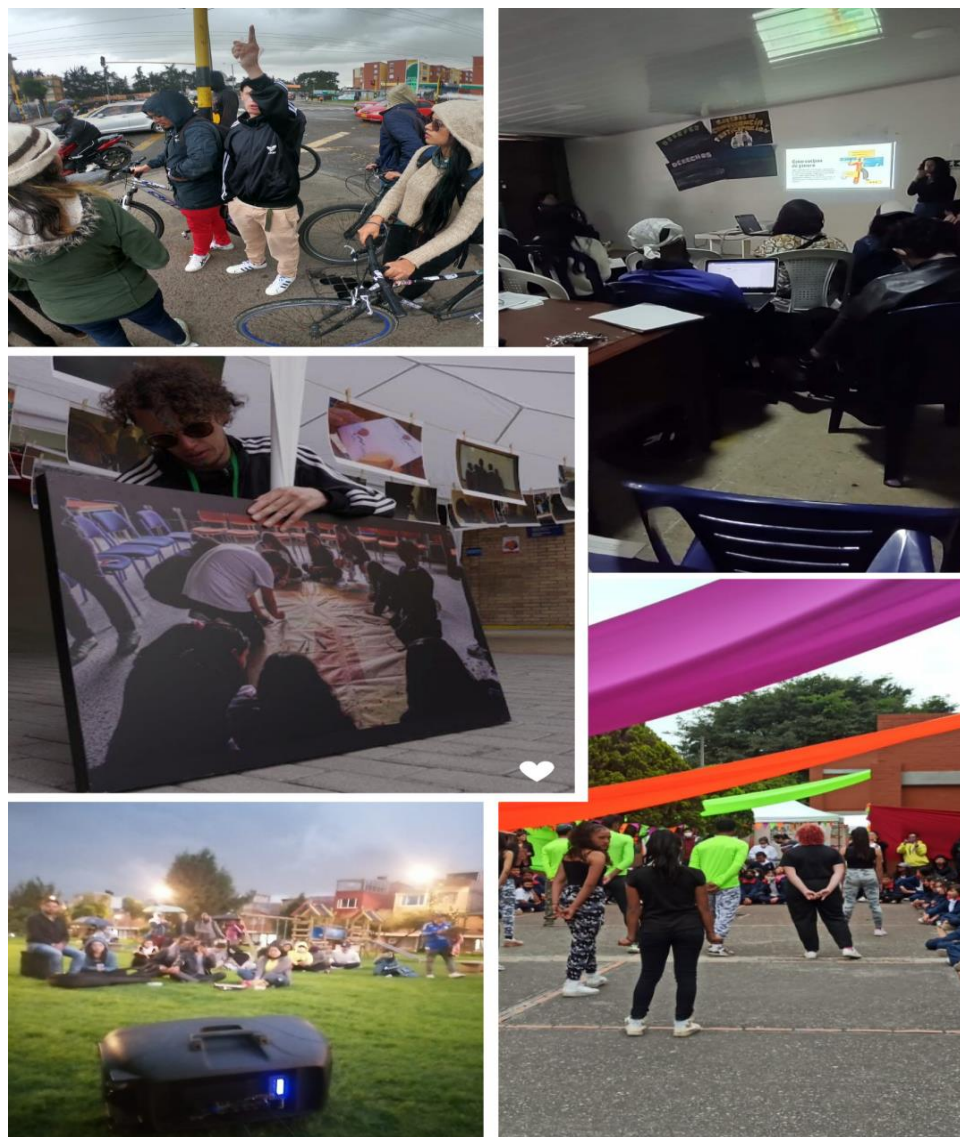
Imagen 1. Participación del CESAP en eventos