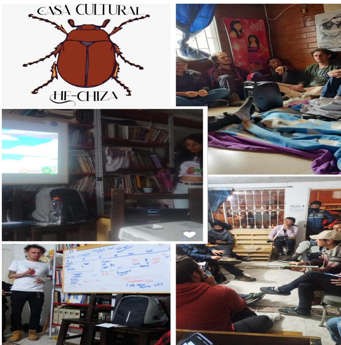
Imagen 4. Talleres del CESAP en la Casa He-Chiza

La Casa Hechiza fue un lugar donde se llevaron a cabo talleres, debates y proyecciones de cine político, convirtiéndose en un epicentro de discusión crítica y análisis compartido. Este espacio permitió articular experiencias de resistencia y aprendizajes colectivos en torno a un proyecto político orientado a transformar la realidad territorial de Suba. Más allá de ser un lugar para la acción coyuntural, la Casa se convirtió en un espacio para cultivar una conciencia crítica y generar herramientas para la formación política continua.