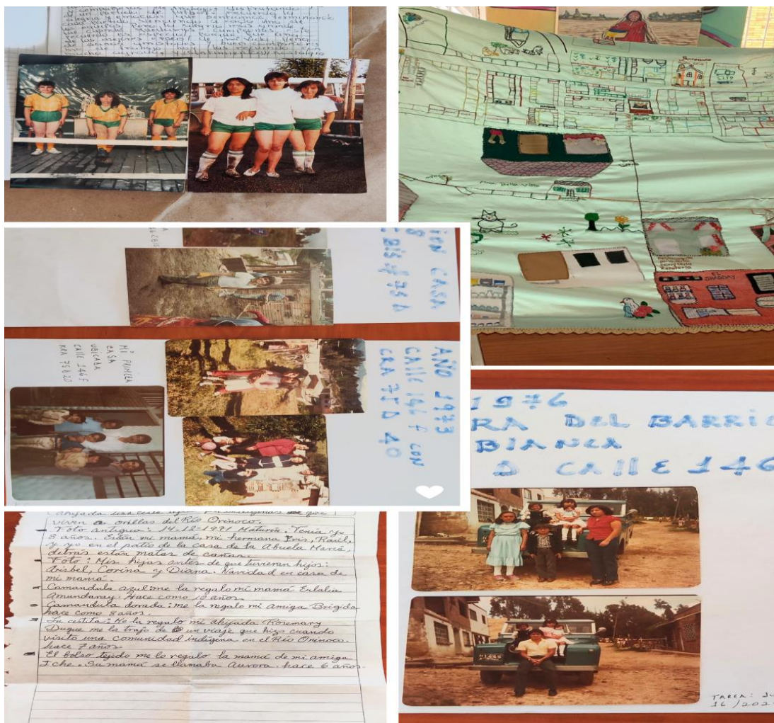
Imagen 8. Taller de memoria colectiva

el pasado, y promueve prácticas de cuidado colectivo que reafirman la importancia de la memoria como herramienta de resistencia y transformación social.