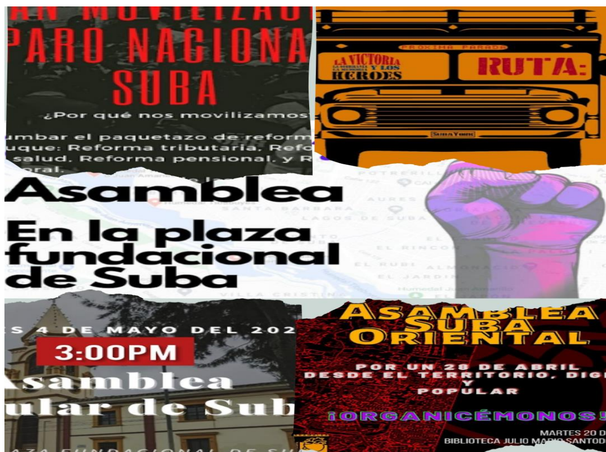
Imagen 5. Carteles de las asambleas populares en SUBA

Otro momento crucial en la historia del CESAP fue su participación en las Asambleas Populares de Suba durante el Paro Nacional de 2021. Estas asambleas, que surgieron como una respuesta inmediata al descontento social, pronto se transformaron en espacios pedagógicos donde la escucha y análisis de las dinámicas dentro del espacio asambleario, permitieron generar aprendizajes de experiencias individuales y colectivas en contextos de represión y exclusión en el territorio.