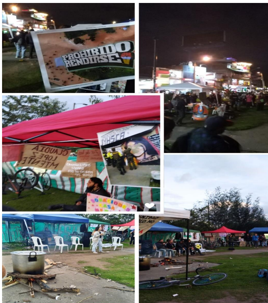
Imagen 6. Conmemoración 28A