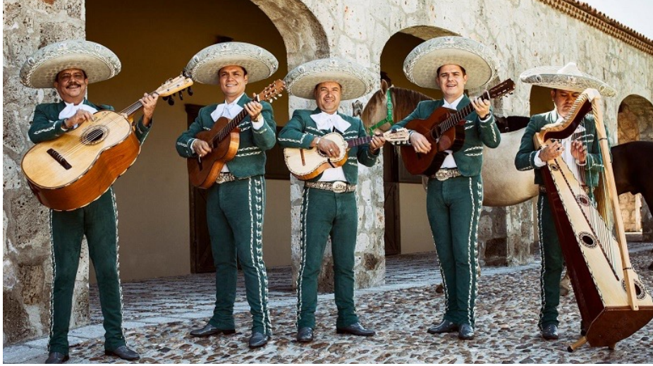
Ilustración rescatada de la página web: http://www.actualidadviajes.com/vestimenta-de-los-charros-o-mariachis-costumbres-mexicanas/