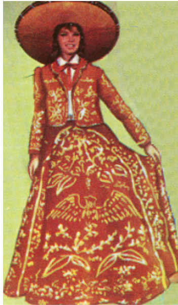
Ilustración rescatada de la página web: http://forito.blogspot.com.co/2013/06/trajes-tipicos-de-mexico.html