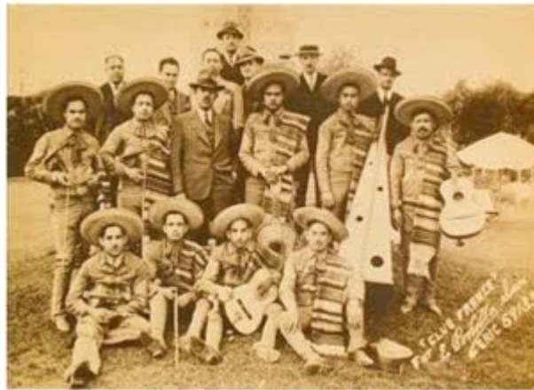
Ilustración rescatada de la página web: http://stephanie2390.blogspot.com.co/

Indudablemente, una de las razones más fuertes de la transformación del mariachi tradicional en el mariachi actual, es las características y determinaciones de los medios de comunicación masiva a la cual se vio enfrentado el fenómeno mariachi en su expansión por el medio musical mundial. Compañías disqueras, radiofónicas y empresas cinematográficas establecieron las características que debía tener ese mariachi tradicional para poder triunfar