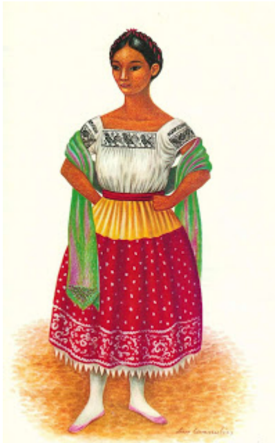
Ilustración rescatada de la página web: http://forito.blogspot.com.co/2013/06/trajes-regionales-o-tipicos-de-mexico.html