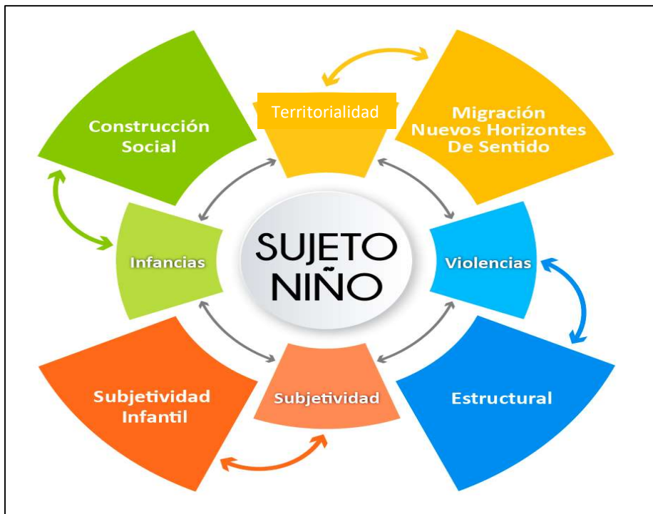
Figura 1. Diagrama Modelo de análisis

La presente investigación ha diseñado un modelo de análisis como ruta para comprender la problemática y alcanzar los objetivos propuestos, con aporte de elementos teóricos fundamentales. Este modelo de análisis (figura 1) afirma que las infancias en plural, son múltiples y se configuran con relación- entre otros- a su territorio como espacio que permite la construcción de identidades, de narrativas, de sentidos dentro de una comunidad; infancias que para el presente estudio están atravesadas por violencias, también en plural que influyen en su constitución subjetiva. Por lo cual se hace necesario profundizaren las categorías de: Infancias, Constitución Subjetiva, Violencias y Territorialidad