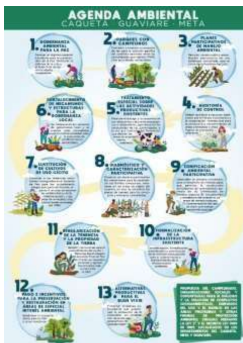
Ilustración 7 13 puntos de la Agenda Ambiental Campesina, Étnica y Popular.

A pesar de estas dificultades se han generado procesos organizativos que avivan el proceso de movilización como lo es la Agenda Ambiental Campesina, Étnica y Popular-AACEP que es resultado de una construcción colectiva de 32 organizaciones y que cuenta con 13 puntos.