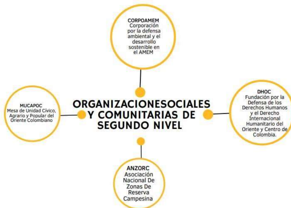
Ilustración 4 relación organizaciones de segundo nivel con organizaciones de orden regional y nacional.