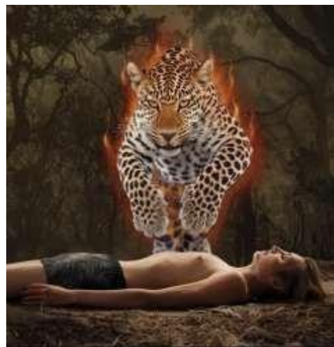
Figura 13: fugado