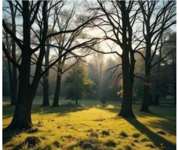
Figura 9: Mañana