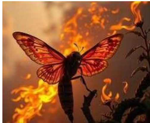
Figura 7: Insecto