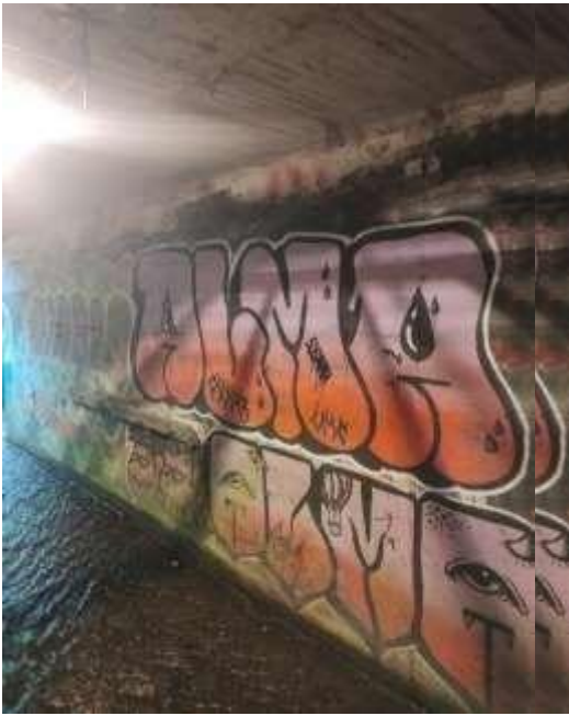
Figura 4: Quebrada La Vieja calle 72(1)