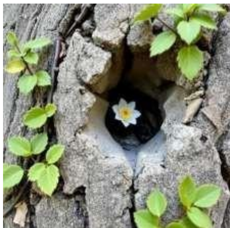
Figura 14: Planta

Narrado el vacío del abismo entre dos piedras quedan las cuerdas vocales del bosque tejidas con telarañas que gritan al eco en las hojas que gritan a la flor Y la flor, que murió dos veces cerca de noviembre a través de los versos sigue muriendo una y otra vez porque cada poeta la arranca nos arrancan y mi casa ya no es mi casa es la raíz expuesta del silencio y el olvido