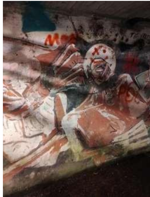
Figura 5: Quebrada La Vieja calle 72(2)

consumiendo la distancia Como si de un vaso con agua se tratase permanece el silencio justo en tu sueño para prevenirte del mundo r e a l