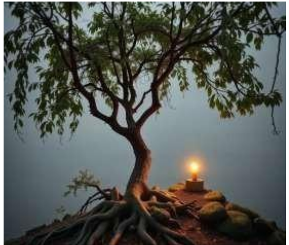
Figura 6: El árbol con su luz