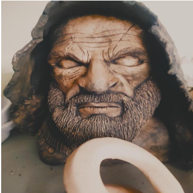
Figura16: escultura en arcilla taller universidad pedagógica nacional

que leía en la maestría no solo como fuentes de conocimiento conceptual, sino como materias primas susceptibles de ser transformadas, moldeadas y reconfiguradas desde la escritura creativa.