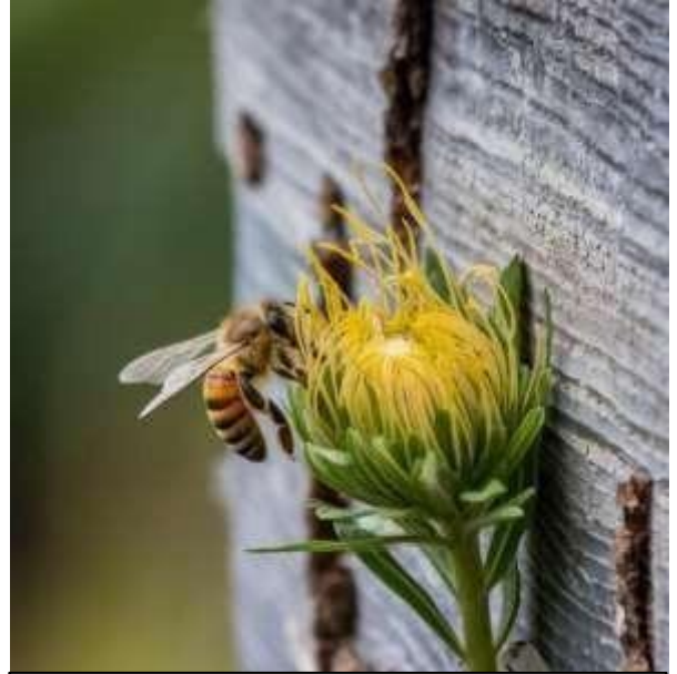
Figura 10: Zumbido