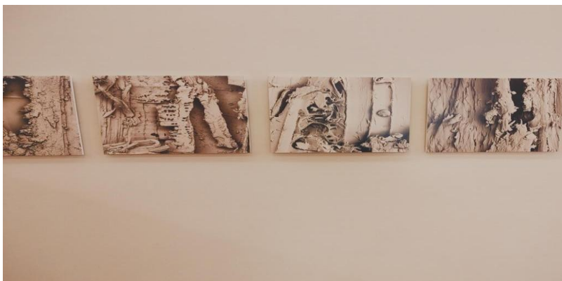
Figura19: fotografía hojas secas

El interés por observar cómo los artistas trabajan la materialidad no se limitó al taller de cerámica. Días después de aquella visita, mientras seguía reflexionando sobre la relación entre materia y forma, entre proceso y resultado, tuve la oportunidad de asistir a una exposición que me mostró otra dimensión de la intervención artística sobre lo material. Si en el taller había visto cómo la arcilla se transformaba bajo las manos del ceramista, en esta nueva experiencia observaría cómo elementos naturales ya portadores de forma propia eran intervenidos para detener su curso temporal. Recuerdo en particular una serie de fotografías que mostraban texturas orgánicas ampliadas, revelando las estructuras microscópicas de cortezas, líquenes, hongos y otros materiales vegetales. Estas imágenes funcionaban como umbrales que permitían acceder a una dimensión de lo natural que normalmente permanece invisible a nuestra mirada cotidiana.