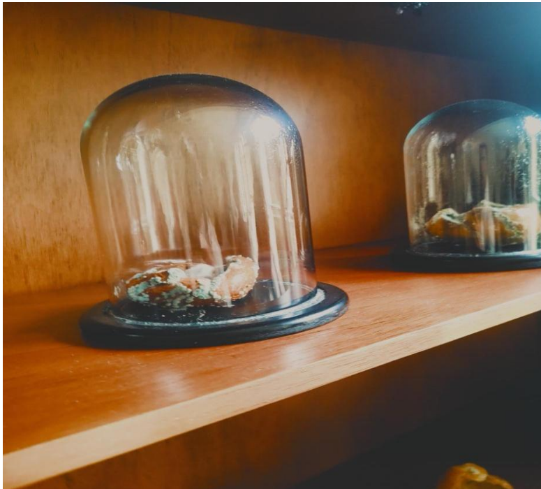
Figura 21: fotografía naturaleza muerta

Estas piezas me hicieron reflexionar sobre la relación entre naturaleza y cultura, sobre cómo el arte puede funcionar como una forma de detener el tiempo, de suspender la descomposición, pero también sobre la inevitable entropía que atraviesa toda materia orgánica.