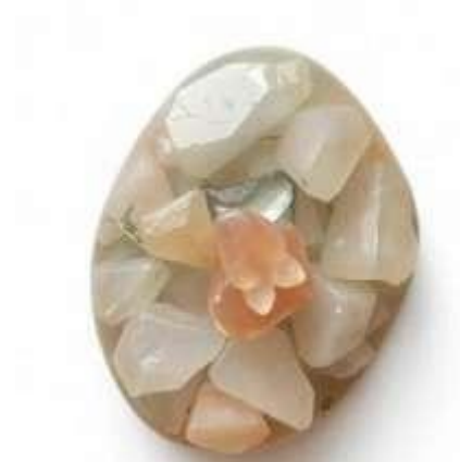
Figura 12: flota

las flores jorobadas humean la caricia del sol y el viento murmura La transparencia engrosada en la mano de Dios.