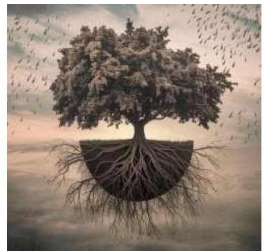
Figura 11: Planta

emite sonidos que nadie entiende está arrancado, sin raíz