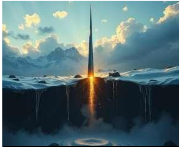
Figura 8: Paisaje

bajo la espiga ligero el silencio cubre los abismos esperando que la leve luz de un día emancipe la mirada de medio mundo que somos todos