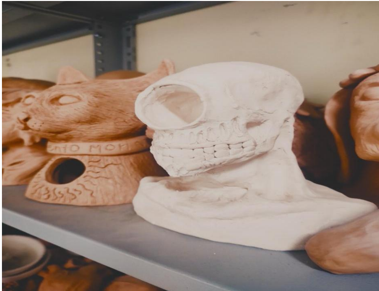
Figura18: escultura en arcilla taller universidad pedagógica nacional

El interés por observar cómo los artistas trabajan la materialidad no se limitó al taller de cerámica. Días después de aquella visita, mientras seguía reflexionando sobre la relación entre materia y forma, entre proceso y resultado, tuve la oportunidad de asistir a una exposición que me mostró otra dimensión de la intervención artística sobre lo material. Si en el taller había visto cómo la arcilla se transformaba bajo las manos del ceramista, en esta nueva experiencia observaría cómo elementos naturales ya portadores de forma propia eran intervenidos para detener su curso temporal. Recuerdo en particular una serie de fotografías que mostraban texturas orgánicas ampliadas, revelando las estructuras microscópicas de cortezas, líquenes, hongos y otros materiales vegetales. Estas imágenes funcionaban como umbrales que permitían acceder a una dimensión de lo natural que normalmente permanece invisible a nuestra mirada cotidiana.