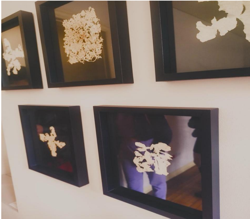
Figura20: fotografía obra flores secas