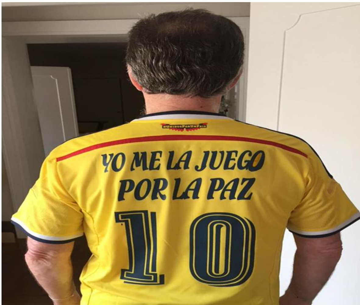
Figura 11. Juan Manuel Santos, la camiseta por la paz. Recuperado de https://twitter.com/JuanManSantos/status/652133541891829760/photo/1?ref_src=twsrc%5Etfw&ref_url=https%3A%2F%2Fwww.elheraldo.co%2Fdeportes%2Fsantos-se-puso-la-camiseta-de-la-seleccion-y-dice-que-se-la-juega-por-la-paz-221586

El 24 de agosto de 2016 se publicaron los acuerdos de paz entre el Gobierno y la guerrilla los seis puntos claves fueron: