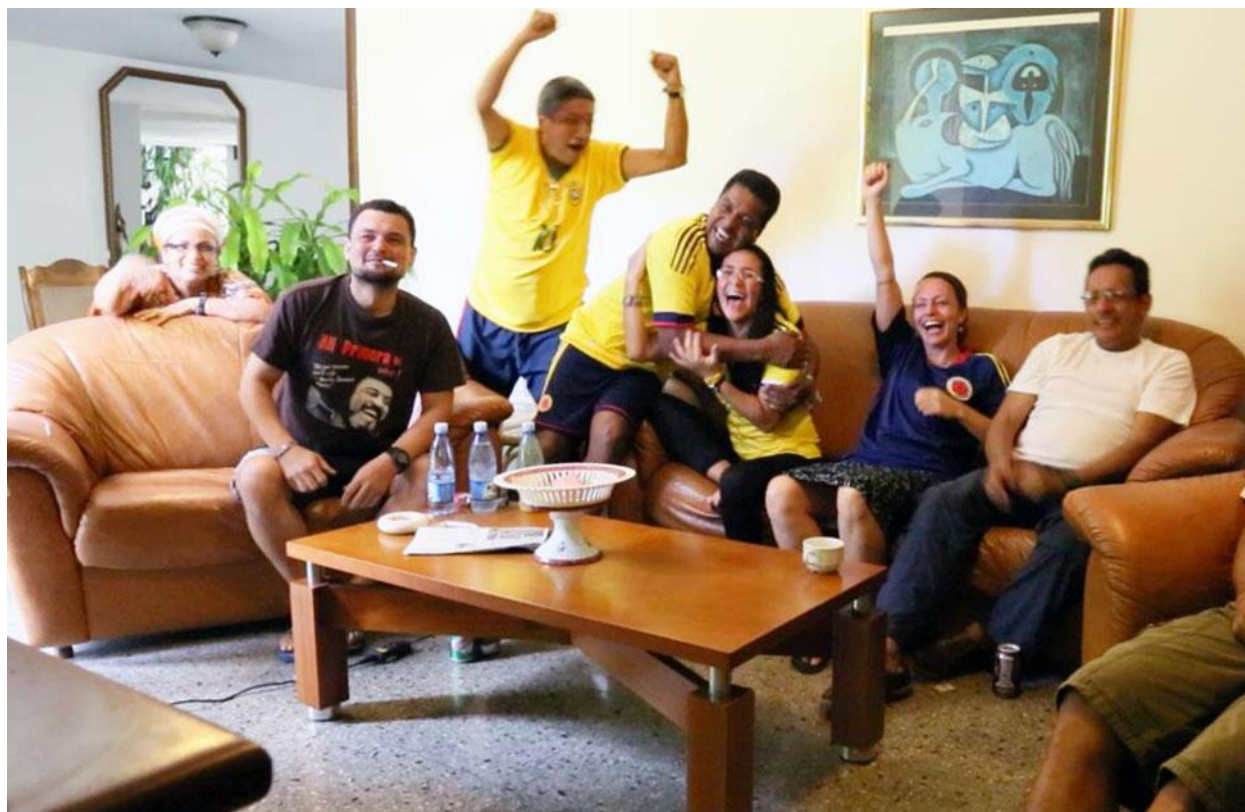
Figura 9. Las FARC celebrando la victoria de la tricolor.

50 años, debido a sus prácticas armamentistas y a la influencia de los medios de comunicación quienes se encargaban de mostrar al país una imagen sangrienta del grupo guerrillero. Es el fútbol el instrumento perfecto usado por la guerrilla para acercarse al país de una manera fidedigna.