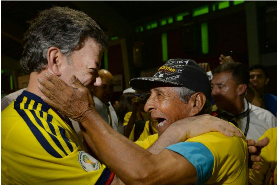
Figura 2. Presidente Santos en Barranquilla, celebrando la clasificación de la selección Colombia al mundial 2014 con un desconocido.