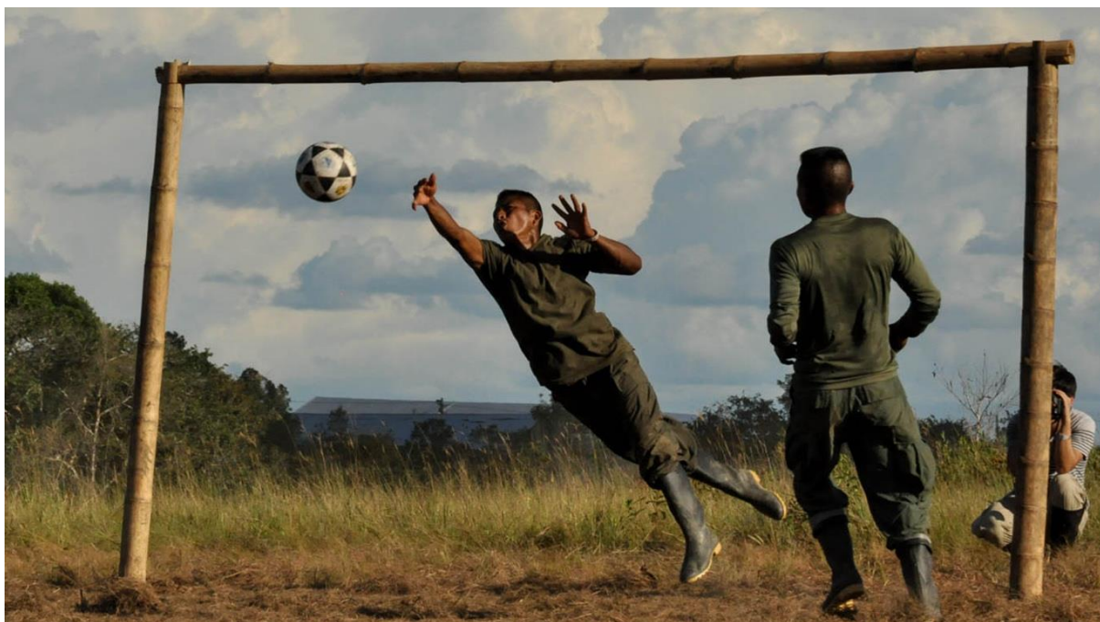
Figura 3. Guerrilleros jugando fútbol. Recuperado de

Rodrigo Londoño, como líder de las FARC, también está encantado con la idea de ver a los suyos representando libremente a la organización por los estadios colombianos. Timochenko ve el fútbol como uno de los caminos más rápidos hacia la reintegración de los ex combatientes, aunque estos no serán los únicos en formar el equipo. (Naboulsi, Omar. (2017, mayo, 30). ¿Estuvo en las FARC la próxima estrella del fútbol colombiano? Play Ground . Recuperado de http://www.playgroundmag.net/sports/La_Paz_FC-FARC-equipo-futbol-partido_politico_0_1981001902.html )