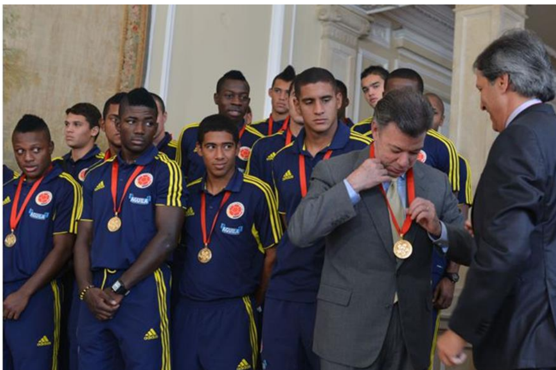
Figura 7. Juan Manuel Santos recibiendo la medalla del campeón suramericano sub 20, 2013 por el técnico nacional Piscis Restrepo. Recuperado de https://www.minuto30.com/el-presidente-santos-recibio-a-la-seleccion-colombia-campeona-del-sudamericano-sub-20/130930/

todos nosotros. Y ustedes con lo que hacen todos los días también acrecientan ese orgullo de ser colombiano, manifestó el Presidente Santos. (Redacción Minuto 30. (2013, febrero, 6). El Presidente Santos recibió a la Selección Colombia, campeona del Sudamericano Sub-20. Minuto 30 . Recuperado de https://www.minuto30.com/el-presidente-santos-recibio-a-la-seleccion-colombia-campeona-del-sudamericano-sub-20/130930/ )