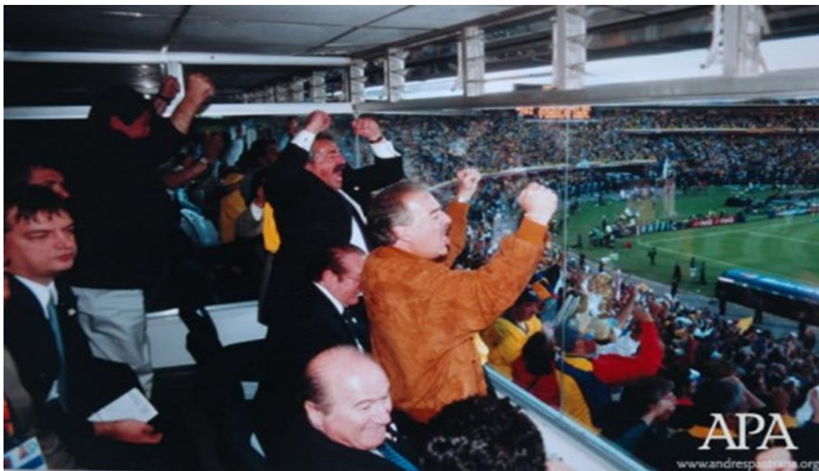
Figura 5. Presidente Pastrana junto a Nicolás Leoz presidente de la CONMEBOL en la final de la Copa América 2001 en el estadio Nemesio Camacho “El Campín”.

colombianos Andrés Pastrana, junto a la estrella del fútbol argentino Diego Armando Maradona y el presidente de la FIFA Nicolás Leoz, Pastrana se vistió con la camiseta del seleccionado nacional y levanto la Copa América mientras era ovacionado por los miles de espectadores , ganándose el aprecio de colombianos que por primera vez obtenían un triunfo en esta disciplina deportiva y coronándose como un gran mandatario.