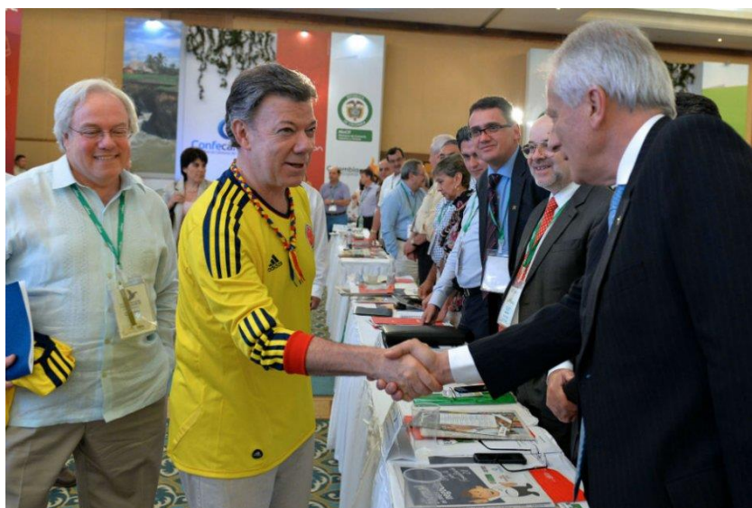
Figura 1. Juan Manuel Santos con la camiseta de la selección Colombia en evento de la procuraduría nacional.

En ese sentido, Santos aplica el concepto de fachada en Goffman, montando un escenario donde actúa como el gran salvador del país y del deporte. Para ello, usa la imagen de la selección nacional que está impregnada de imaginarios y significaciones por parte de los colombianos. Así, la legitimidad, admiración, esperanza, y unidad que la tricolor ha transmitido al país se extrapolan a la política y el gobierno de Santos, quien a través de sus discursos y la gran cantidad de imágenes en la que aparece con la camiseta de la selección, jugadores y cuerpo técnico, establece una gran metáfora política de rectitud, trabajo en equipo, esperanza y unidad que sólo es posible con la instrumentalización del fútbol. Es imposible analizar los mensajes e imágenes del presidente de la república y no asociarlos a la selección nacional y, así mismo, es imposible ver jugar a la tricolor y no pensar en el gobierno Santos.