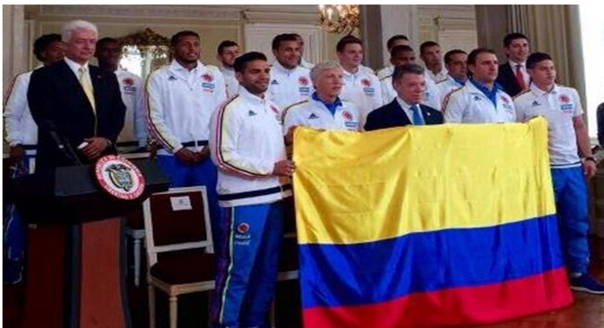
Figura 10. Acto de entrega del tricolor nacional a la Selección por Juan Manuel Santos.

El papel que jugó la Selección Colombia en el Mundial de Fútbol les llenó a los colombianos el corazón de orgullo. Cada vez que salía la Selección, cada vez que metían un gol, el país vibraba de emoción. Y eso es muy importante para cualquier país, para cualquier sociedad (..) nada genera más unidad que ustedes. Desde la guerrilla hasta el más enemigo de ellos, se unen en torno al equipo, en torno a la Selección Colombia (...) y por eso, como dicen en la Marina, les deseamos buen viento, buena mar y todos los éxitos. (Redacción La Nación. (2015, mayo, 30). Presidente Santos entregó bandera a la Selección Colombia. La Nación . Recuperado de http://www.lanacion.com.co/2015/05/30/presidente-santos-entrego-bandera-a-la-seleccion-colombia/ )