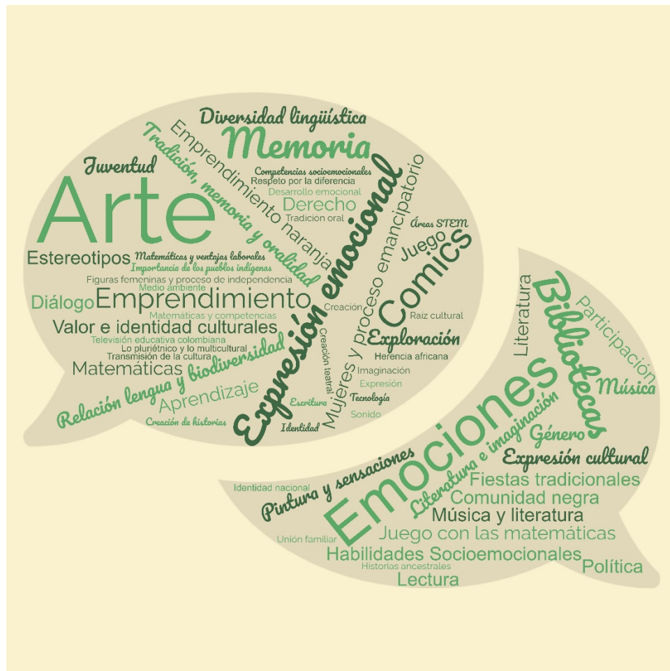
Figura 1 Palabras clave derivadas de la etapa de tematización.