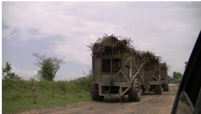
Fotografía 3. Tren cañero. Puerto Tejada, Cauca. 2014