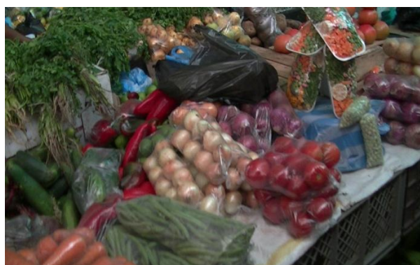
Fotografía 11. Productos locales dispuestos para comercialización. Santander de Quilichao, Cauca. 2014