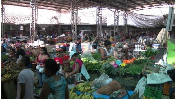
Fotografía 12. Galería o plaza de mercado. Santander de Quilichao, Cauca. 2014