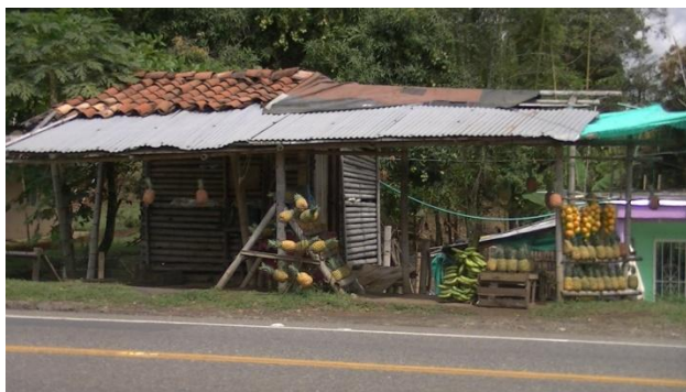
Fotografía 15. Puesto de comercialización de frutales. Guachené, Cauca. 2014