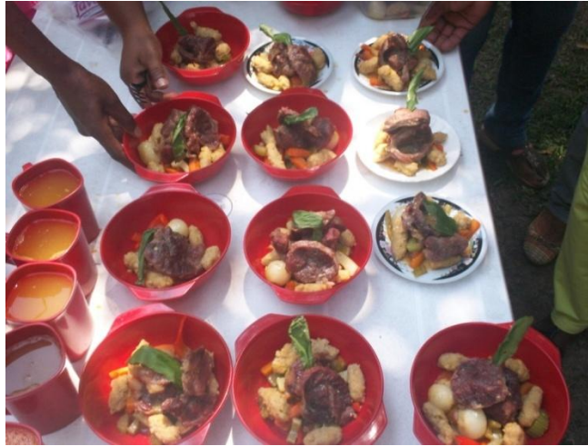
Fotografía 7. Fufú de plátano verde y estofado de carne de res. Receta tradicional afrocolombiana. 2014