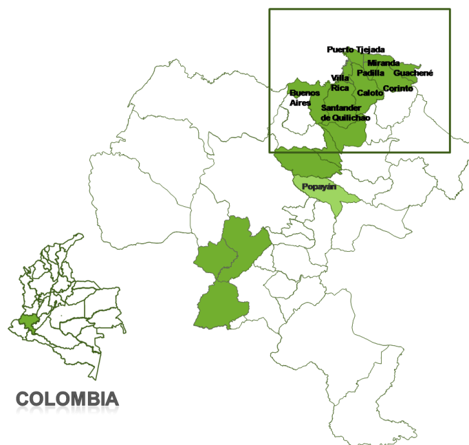
Figura 1. Localización de los municipios del norte del Cauca

El norte del Cauca está constituido en términos político administrativos por once municipios. Geográficamente está localizada entre los 2°42' y 3°20' de latitud norte y entre los 76°3' y 72°52' de longitud occidental. Limita al norte con el departamento del Valle del Cauca; al sur con los municipios de Morales, Caldoño y Jambaló; al oriente con el departamento del Tolima, Jambaló y Toribio; y al occidente con el municipio de López de Micay en el departamento del Cauca.