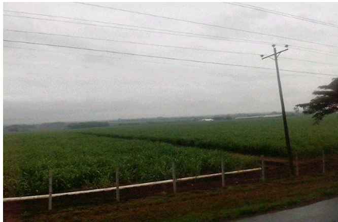
Fotografía 2. Monocultivo de caña de azúcar. Padilla, Cauca. 2014