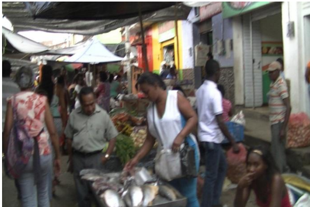
Fotografía 13. Galería o plaza de mercado. Puerto Tejada, Cauca. 2014