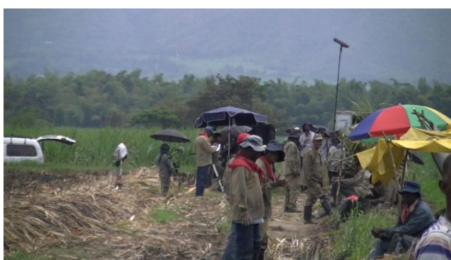
Fotografía 5. Corteros de caña. Puerto Tejada, Cauca. 2014