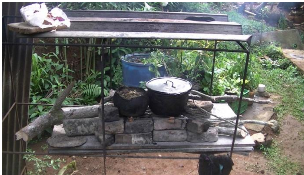
Fotografía 14. Cocina tradicional, fogón de leña. Padilla, Cauca. 2014