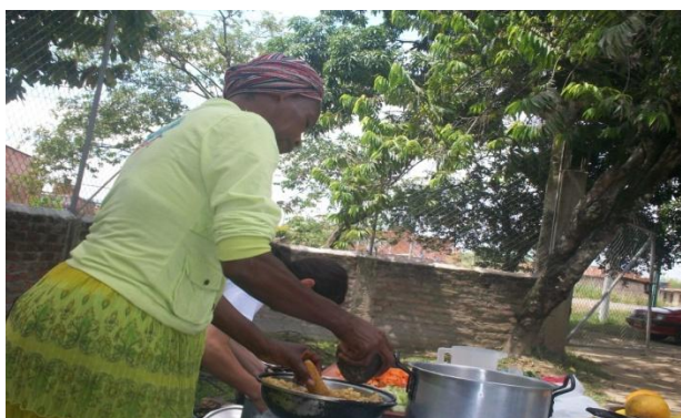
Fotografía 10. Pilar el plátano con piedra: técnica gastronómica tradicional norte caucana. 2014