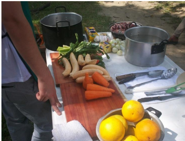
Fotografía 8. Ingredientes locales de producción campesina. (Plátano, cilantro cimarrón, cebolla cabezona, naranja, zanahoria). 2014