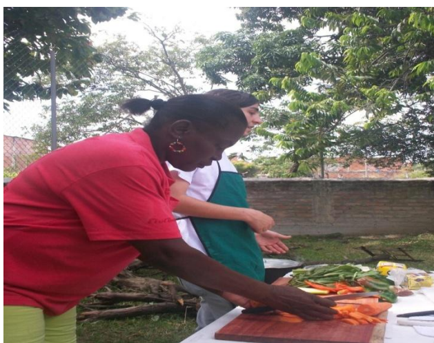
Fotografía 6. Taller gastronómico. Sabores tradicionales. Villa Rica, Cauca. 2014