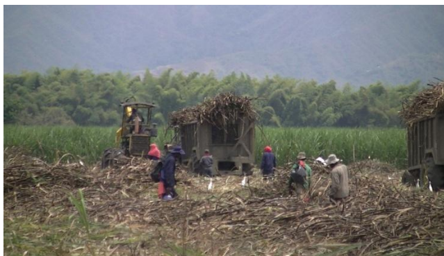
Fotografía 4. Corte de caña. Puerto Tejada, Cauca. 2014