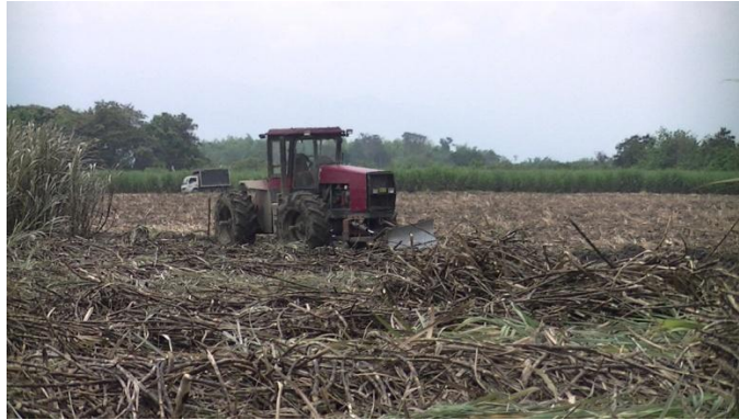
Fotografía 1. Cañal, post-cosecha. Puerto Tejada, Cauca. 2014