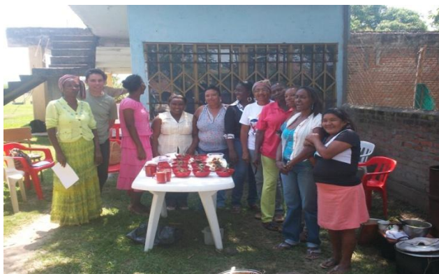
Fotografía 9. Taller gastronómico tradicional con mujeres del norte del Cauca. 2014