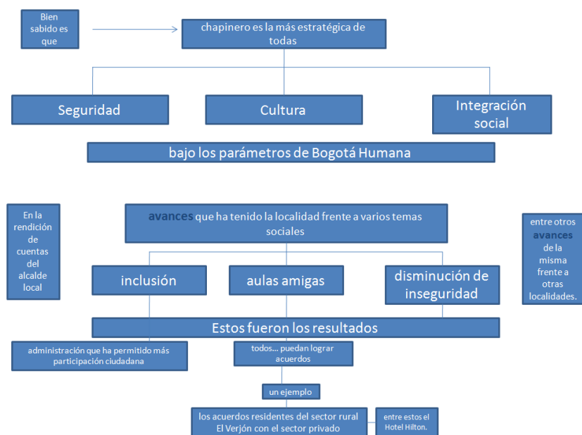
Figura 5. Macroestructura semántica de la editorial “Chapinero”

Nota. Visualmente es posible percibir la desconexión entre los sintagmas. Cada párrafo constituye una estructura por sí sola no desarrollada.