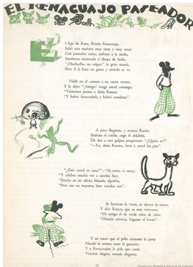
Figura 3. Rin Rín Número 1 (1936). Ejemplo de texto literario – El renacuajo paseador de Rafael Pombo –

De otro lado, los contenidos de los textos publicados en cada una de las secciones de la Revista eran de corte nacionalista cuyo propósito era la formación académica, cultural, personal y ciudadana de los niños de las escuelas primarias del país; finalidad que respondía a la curiosidad de los niños y, por supuesto, a las apuestas del gobierno liberal de López Pumarejo y su equipo de trabajo al interior del Ministerio de Educación Nacional en los dos periodos de mandato que tuvo en Colombia. Así quedó consignado en la Conferencia Nacional de Profesores de 1934, como se cita en Helg (1980):