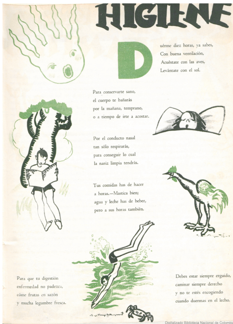
Figura 4. Rin Rin Número 1 (1936). La higiene.

Otro de los elementos presentes en la Revista Rin Rín es la colaboración de los lectores en donde se generó un espacio para que estos se motivaran a “ejercitarse” en la escritura y el dibujo, como lo menciona en la presentación de la Revista (Figura 2).