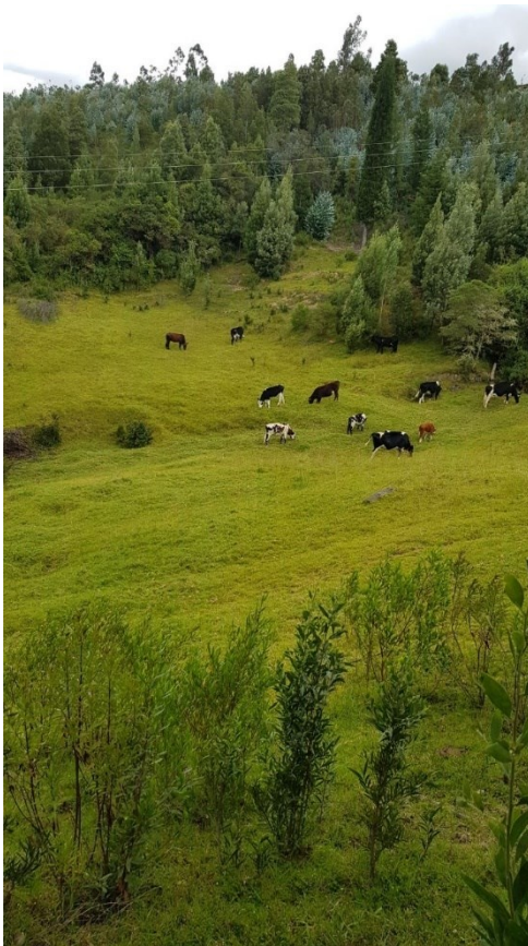
Ilustración 16: Lo inminente en el contexto familiar rural.

Para finalizar este recorrido, que emprendí y con el que me vi confrontada, a continuación, presento las conclusiones de la investigación sobre los hombres y las mujeres que me invitaron a interpelar la percepción de lo masculino en términos de la “otredad”, un otro que, en términos biológicos, no necesariamente se ve como hombre.