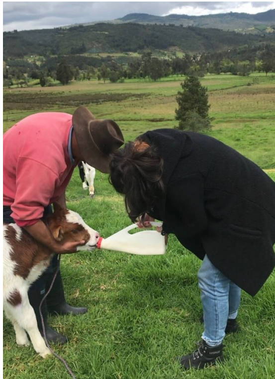
Ilustración 14: Aprender para (de)construir.

Algo que tienen en común los hombres y las mujeres de las tres generaciones es la exaltación de que la vida en el campo es “sabrosa”. Siempre que les pregunté por “cómo era crecer en el campo”, mencionaron que era un buen lugar: tranquilo, sano, que les había dado todo y en donde es bueno formar familia. Yo, como visitante esporádica, aprecio un aire distinto, un silencio amable, unos parajes hermosos y un lugar de descanso, pero también un espacio contenedor de experiencias. Esto pone de manifiesto las fronteras aún presentes entre lo urbano y lo rural, pero ¿qué pasa entonces con los prejuicios sobre el espacio rural y por qué el menosprecio al campesino en la ciudad?