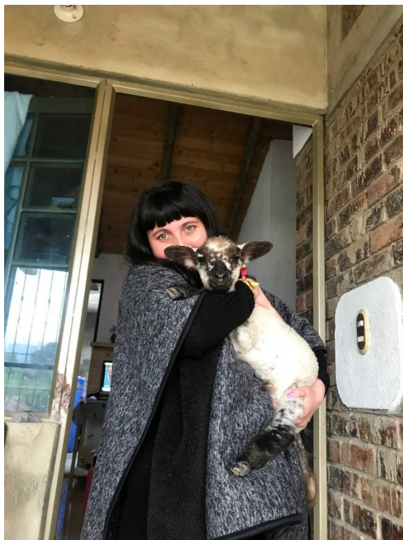
Ilustración 15: Lo sabroso del andar.

Este capítulo dio lugar a muchos códigos que no fueron previstos con anterioridad y que evidencian que, desde su cotidianidad, las dinámicas del campo no son para nada simples: el amor, el miedo, la masculinidad femenina, por medio de mi sentir como mujer feminista e investigadora, transformó lo que pensé que sería una investigación centrada en los hombres y las mujeres que ponen en escena prácticas performativas de masculinidad, aprendidas y perfeccionadas con el tiempo, y me mostró que esos tabúes, sanciones, prejuicios y odios, duelen y no agencian un cambio, y que las dinámicas que han funcionado históricamente se arraigan cada vez más. Hoy veo que el desprecio al campesino ha provocado que estos sean olvidados y que no se