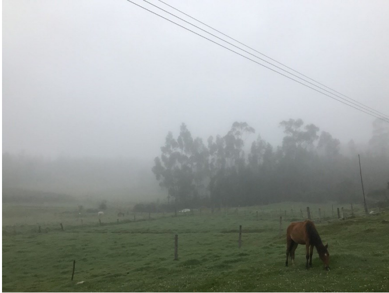
Ilustración 11: La cotidianidad del ser.

Conversar con los hombres de la investigación y tratar de leer sus expresiones corporales me ha llevado a pensar que a los hombres no los prepararon para hablar de su masculinidad: pueden hablar de su infancia con anhelo, de su vida en familia con orgullo, del campo con alegría, pero cuando se aborda cómo ellos se ven como hombres y cuáles masculinidades serían consideradas débiles, su voz