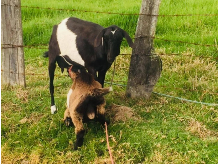
Ilustración 12: La fuerza del cuidado, del amar.

Es interesante ver cómo, a lo largo de las entrevistas de hombres y mujeres, se insiste en aquellas mujeres que tienen el patrón reiterativo de masculinidad. En este caso, muchos se refieren a la Abuela Azul-Blues, como a una mujer que “levantaba al que fuera”, que “no se la dejaba montar o robar”, que era “más fuerte que muchos machos que se veían por ahí”, y que hacía al tiempo las