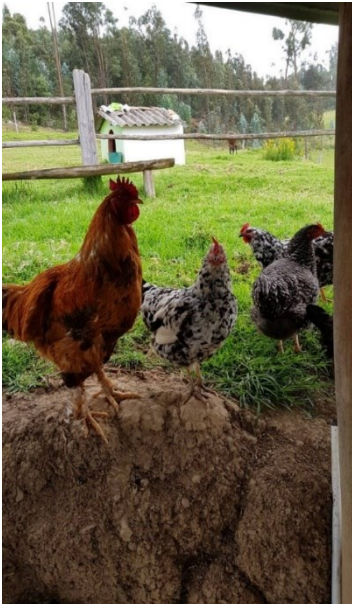
Ilustración 10: Situar el contexto desde el espacio circundante.

Esta es una de las frases que más profundamente atravesó mi corporeidad y mi ser-mujer. A nosotras nos han enseñado cómo llorar y nos han calificado históricamente como las “dueñas del drama”: lloramos cuando nacemos, al crecer, cuando nos “duele algo”, cuando perdemos a alguien, porque llorar nos es natural. Al escuchar a los hombres de la tercera generación se atisba una manera distinta de asumir las expresiones de la masculinidad en el campo: tanto el joven que está vinculado al campo como el que está inmerso en el espacio académico han sido criados por hermanos que han tenido las mismas pautas de crianza, pero sus contextos y sus experiencias sobre la vida les han permitido otra comprensión y otro relacionamiento con los otros, con el medio y con la naturaleza; no obstante, no se puede afirmar que ellos, por ser de la tercera generación, están completa o parcialmente excluidos de las prácticas de las anteriores