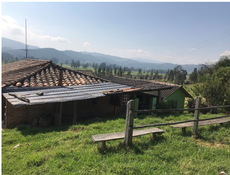
Ilustración 8: reconociendo el contexto familiar rural familia Salvia.