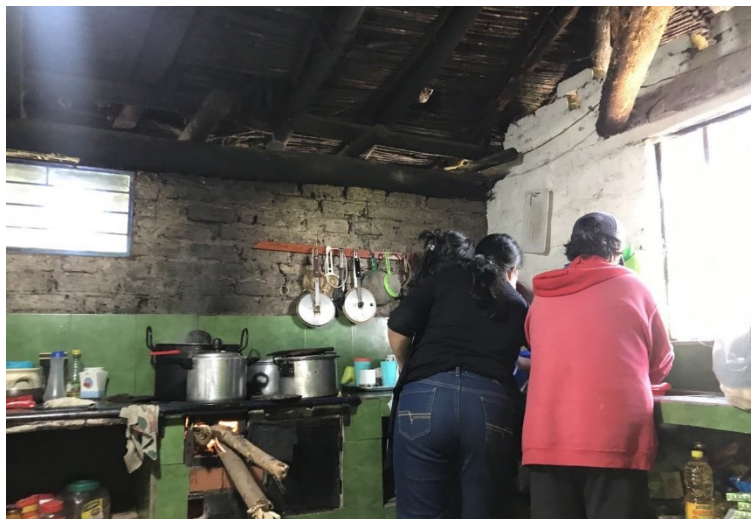
Ilustración 13: la cocina espacio de disputa.

En este apartado hablaré de mi experiencia como mujer, como feminista y como investigadora, a través de mi acercamiento a los contextos y de la narración de los objetos y de los cuerpos. Recuerdo la expresión de los “objetos políticamente incómodos”, esos que en mi propuesta investigativa me