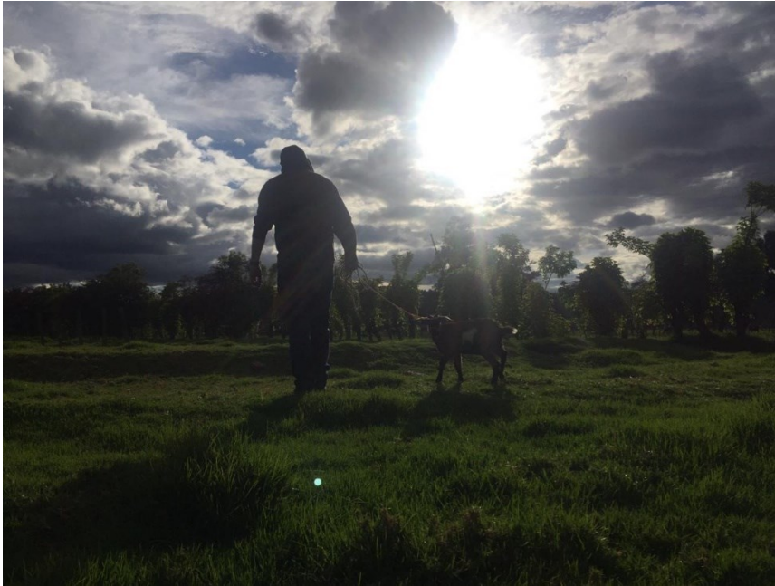
Ilustración 9: La masculinidad que se encuentra desde la "otredad".

Antes de iniciar, es importante señalar que este texto estará mediado por el diálogo permanente de las tres generaciones: la primera expone la potencia de aprender a trabajar desde la infancia en la ruralidad y el castigo como móvil; la segunda exalta la importancia de la transmisión de los “valores” que dejaron las anteriores generaciones, desde la creencia en que con una “buena crianza” y un diálogo