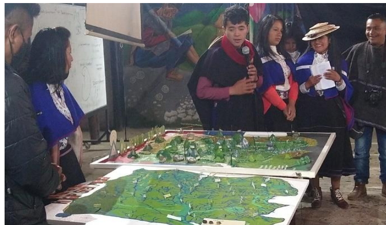
Figura 6. Reconocimiento de las lagunas. (YA)