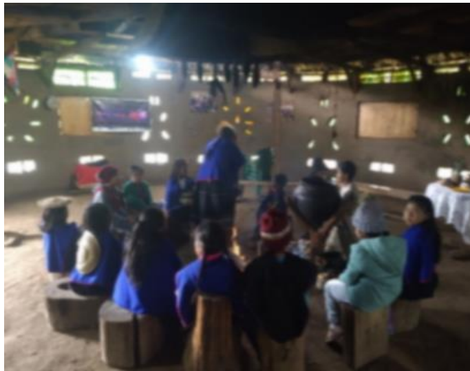
Figura 9. Volviendo al origen, hablando con abuelos y agradeciendo el territorio.

territorio y todo el tiempo realizan preguntas. El proceso educativo no tiene que ver con la educación institucional a la que desde occidente estamos acostumbrados, se trata de un proceso educativo en el que, a través de la palabra, el camino, las luchas cotidianas en familia, en colectivo es como se aprende, entendiéndose como ser en diálogo en interrelación con otros saberes, otros pueblos y otras personas.