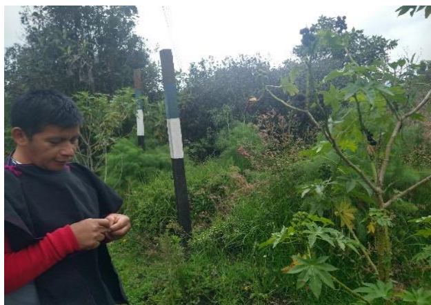
Figura 7. Archivo personal Medicina propia Misak Universidad

Fotografía de archivo personal, medicina propia, laboratorio Misak Universidad.