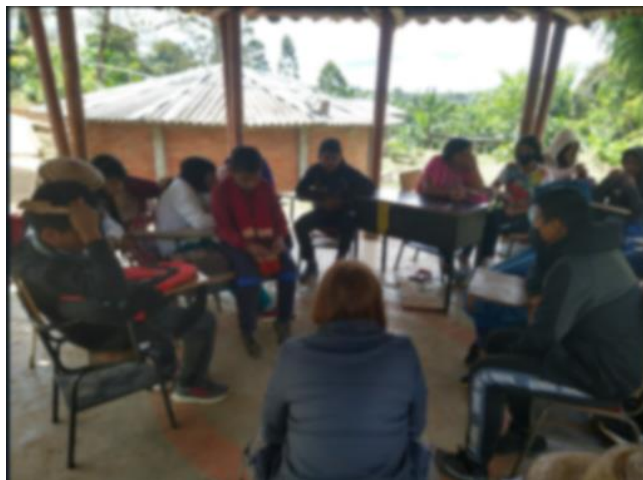
Figura 3. Fotografía Archivo personal, Piendamó, Cauca

Esta actividad se desarrolla con estudiantes de grado 5 y 6 en la escuela de Piscitau, la idea es primero realizar algunas preguntas con respecto a si están familiarizados con el tema, qué han escuchado al respecto, qué opinan, si saben cuáles son los motivos por los cuales se realiza esta acción de parte de su comunidad, qué es un juicio histórico.