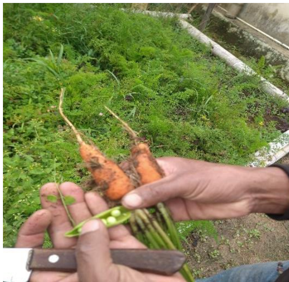
Figura 2. Huerto de cultivos orgánicos por la recuperación de la tierra envenenada de químicos.

Aquello de lo que hablaba el Tata Jesús Aranda expuesto en algunas citas diálogos obtenidos con él en territorio y que se encuentra en los anexos de este documento, se puede evidenciar en estos procesos, una relación entre el saber-poder que se ha aprovechado históricamente y que se ha mostrado desde una cara específica en la historia oficial en las escuelas, sin embargo, es de resaltar que las comunidades podrían no saber el castellano, pero entendieron muy bien las relaciones de poder que los ha llevado a sus reivindicaciones.