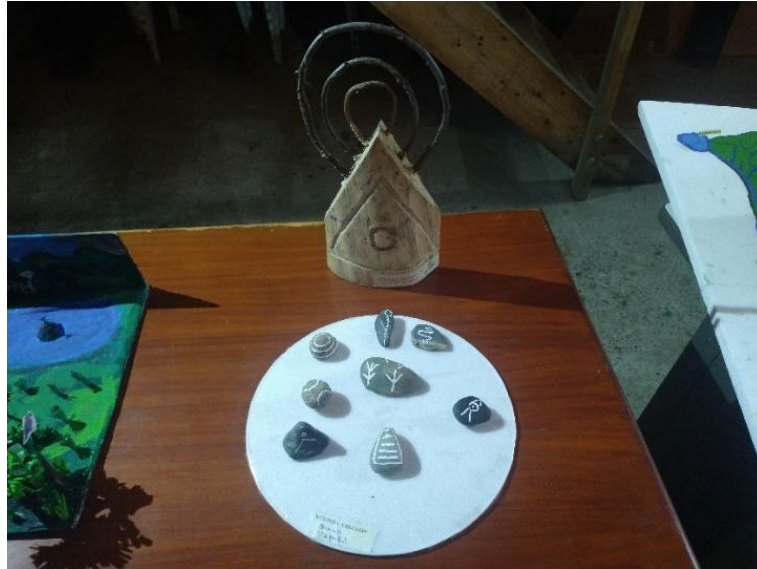
Figura 5. Archivo personal de lenguaje natural. (Universidad)

desarrollo las actividades consisten en recorridos a las lagunas sagradas, exploración y estudio del lenguaje natural, conocimiento del territorio, pisos térmicos, ubicación, cuidado, preservación y utilidad medicinal.