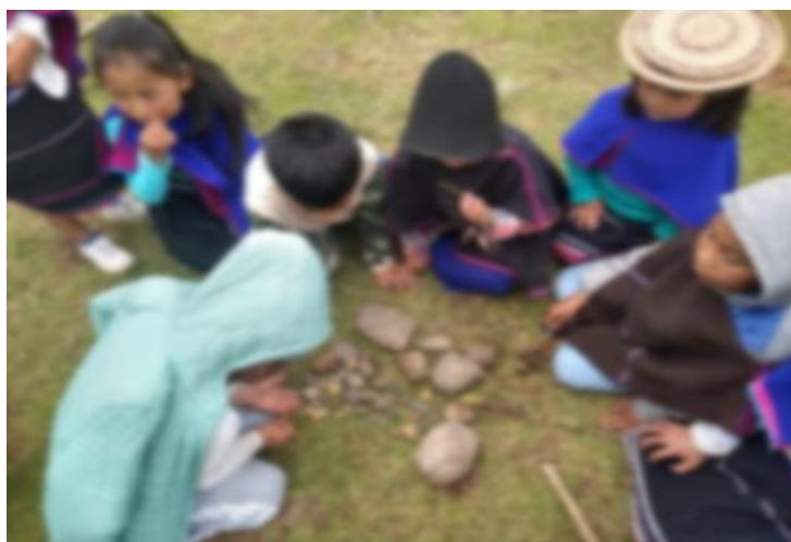
Figura 10. Recorriendo el territorio, niños de la comunidad. Reconocimiento y caracterización de rocas