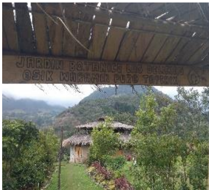
Figura 8.