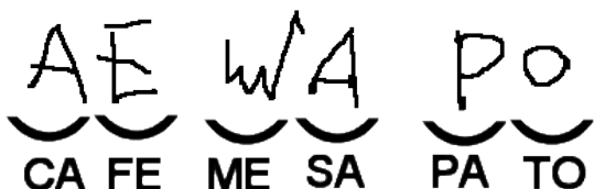
Imagen 3: "Hipótesis silábica"

La hipótesis silábica puede aparecer cuando el niño cuenta con la habilidad de reproducir formas.