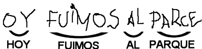
Imagen 5: "Hipótesis alfabética"

La hipótesis alfabética (cada letra representa un sonido). Implica que las escrituras presentan casi todas las características del sistema convencional, pero sin uso aún de las normas ortográficas.