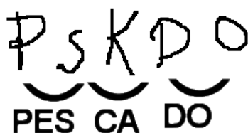
Imagen 4: "Hipótesis silábico-alfabética"

La hipótesis silábico-alfabética (oscila entre una letra para cada sílaba y una letra para cada sonido). Es un período de transición en el que se mantienen y se cuestionan simultáneamente las relaciones silábicas, por ello las escrituras presentan sílabas representadas con una única letra y otras con más de una letra.