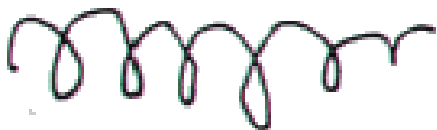
Imagen 1: “Trazos ondulados”

1 Nivel: El niño reproduce rasgos de escritura como trazos ondulados y rayas verticales discontinuas. La escritura no cumple función comunicativa.