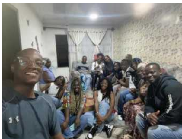
Fotografía 4. Familia Quiñones extensa.

La crianza en la familia Quiñones ha sido herencia de las prácticas de cuidado adoptadas a través de generaciones desde lo visto tanto en la familia como en la comunidad, también han sido influenciadas por un territorio específico, como lo es el municipio de Magüí Payán, por ello, es posible comprender cómo la crianza no es asumida únicamente por la madre o el padre,