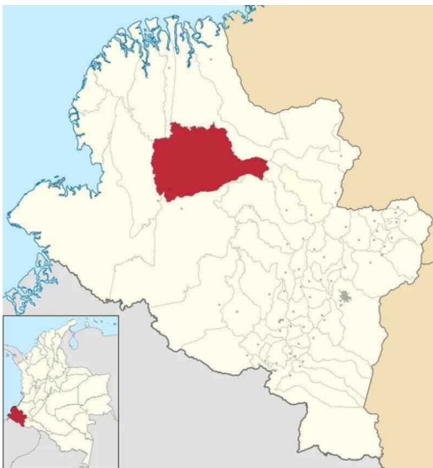
Figura 2. Mapa del territorio de Magüí Payán.

Magüí Payán se caracteriza por ser un pueblo profundamente arraigado al catolicismo, con una ferviente devoción a su santo patrón, Jesús de Nazareno, cuya festividad es una de las celebraciones religiosas más importantes y sentidas por su comunidad. Esta fe católica se mezcla con tradiciones afrodescendientes, creando un sincretismo espiritual muy propio del Pacífico colombiano.