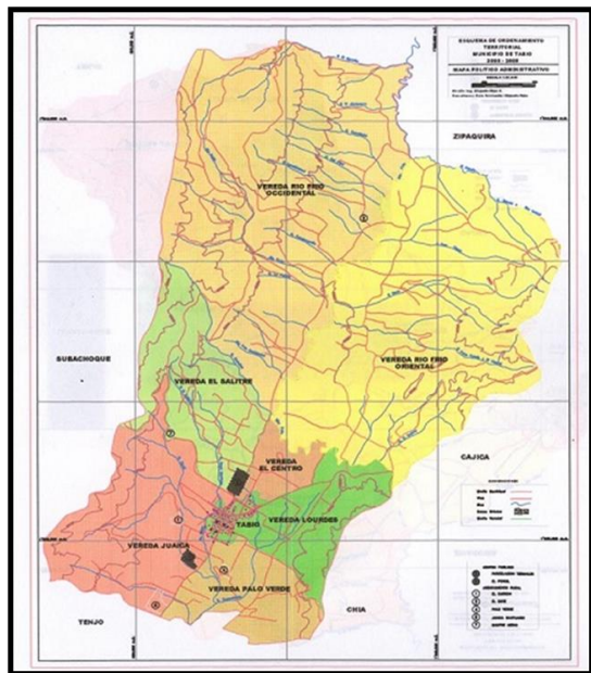
Imagen 3. Veredas de Tabio