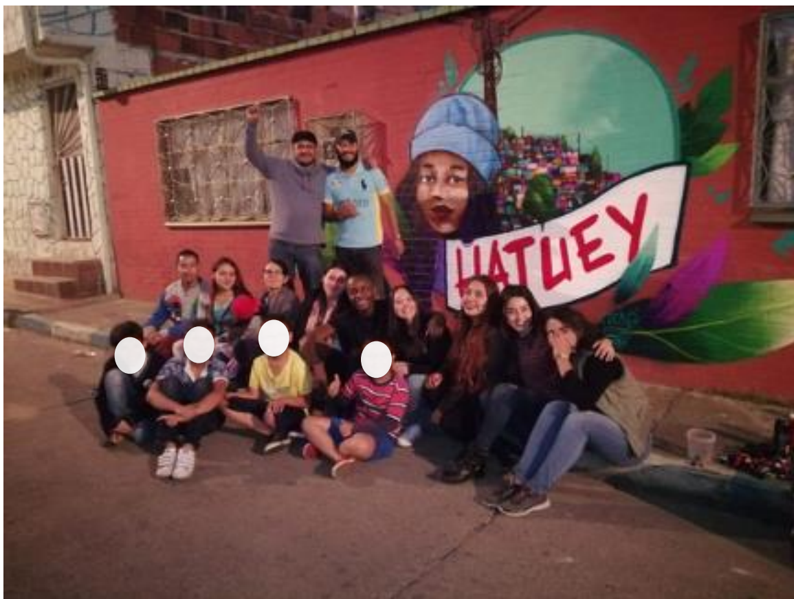
Figura 6. 2018, Conversatorio reconocimiento lideres y luchas barriales