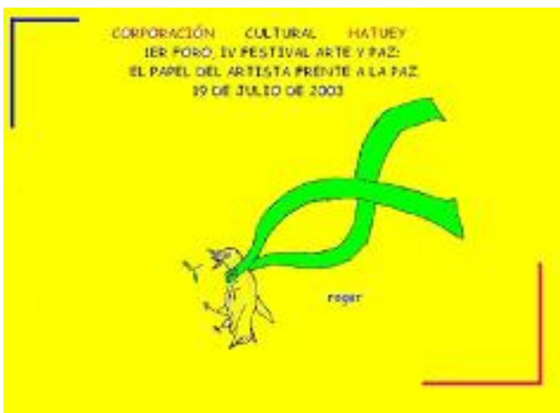
Figura 1. 2003, cuarto festival arte y paz (Centro Documental Corporación Cultural Hatuey)

Recorridos de la memoria: https://www.youtube.com/watch?v=NBbTunHrevE&t=219s