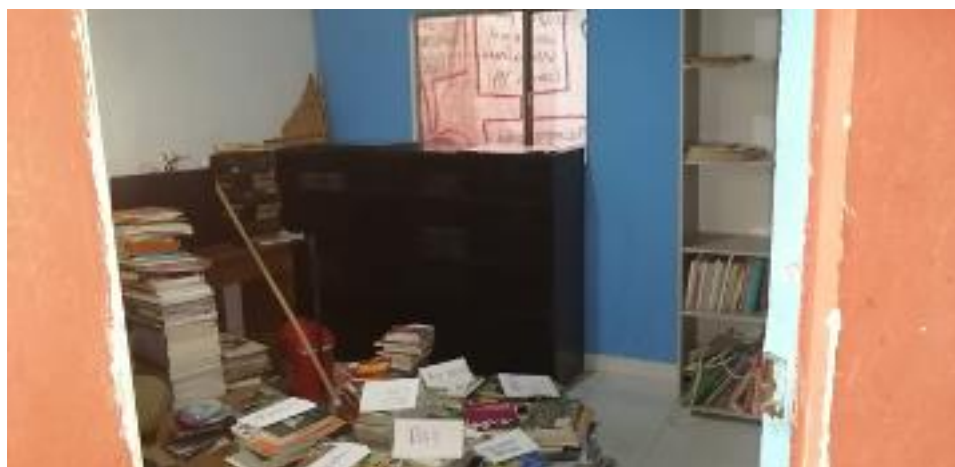
Figura 9. 2018, construcción del centro documental (Centro Documental Corporación Cultural Hatuey)

3. DIGITALIZAR Y ARCHIVAR: Concentrar y conservar los Archivos (escritos, prensa, audiovisuales, fotografías etc.) que Aporten al rescate de la Memoria Histórica de nuestros múltiples territorios (cuerpos, calles, casas, esquinas, barrios etc.) y momentos históricos a partir de la Violencia y sus espacios de resistencia.