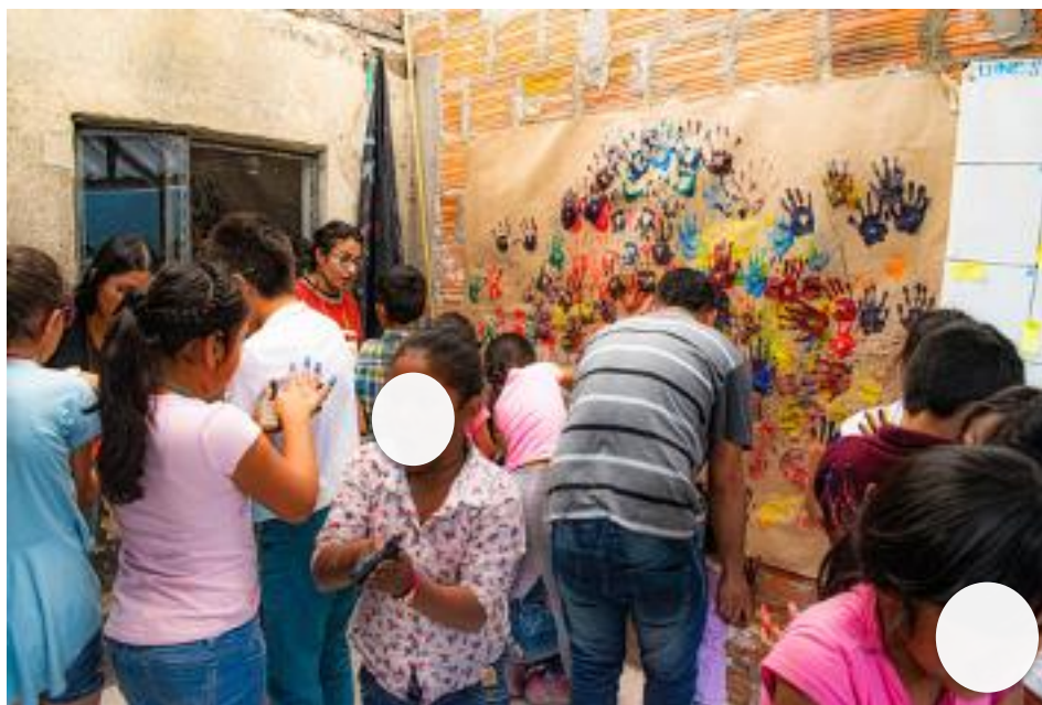
Figura 10. 2019 taller de artístico con niños y niñas, (Centro Documental Corporación Cultural Hatuey)

“En los modelos didácticos se sitúa la capacidad de memoria con propósitos meramente mnemotécnicos los cuales hacen de la educación un fin competente hacia la consecución de éxitos basados en la repetición, exigiendo la formación estandarizada de ciudadanos como requisito para el desarrollo de un conocimiento vendible, el cual ha contribuido a institucionalizar olvidos funcionales en el sistema educativo” (Ortega Valencia, Castro Sánchez, Merchán Díaz, & Vélez Villafañe, 2015)