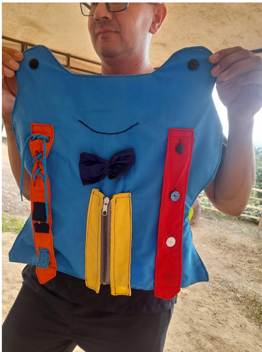
Ilustración 3 Material didáctico para trabajar la autonomía: