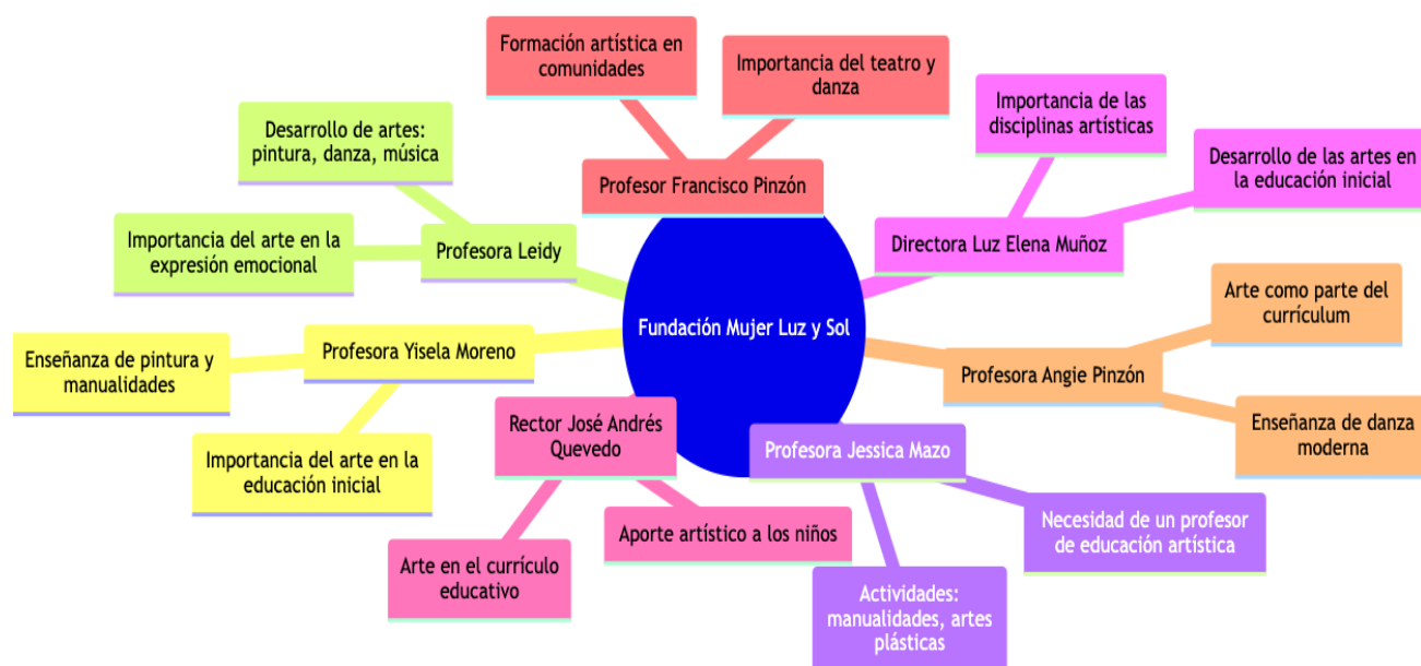
Ilustración 6 : Mapa Mental del Municipio de Anapoima