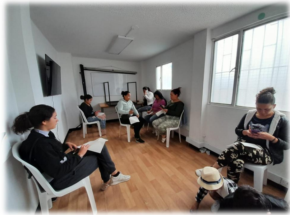
Ilustración 18. Tejiendo confianza

Objetivo: Promover el uso de la comunicación asertiva entre las mujeres participantes como herramienta para fortalecer el diálogo, mejorar la escucha mutua y facilitar la resolución de conflictos en los espacios comunitarios.