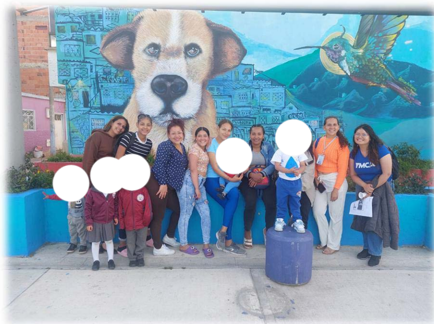
Ilustración 13. Biblioteca