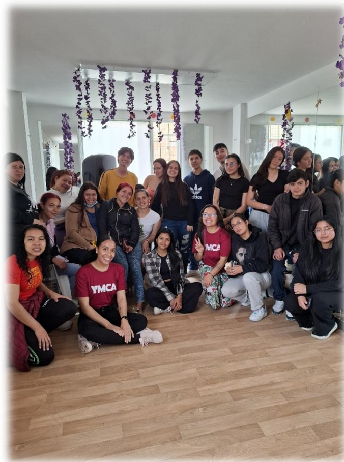
Ilustración 24. Cadenetas de cuidado.

Objetivo: Desarrollar una sesión vivencial y participativa que promoviera el autocuidado y el cuidado integral de las mujeres a través del baile, propiciando la expresión corporal libre, la conexión emocional y la construcción de vínculos positivos dentro del grupo. La actividad buscó que las participantes reconocieran el movimiento como una herramienta de bienestar, fortalecimiento personal y conexión colectiva.