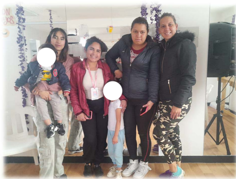
Ilustración 8. Primer encuentro.

Objetivo: Conocer el proyecto pedagógico Tejiendo relaciones de sororidad a través de las economías del cuidado , que busca fortalecer los vínculos entre mujeres mediante prácticas colectivas y el reconocimiento de las economías del cuidado como elemento central para la construcción de comunidades.