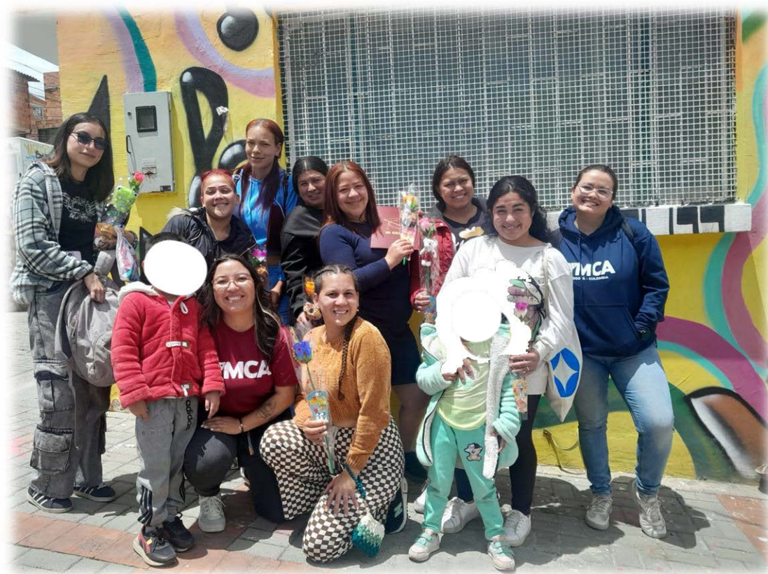
Ilustración 27. Último encuentro.

través de las economías del cuidado. Se les invitó a seguir siendo mujeres de cambio y a continuar capacitándose para transformar las estructuras patriarcales presentes en la sociedad. Las participantes se comprometieron a empezar por sus familias y a replicar estos aprendizajes en sus espacios personales y colectivos, con el fin de fortalecer las bases construidas en estos encuentros. Finalmente, la sesión se cerró con un abrazo y una foto de fraternidad.