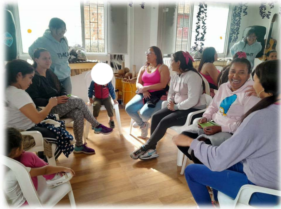
Ilustración 16. La sororidad para tejer colectividad

Objetivo: Reconocer las relaciones personales que marcaron la vida de las participantes y las formas en que se vincularon con su entorno.