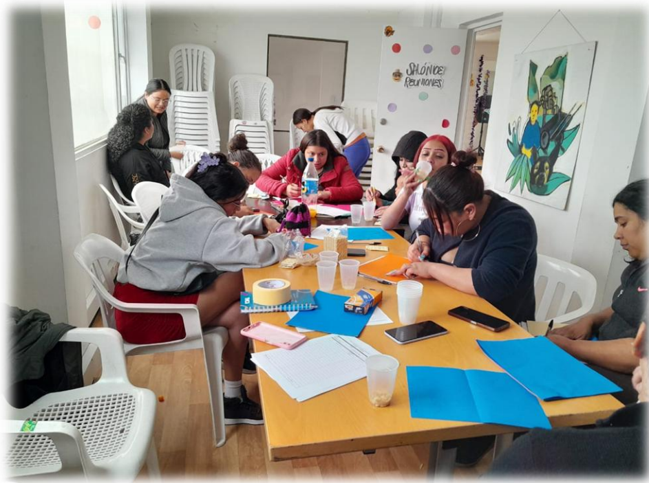
Ilustración 22. Punto alto herramienta colectiva.

Objetivo: Promover el fortalecimiento del reconocimiento individual y colectivo de las participantes mediante una actividad orientada a fomentar la empatía, el respeto y la solidaridad entre mujeres.