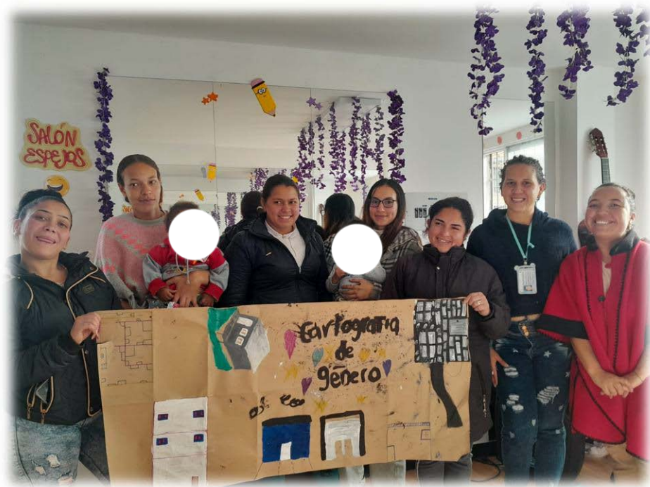
Ilustración 10. Cartografía de género entretejiendo.

Objetivo: Se buscó identificar los espacios seguros y las prácticas cotidianas de las mujeres en el barrio El Paraíso, con el propósito de reconocer los espacios comunitarios y colectivos presentes en su entorno.