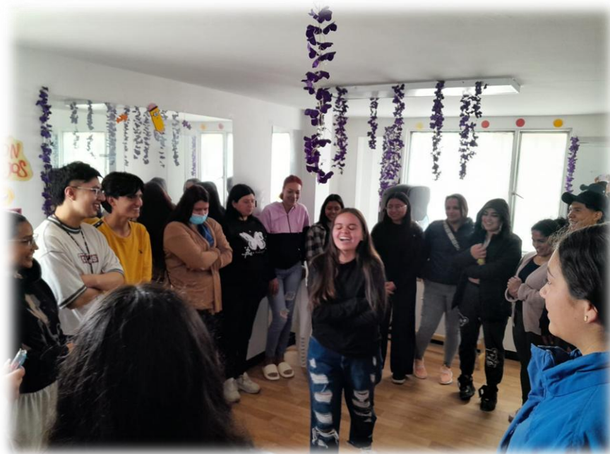
Ilustración 25. Baila y cuida.

En cuarto lugar, se realizó una reflexión colectiva entre las participantes y el grupo de invitados sobre la importancia del reconocimiento y la distribución de las tareas de cuidado y del trabajo no remunerado. Asimismo, se destacó la necesidad de generar espacios de encuentro que les permitan reconocer el autocuidado y el cuidado mutuo como parte de sus vidas, y de contar con entornos seguros que favorezcan la apertura y el diálogo. 6