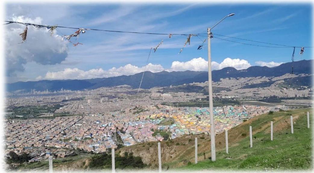
Ilustración 11. Parque el Mirador del Paraíso.