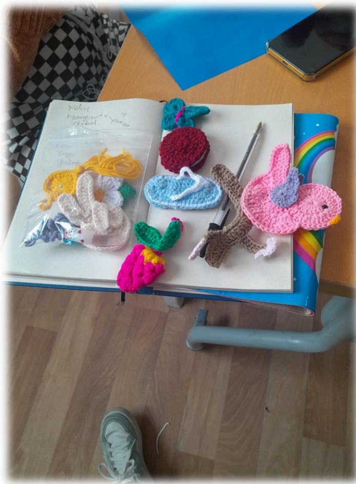
Ilustración 26. Álbum fotográfico tejiendo relaciones de sororidad a través de las economías del cuidado.

Objetivo: Crear un álbum fotográfico colectivo que visibilizara y reconociera los saberes de cada una de las participantes, reflejando sus experiencias, trayectorias y aportes dentro del espacio comunitario. Este álbum se constituyó como un recurso para la memoria colectiva y la valoración de las prácticas cotidianas de las mujeres, fortaleciendo el sentido de pertenencia y la identidad compartida.