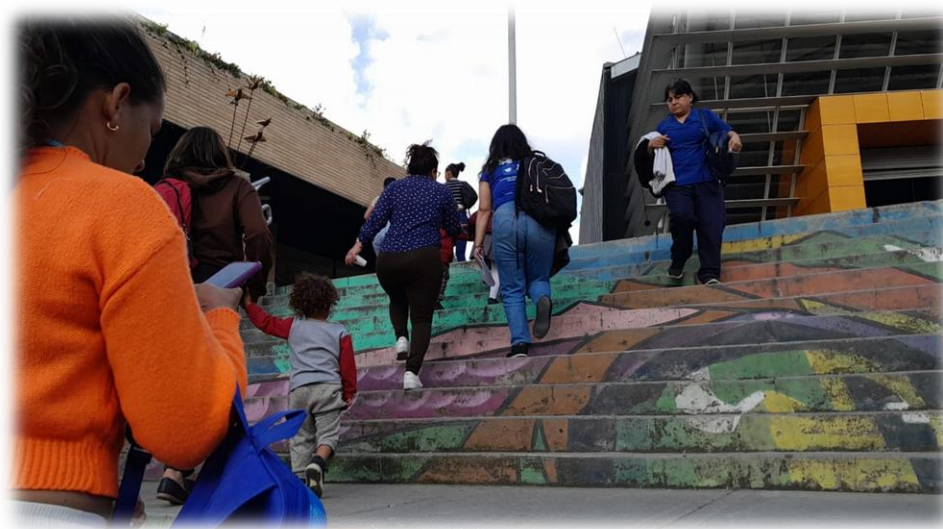
Ilustración 14. Estación de trasmicable Paraíso.

Finalmente, las participantes concluyeron que en este espacio se sienten más seguras, porque al no haber grandes aglomeraciones como la de los alimentadores se pueden reducir el riesgo de sufrir algún tipo de violencia de género.