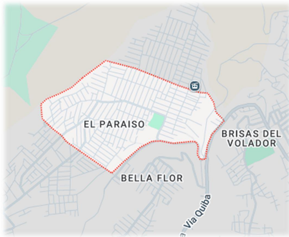
Ilustración 5. Mapa Barrio El Paraíso