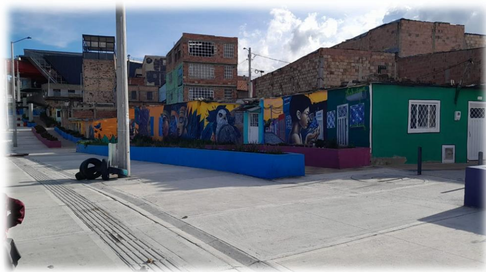
Ilustración 12. calle de los grafitis.