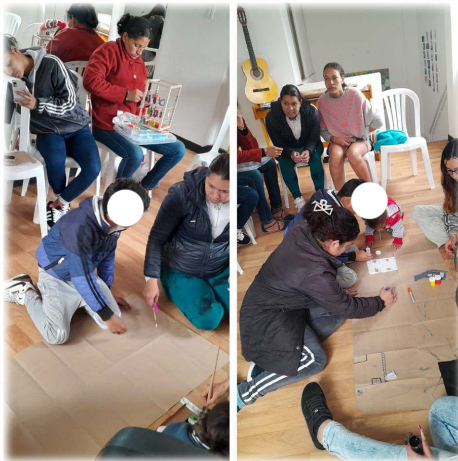
Ilustración 15. Creación cartografía.

y propiciaba la reflexión sobre sí mismas; compartir sus vivencias les permitió liberarse y respaldar a otras mujeres en distintos ámbitos de su vida, y especialmente en este encuentro colectivo.