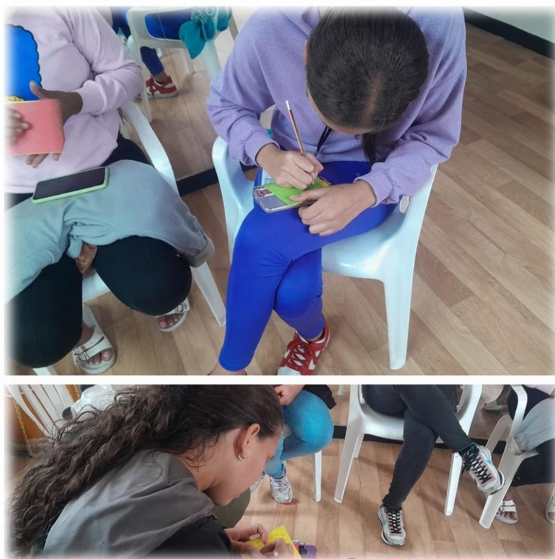
Ilustración 17. Espacio de los papeles de colores

En cuarto lugar, finalmente, se agradeció a las participantes por su participación y por las conclusiones que aportaron al espacio. Cada una plasmó en un papel blanco una frase o un dibujo que quisiera entregar a alguna de sus compañeras, con el objetivo de promover la confianza entre quienes compartían el espacio. Todas realizaron la actividad, ya que se sentían identificadas con las historias de sus compañeras y les permitió abrir más su corazón.