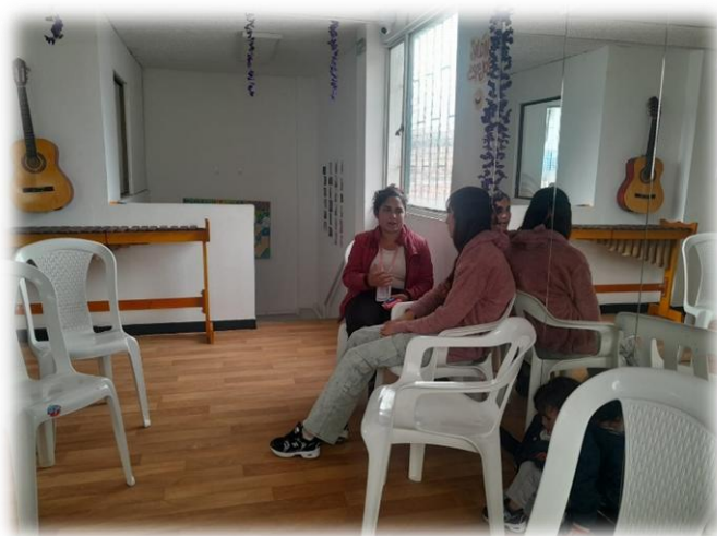
Ilustración 19. Dialogo comunicación asertiva

En cuarto lugar, se cerró el espacio con una reflexión sobre la importancia de la comunicación asertiva y activa, así como sobre la relevancia de generar espacios colectivos mediante el diálogo y el reconocimiento de la otra. Se abordó también la resolución de conflictos a través de la escucha, la creación de puntos de encuentro como los círculos de palabra, y, finalmente, la importancia de acoger sin juicios a quienes necesitan ser escuchadas.