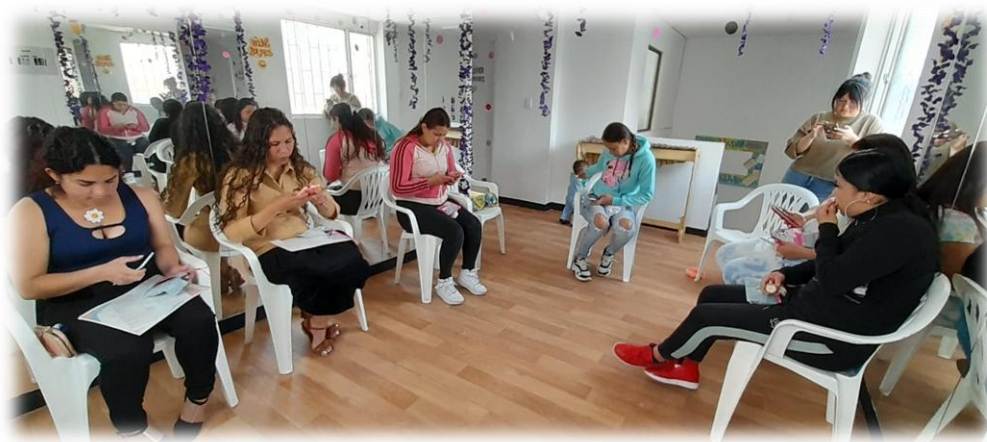
Ilustración 6. Primer encuentro

En el año 2025, retomando y buscando seguir aportando a las mujeres y atendiendo las necesidades identificadas en el informe, la organización estableció un convenio con la Fundación Mujeres Guerreras. A través de este convenio se busca facilitar la educación para personas adultas, permitiendo que ellas culminaran la primaria y el bachillerato en modalidad a distancia mediante guías pedagógicas, dado que muchas no pueden desplazarse debido a sus labores de cuidado familiar. En este proceso participaron alrededor de 10 mujeres, pertenecientes a la localidad, quienes, debido a situaciones relacionadas con el cambio de país o dificultades personales, no lograron culminar sus estudios o no pudieron homologarlos en Colombia.