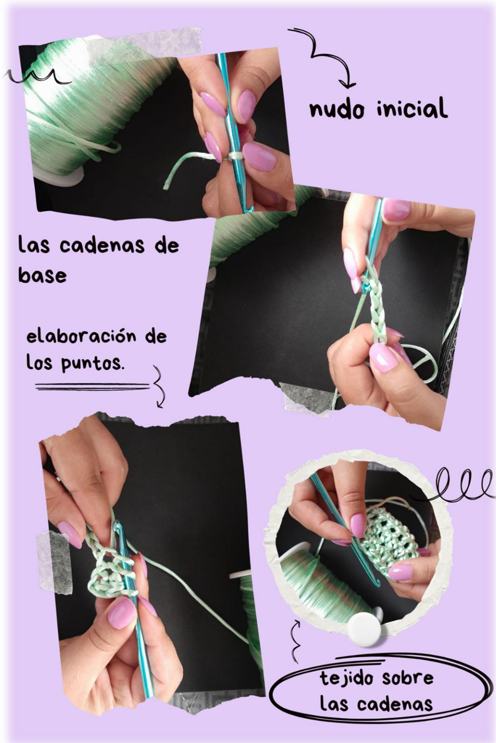
Ilustración 1. Etapas del tejido