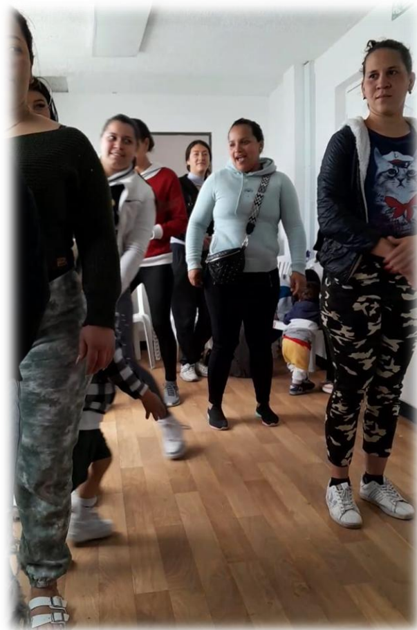
Ilustración 23. Realización de preguntas

generar espacios de cuidado, autocuidado y sororidad para fomentar la confianza y el apoyo entre mujeres. 5