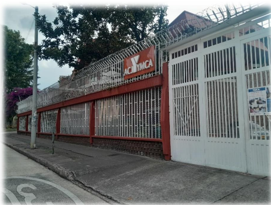
Ilustración 3. Instalaciones de la Asociación Cristiana de jóvenes-YMCA, sede Bogotá