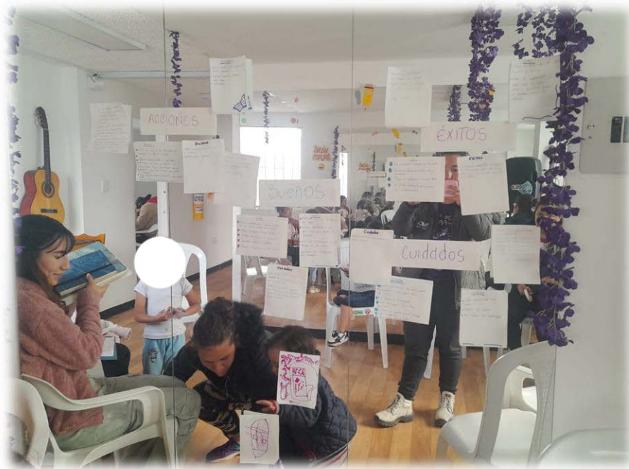
Ilustración 20. Puntadas de sueños, acciones, éxitos y cuidados.

Objetivo: Identificar los sueños, acciones, éxitos y prácticas de cuidado que las mujeres realizaron o anhelaron para su vida, con el propósito de reconocer sus aspiraciones personales, su proyección hacia el futuro y las estrategias que fortalecieron su cuidado integral.