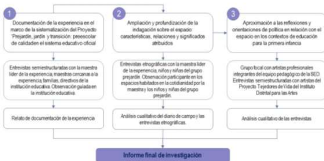
Esquema 1. Procesos, técnicas y resultados a la base de la indagación y el campo de la investigación.

Como se ha señalado, para el desarrollo del trabajo de campo se optó por configurar una estrategia mixta que diferenció la aproximación a la cotidianidad en el colegio seleccionado, y las indagaciones con los profesionales de la SED y de IDARTES. Bajo la primera aproximación se configuró una propuesta con dos entradas: una, orientada hacia la documentación de la experiencia basada en la combinación de técnicas cualitativas que incluyeron observación guiada, entrevistas y grupos focales 16 ; otra, que orientó la profundización sobre el espacio como objeto de estudio, apoyada en un enfoque etnográfico que conjugó la observación participante, las entrevistas etnográficas con los niños, las niñas y la maestra del grado prejardín, y un taller creativo centrado en el recorrido por el colegio y la reflexión sobre los espacios que habitan los niños y las niñas