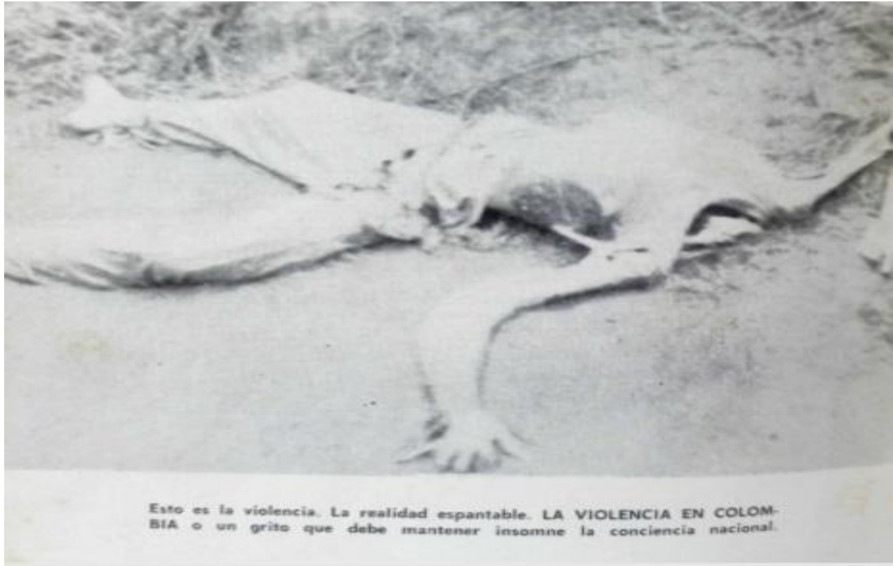
Imagen 4: La violencia en Colombia. Esta es la violencia, la realidad espantable , 1962.