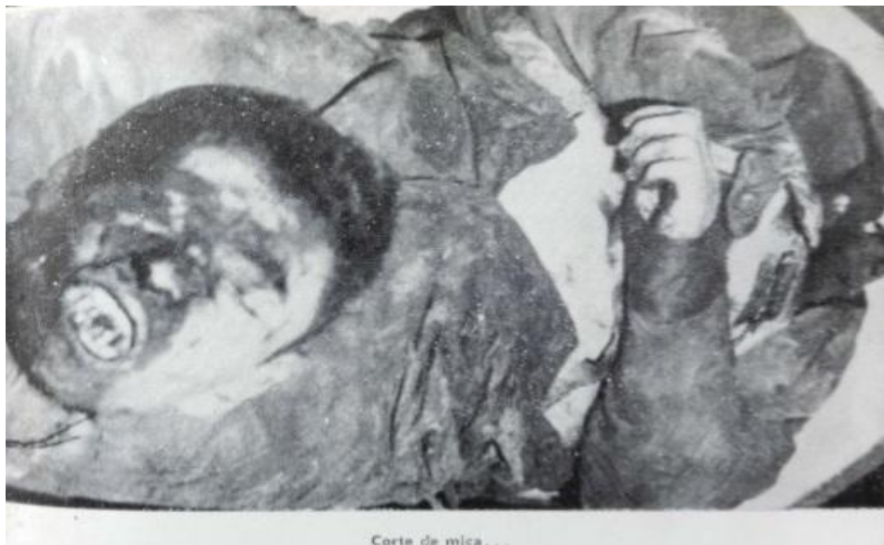
Imagen 3: La violencia en Colombia. Corte de mica , 1962.