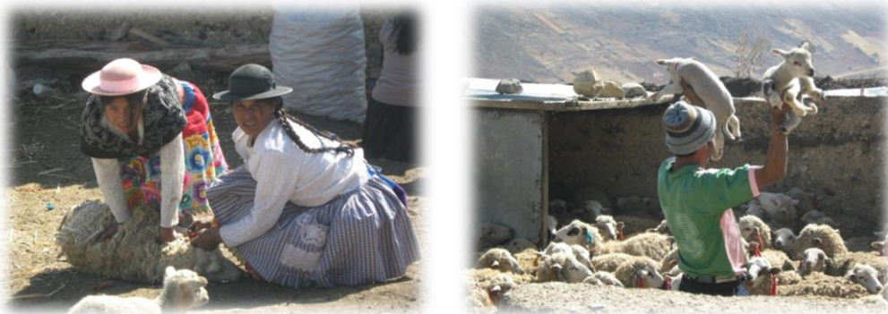
Fotos 19 y 20. Imágenes ritual de marcaje de los ganados y corral andino

5.6.1 Tayta Shanty o fiesta de Santiago: Otras de las festividades características del distrito y de la región andina son la fiesta de Tayta Shanty o fiesta de Santiago; el Santiago es considerada la fiesta del ganado en donde se festeja el crecimiento o reproducción de los rebaños, también es asociada a nivel histórico como una celebración en la cual se modificó su nombre bajo el nombre de Santiago en honor al apóstol fruto de los procesos de colonización. Se celebra hacia los meses de julio, agosto y septiembre, la cual consiste en una secuencia de pasos riticos mediante los cuales se da marcaje a los ganados en los corrales y cerros andinos a partir la postura de cintas de colores en las orejas de los animales.