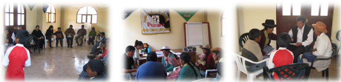
Fotos 57, 58 y 59. Imágenes Taller con dirigentes comunales y líderes de las AEIs Talhuis, Rumichaca y Pucapuquio, sobre violencia familia y sus efectos en el desarrollo infantil. (Agosto de 2010).

Lo anterior se muestra en evidencia en la expresión de una de las jóvenes miembro de la junta directiva de la una AEI al expresar que: