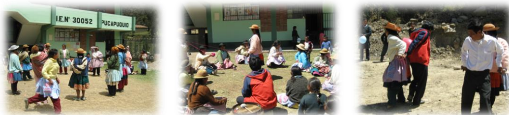
Fotos 64, 65 y 66. Imágenes Talleres de Integración Comunidades de Pucapuquio y Talhuis (agosto de 2009)

Los talleres con los padres, como se orientaban con los niños se hicieron también bajo el lema de “aprender jugando”, como los padres andinos asumen el juego en la mayoría de los casos como perder el tiempo por ser un espacio improductivo, existía el temor de no poder orientar las actividades con ellos a partir de la lúdica reflexiva, como estrategia encamina a generar comprensiones y reflexiones sobre el desarrollo de las hijas y los hijos y su mundo asociado al juego y la imaginación creativa. Finalmente en medio de risas y asombros las mamás principalmente inician la aventura hacia el aprender jugando, en el reencuentro de la infancia y el encuentro hacia otras formas de entender a sus hijas e hijos en su condición de desarrollo infantil y juvenil.