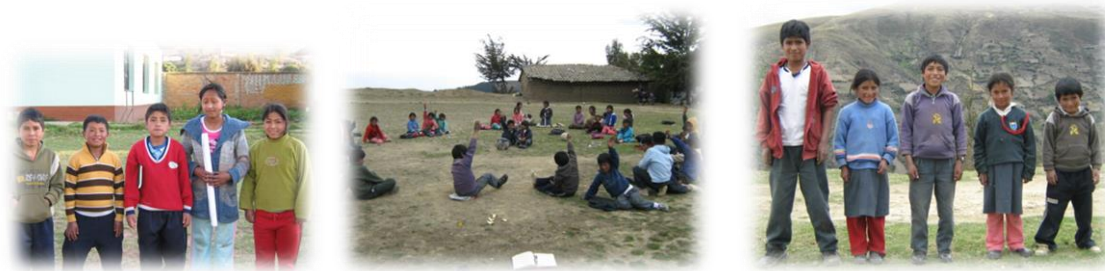
Fotos 34, 35 y 36. Imágenes Conformación AElS comunidades Rumichaca y Talhuis (Junio de 2009)

Como hacia mediados del año 2009, después de diferentes acciones y actividades formativas adoptando la metodología de taller, en la implementación de temáticas como, trabajo en equipo, capacidad organizativa, liderazgo, derechos y responsabilidades, organización se da la elección de las juntas directivas de las AElS de las nueve comunidades del distrito, conformadas por una junta directiva de base integrada por un presidente, vicepresidente, secretaria(o) y dos fiscales.