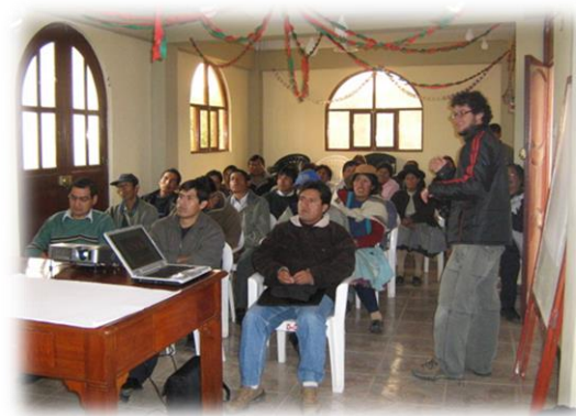
Fotos 69 y 70. Imágenes Taller con dirigentes sobre derechos y problemas campesinos en los diversos espacios sociales Comunidades de Pucapuquio, Raquina, Pachacha, Rumichaca (Agosto de 2009)