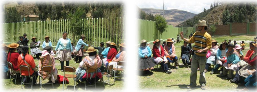
Fotos 62 y 63. Imágenes Taller Desarrollo Integral Campesino Serrano, Comunidad de Pucapuquio (Septiembre de 2009)

Otras de las pedagogías propias dinamizadas eran el puschcar o el tejer lana de oveja mientras se participa en las temáticas, como lo hacen las mujeres en las cumbres de los cerros mientras pastorean los rebaños o cuando asisten a sus faenas o reuniones comunitarias.