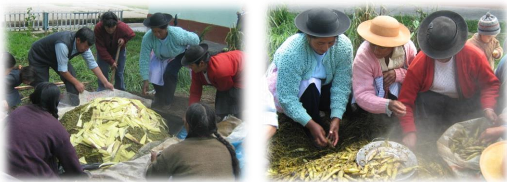
Fotos 9 y 10. Imágenes forma tradicional de preparación de la pachamanca “olla de tierra”

que aromatizan la tierra y los alimentos, se retiran las habas y las humitas que humeantes dan la seña a los comuneros que la destapada ya se inició. Luego se retiran las carnes que son depositadas en platos diferentes y finalmente sacan las papas. Hacia ese momento es común escuchar comentarios principalmente de las mujeres quienes hablan en quechua o en español sobre los resultados de la cocción de los alimentos, se pueden escuchar apreciaciones propias del oficio como ¡la piedra estuvo muy caliente!, ¡estas humitas salieron quemadas! .