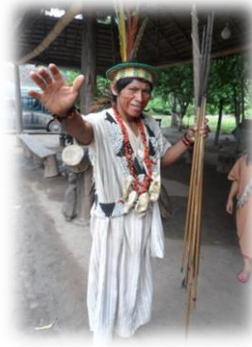
Foto 2. Jefe indígena Amazónico Ashanika (Registro Peña, M.T. enero de 2012)

El departamento a nivel fisiográfico presenta un relieve accidentado por estar atravesado por las cordilleras Central y Occidental, que dan origen a grandes e importantes unidades hidrográficas, como: Tambo, Perené, Ene y Mantaro. El valle del Mantaro se constituye como el más importante, al estar formado por el río Mantaro y concentrar un alto porcentaje de la población departamental. La zona de ceja de selva y selva presenta una orografía muy compleja y ondulante, donde se ubican importantes centros productores como son los valles de Chanchamayo, Perené y Satipo.