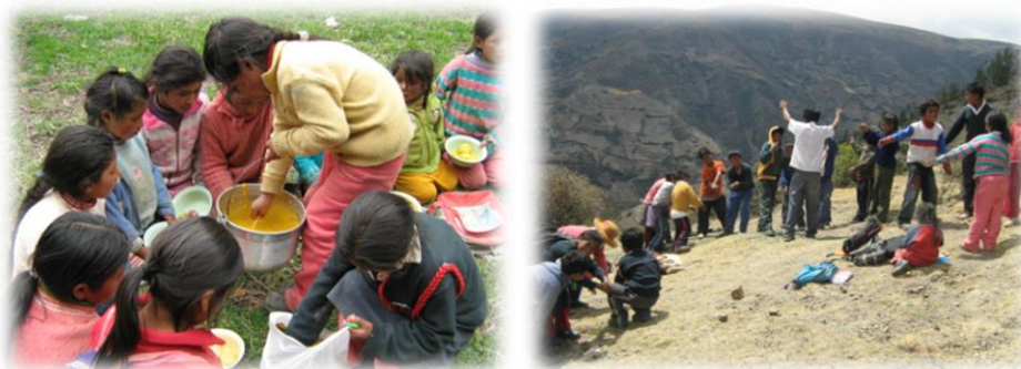
Fotos 39 y 40. Imágenes AEIs en taller de integración comunidades de Pucapucquio y Talhuis (marzo de 2009)

En este contexto de la experiencia de formación integral, resignificando el papel de la escuela y las pedagogías en contexto, la identificación de los escenarios propiciatorios para la formación organizativa de las AEIs, constituye un factor importante al momento de motivar habilidades, el espíritu organizativo y de liderazgo de los niños y jóvenes. De alguna forma todos los recursos y estrategias formativas los ofrece el contexto representado en el ecosistema andino y las particularidades socioculturales de las comunidades andinas, como lo pudieron ser la motivación de actividades a partir de comidas de integración, recorridos en la comunidad, talleres en los cerros, río y otros.