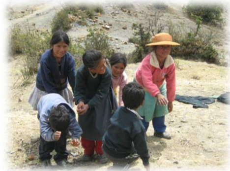
Fotos 41 y 42. Imágenes niños AEI en taller de Expresión Comunidad de Talhuis (Julio de 2009)

La lúdica y la competencia sana despliegan en los niños y jóvenes otras formas de sentir, su desarrollo en su propio contexto sociocultural, aparentemente desconocido o ignorado por las urbes peruanas y las políticas educativas y sociales del gobierno central.