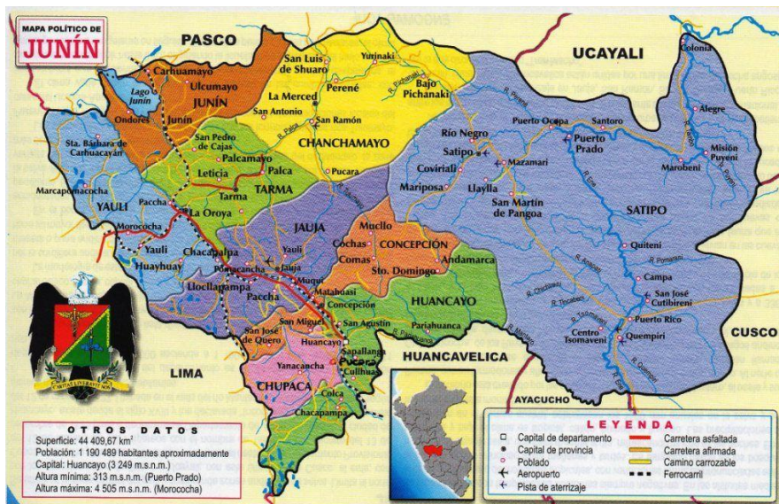
Mapa 1. Mapa Político Departamento de Junín (PRODEI, 2008)

El departamento a nivel fisiográfico presenta un relieve accidentado por estar atravesado por las cordilleras Central y Occidental, que dan origen a grandes e importantes unidades hidrográficas, como: Tambo, Perené, Ene y Mantaro. El valle del Mantaro se constituye como el más importante, al estar formado por el río Mantaro y concentrar un alto porcentaje de la población departamental. La zona de ceja de selva y selva presenta una orografía muy compleja y ondulante, donde se ubican importantes centros productores como son los valles de Chanchamayo, Perené y Satipo.