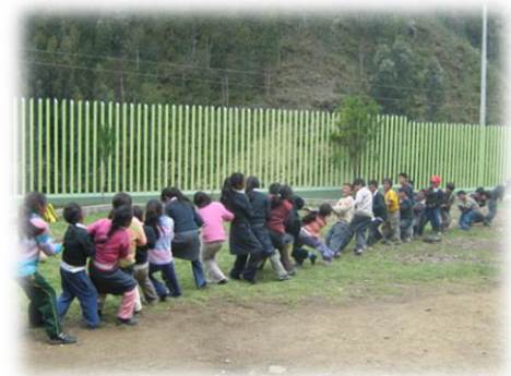
Fotos 43 y 44. Imágenes AEI en taller de trabajo en equipo Comunidad de Pucapuquio y Rumichaca (Agosto de 2009)

La configuración de las AEIs, como experiencia en donde las niñas, niños y jóvenes son los protagonistas de su propia historia, devela una trascendencia a las familias andinas, a la misma escuela formal, a las estructura organizativa formal y tradicional de las comunidades andinas, en donde las formas de concebir y asumir la educación se despliega más allá de los institucionalizado y normativo, se sitúa en la praxis, en el contexto, en su realidad sentida.