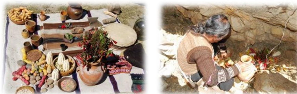
Fotos 15 y 16. Imágenes mesa ritual andina y Layqa ofrendando en el pacchashimi "boca de tierra"

familias andinas disponen en un lugar subterráneo de sus casas de un pequeño altar, cerca de la tierra, donde realizan sus ofrendas a la Pachamama . Una de las razones por las que los pagapus han dejado de hacerse en el distrito de Pucará es la religión cristiana que quiso eliminarlos al tratarse según los principios doctrinales de un ritual pagano.