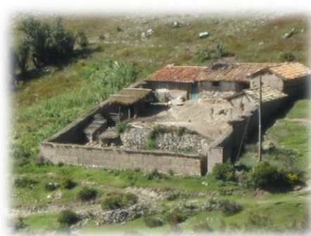
Fotos 11 y 12. Imágenes construcción y casa tradicional andina

Los adobes ya secos son colocados o dispuestos en el contorno de la de la base, en ese momento aparece otra función que es la de los colocadores, quienes son los que apilonan y pegan con barro fresco los adobes uno encima de otro, generalmente para este proceso para que las paredes queden