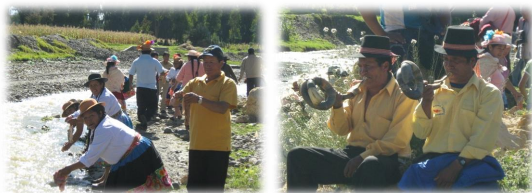
Fotos 23 y 24. Imágenes momento del lavado de tripas y corneteros andinos

celebración se sacrifican principalmente los toros cebados o engordados unos meses antes, los cuales son donados por el mayordomo (figura tradicional adaptada de la colonia) u ofrecidos por los invitados a quienes ha comprometido con el sostenimiento de la fiesta.