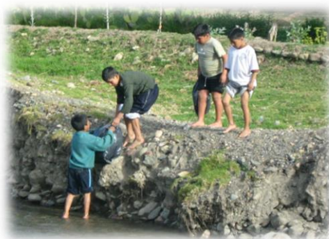
Fotos 49 y 50. Imágenes AEIs en taller medioambiental Comunidades de Pucapuquio y San Lorenzo (septiembre de 2009)

“(...) cuando hicimos la organización empezamos a realizarlo de una forma muy divertida nos organizamos para poder dirigirnos a diferentes partes como a la descontaminación de los ríos. En la descontaminación del río tuve una