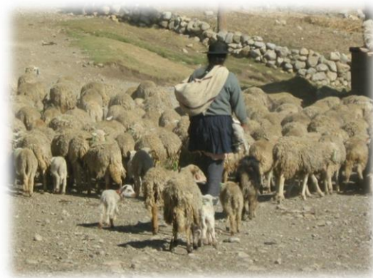
Fotos 5 y 6. Imágenes actividades tradicionales agropecuarias del Distrito de Pucará

En cuanto a las formas de cultivo se dan en integración de formas de producción rudimentaria es decir, tradicional en huertos o chacras cultivadas en las laderas de los cerros, irrigadas por canales o acequias mediante formas de labrado con técnicas e instrumentos ancestrales como la implementación de la chaquictalla (herencia pre-Inca) , en la actualidad se mantienen técnicas como el arado mediante tracción de bueyes (forma predominante heredado de la corona española) y la inserción del tractor en menor escala principalmente por las condiciones topográficas y bajos recursos económicos. Actualmente en relación a las formas de tenencia de la tierra se establecen a partir de diferentes figuras: Comunales que son las cedidas y controladas por la comunidad, privadas tierras escrituradas. Las tierras son cultivadas tanto dentro de las unidades familiares para el autoconsumo y venta, como arrendadas por empresarios de la ciudad, las cuales son cultivadas por comuneros del distrito quienes venden su mano de obra tanto para el arado, siembra y cosecha.