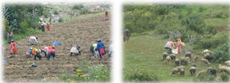
Fotos 60 y 61. Imágenes familias andinas en actividades agropecuarias tradicionales (Mayo-junio de 2009)

Incidencia Formativa con padres 2009: Dispuestas en los cerros las familias andinas dinamizan su vida cotidiana en sus quehaceres en medio de los rebaños y las verdes chacras surtidas de hortalizas, la apuesta por el proceso formativo en medio de las formas tradicionales de trabajo comunitario como expresiones de educación y responsabilidad que desde pequeños, los hijos aprenden mediante procesos de endoculturación o transmisión de conocimientos, prácticas y creencias andinas, se constituyen en factores importantes a considerar, pues dichas expresiones corresponden a su identidad, reflejo de los patrones culturales de las familias andinas.