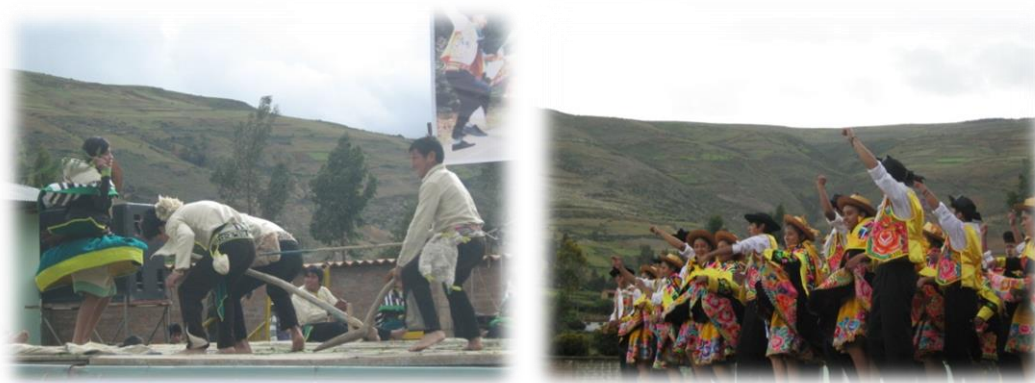
Fotos 17 y 18. Imágenes coreografía huaylars antiguo y huaylars moderno.

La fiesta conocida como el huylars o fiesta del trabajo del amor, festividad que denota a Pucarà como la cuna del huylars , celebrado principalmente hacia el mes de febrero el cual coincide con la celebración de los carnavales en el mundo. En el distrito y la región andina el huylars se clasifica en dos modalidades el huylars antiguo ( Aushutatay ) o re cultivo `de la papa y huylars moderno (comercial) el cual consiste en danzar al son de música del mismo nombre coreografías que representan y ambientan la siembra y cosecha de los productos andinos, al igual que la imitación de animales andinos como el zorzal, chihuaco (aves andinas).