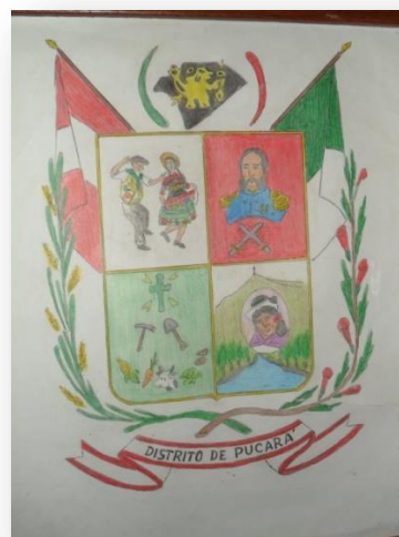
Foto 4. Escudo de Pucará

“Pucará se encuentra localizado al sudoeste del departamento de Junín, entre las coordenadas 12° , 10 ' y 35 '' de latitud sur y 75 °, 09 ' y 02 '' de longitud oeste del meridiano de Greenwich. Tiene una extensión de 110.49 km 2 , su altitud fluctúa entre los 3,360 y 4,800 m.s.n.m, y registra una temperatura media anual que oscila entre los 06 y 25 ° C”.