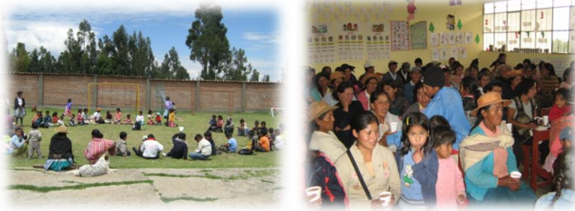
Fotos 32 y 33. Imágenes actividades de convocatoria comunidades de Talhuis, San Lorenzo y Raquina (febrero de 2010)

El segundo hito de la experiencia tiene que ver con la Consolidación orgánica de las AEIs: “ Aprendiendo jugando ” : Hacia este momento en el hito de la experiencia los niños y jóvenes de las nueve (9) comunidades ya se encuentran identificados con las reuniones que día a día se da en sus comunidades, el integrarse en contra jornada a los horarios escolares en las horas de la tarde, momento en que habitualmente los niños y jóvenes se encontraban realizando sus trabajos cotidianos, se constituye en un momento por así decirlo de variación en la dinámica diaria de las comunidades andinas, hacia ese momento sería muy frecuente que las mamás se encontraran trabajando en la chacra bajo la radiación intensa de las tardes andinas o bajo el hielo de la lluvia interminable que arrecia los cerros en las temporadas de invierno entre los meses octubre a marzo. En este contexto, se puede decir que las mamás y los hijos son los que permanecen en la comunidad, mientras los maridos y los hijos mayores han migrado a la selva a cosechar café o como recolectores de hoja de coca en la región amazónica, o se han ido hacia las zonas mineras, esto obliga a que las familias se desintegren para buscar recursos, ya que los rebaños ni los cultivos de hortalizas en las chacras son suficientes, para el sostenimiento de las familias porque las necesidades son muchas, la familia es grande y los recursos y condiciones son pocos.