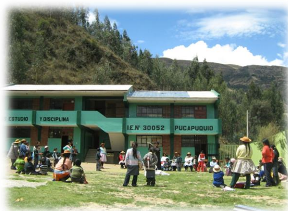
Foto 27. Imagen institución educativa de Pucapuquio 30052

“se tiene que la tasa de analfabetismo en el distrito de Pucará es el 10.8 % para los pobladores de 15 años a más. Este grave problema afecta esencialmente al sector femenino. También el porcentaje de instrucción primaria inconclusa, cuyo índice es de 67 %, refiere mayormente la situación de la mujer”.(Proyecto CAE-PRODEI. 2007:12)