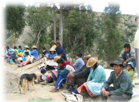
Fotos 13 y 14. Imágenes faena comunal comunidades de Raquina y Talhuis

Como se ha venido indicando, en el distrito de igual manera perviven y son legados prácticas tradicionales asociados a la espiritualidad y cosmovisión andina como es la reciprocidad a la madre tierra ( pacha mama ), la veneración a las deidades o dioses andinos como el cerro, el nevado, la laguna dentro de otros.