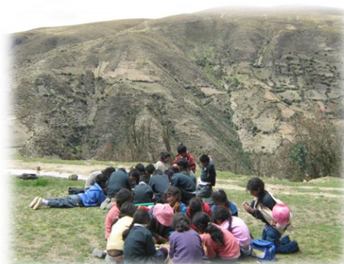
Fotos 37 y 38. Imágenes AEl en taller trabajo en equipo comunidad de Talhuis (mayo de 2009)