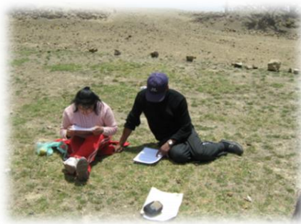
Fotos 67 y 68. Imágenes Docentes en talleres de capacitación (octubre de 2009-junio de 2009)

Como si la resistencia a los procesos educativos contextuales y próximos a las necesidades sentidas de las comunidades pasara inadvertidos a causa de las políticas educativas estatales, falta de capacitación docente aspectos incidentes en las instituciones educativas de las comunidades. Es de mencionar dentro del relato que durante el proceso de formación y consolidación de las AEIs algunos docentes de las comunidades principalmente las de altura y del centro poblado de Pucarà, se constituyeron en aliados del proceso quienes testimoniaron sobre los progresos formativos de sus estudiantes pertenecientes a las AEIs en las aulas de clase y en los escenarios comunitarios como lo relatan dos docentes del distrito: