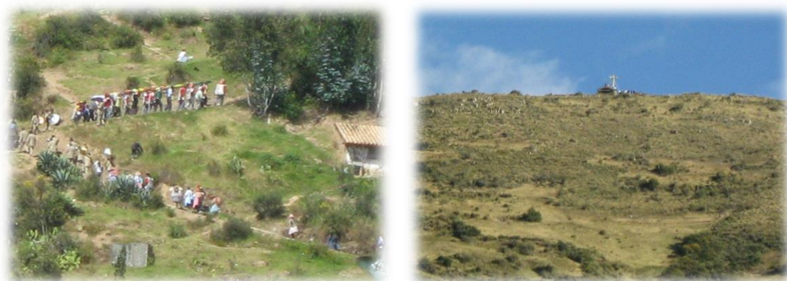
Fotos 21 y 22. Imágenes momento de subida de la cruz y cerro de San Cristóbal

coincide con la temporada de cosecha y abundancia, en donde no solo se hacen ofrendas para la fiesta sino también para la iglesia, en últimas se puede constituir en la celebración de la cosecha con la cruz; en otros aspectos no visibles dan testimonio del sincretismo de lo religioso y lo cultural, en otras palabras de los dilemas espirituales y tradicionales que se puede decir guardan en silencio los campesinos andinos o serranos. La celebración consiste en subir hasta los cerros la cruz (que meses antes ha sido bajado de los cerros) adornada con flores mientras se toma (cerveza y cañazo) y danzan camino a las cumbres.