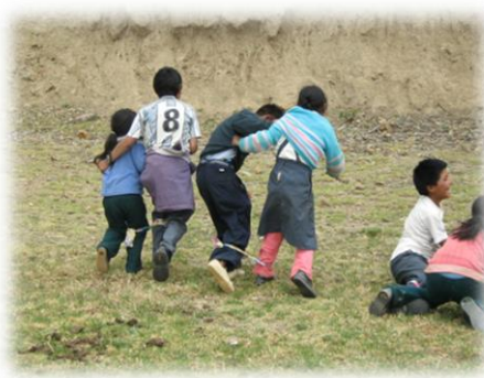
Fotos 47 y 48. Imágenes AEIs en taller de equidad de género Comunidades Talhuis y Pucapuquio (Julio de 2009)

El encuentro y recuento de la experiencia CAE hacia el mes de enero de 2012 con los actores niños y jóvenes de las AEIs, continua en un tercer encuentro el día 10 enero, a partir de la dinámica habitual de los talleres, en esta ocasión mediante el trabajo colectivo los niños y jóvenes dan respuesta a preguntas como ¿Por qué fue importante que los niños y jóvenes de Pucará se