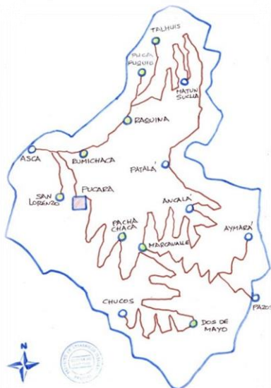
Mapa 2. Mapa de Político Distrito de Pucará, ( PRODEI, 2008)

“Pucará colinda al norte con el distrito de Sapallanga, provincia de Huancayo, departamento de Junín; al sur con el distrito de Pazos, provincia de Tayacaja, departamento de Huancavelica; al oeste con los distritos de Cullhuas y Viques, provincia de Huancayo, departamento de Junín; al este con el distrito de San Marcos de Rocchac, provincia de Tayacaja, departamento de Huancavelica. ”.(Proyecto CAE-PRODEI, 2007:11)