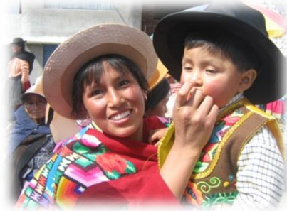
Foto 1. Mujer andina Distrito de Pucará (Registro Peña, M.T. junio de 2009)

Ashanika, Nomatsiguenga las cuales aún conservan sus manifestaciones tradicionales ancestrales.