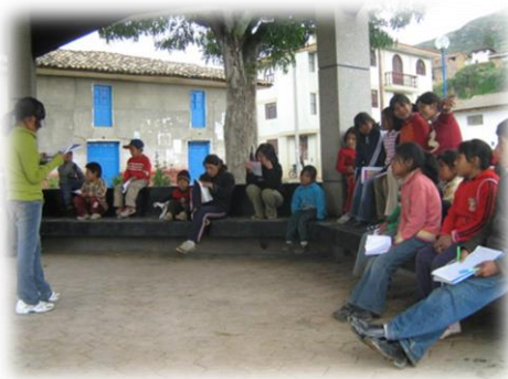
Fotos 45 y 46. Imágenes AEIs en taller de lecto-escritura Comunidad de Talhuis y San Lorenzo (Junio de 2009)

En el hito de la experiencia en la conformación orgánica de las AEIs a mediados de 2009, se explora a partir del proceso mismo del camino educativo, otras formas de entender la pedagogía y la didáctica situada en el contexto y reconfigurada en y desde el proceso mismo, en la comprensión del sentido “ no hay pedagogía sin contexto ni contexto sin pedagogía ” en donde la motivación de la enseñanza y aprendizaje situada y diferencial, despliega reflexiones sentidas y subjetivas en torno al significado real de la dinámica socio-educativa connatural al mundo particular de los niños y jóvenes andinos.