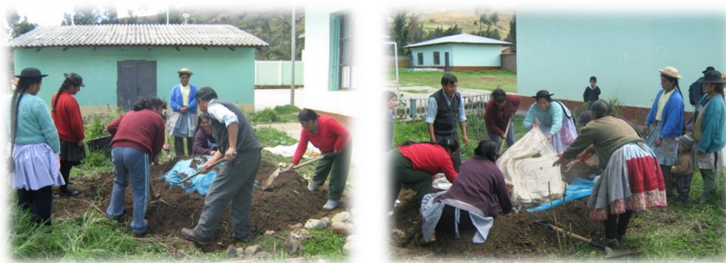
Fotos 7 y 8. Imágenes forma tradicional de preparación de la pachamanca “olla de tierra”

“..inicia con abrir una fosa y se le ponen unas piedras especiales o piedras de río que se les hecha agua con sal para que no se revienten cuando se calientan, se arma una especie de fuente con hierros para que se levanten las piedras, luego se le mete leña y se prende fuego para que las piedras se calienten por dos o tres horas hasta que queden bien calientes, pasado este tiempo se colocan entre las piedras las papás y la carnes que puede ser de cuye (cuy), conejo, carnero, chancho, vaca, gallina; y luego se hecha una otra capa de piedra caliente encima... se colocan encima las habas y finalmente las humitas (envueltos o tamales de maíz), y se pone otra capa de piedra para tapar, después se tapa con una hierba que se llama malva que es una planta con buen fragancia, también se puede cubrir con alfalfa, trébol, pastos, las ramas de las plantas se pueden cubrir con una manta o un plástico y finalmente encima se cubre con tierra bien tapizada para que no salga el vapor... cuando las piedras están bien calientes se puede demorar una hora para que la pachamanca esté lista para ser destapada(...)”