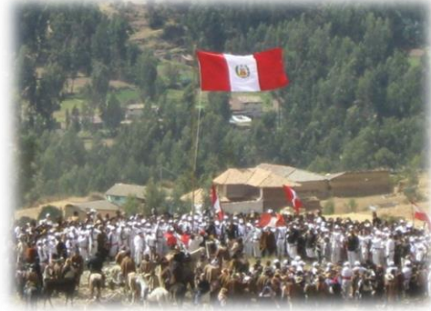
Fotos 25 y 26. Imágenes escenificación de la batalla y victoria del ejército peruano

Este acontecimiento en el distrito se conmemora el nueve (9) de julio en donde se escenifica cada año la representación de la batalla en el valle ( chuuclo ) en el cual se efectuó la batalla con actores locales campesinos, a este evento asisten de todas las regiones de los Andes y del Perú.