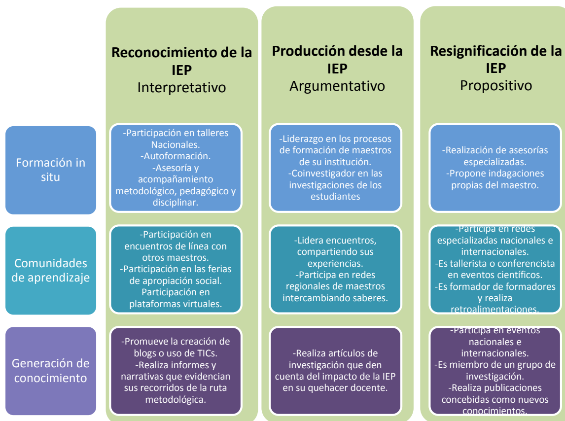
Ilustración 3. Ámbitos de apropiación de la IEP en los maestros

tiempo y el ejercicio logran moverse en lugares distintos.