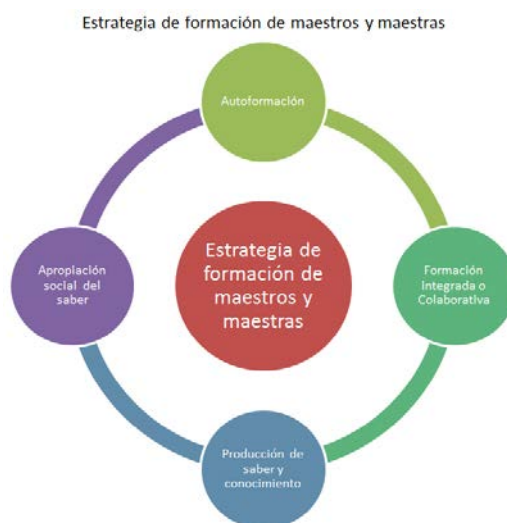
Gráfico 1. Espacios de Formación.

Se propone recuperar y visibilizar el saber de los maestros para que estos actores se transformen de portadores de prácticas y de saberes diseñados por otros, a una nueva condición de productores de saber; el camino por el cual los sujetos de la acción se empoderan logrando no sólo saber sobre su práctica, sino entrando con un saber en las comunidades de acción y pensamiento para disputar la manera como éste se produce y se difunde. Para ello, se propone fortalecer los procesos de formación de maestros, en relación consigo mismo, con los otros y