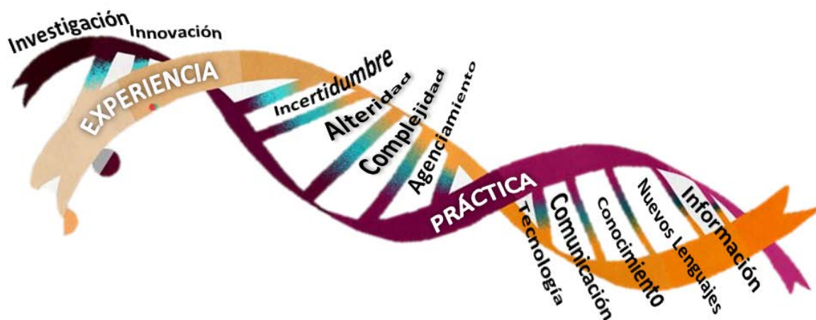
Ilustración 1. Aspectos que reconfiguran la práctica y la experiencia del maestro

pedagógica y la configuración de sus agencias mediante la producción de narrativas en clave de saber pedagógico. La siguiente ilustración muestra como estos escenarios y lugares se articulan en la investigación que realiza el maestro: