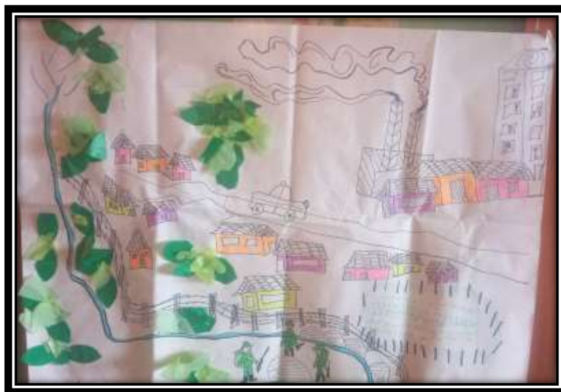
Ilustración 6: Cartografía del futuro "no deseado" reserva Zanja Honda.

La toma de conciencia es evidente en los estudiantes, quienes muestran gran preocupación sino se emplean estrategias de trabajo para cuidar y conservar las fuentes hídricas que son afluentes de la quebrada Zanja Honda que a su vez sirve de fuente de agua potable para el resguardo y municipio. “Yo creo que en el futuro ahí no van a haber musgos y remedios que usaban los mayores para curar enfermedades... solo quedarán las piedras grandes sin musgo... también los pescaditos y guasarapos se irán perdiendo” (Estudiante 5).