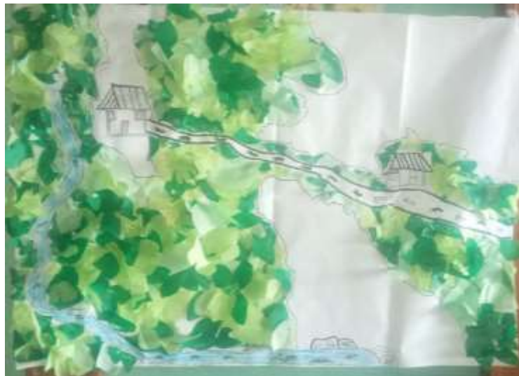
Ilustración 3. Méndez, L (2023)

Cartografía del presente (como se encuentra hoy la zona de reserva Zanja honda)