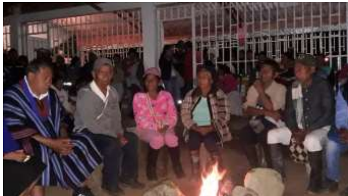
Ilustración 8. Méndez, L. (2023)

Actividad: Aplicación de entrevista semiestructurada a adultos mayores, sobre la importancia de los sitios sagrados presentes en el territorio, zona de reserva Zanja Honda.