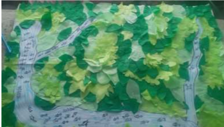
Ilustración 2. Méndez, L (2023)

Cartografía del pasado (como se encontraba antes la zona de reserva zanja Honda)