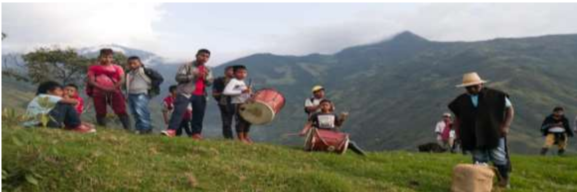
Ilustración 11. Méndez, L. (2023)

Actividad: Reconocimiento de la flora y fauna de la zona de reserva Zanja Honda.