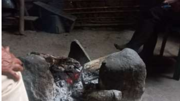
Ilustración 9. Méndez, L. (2023).

Actividad: Aplicación de entrevista semiestructurada a la familia Méndez Sécue, sobre las experiencias en cuanto al conservación, preservación y cuidado de los espacios de vida del territorio.