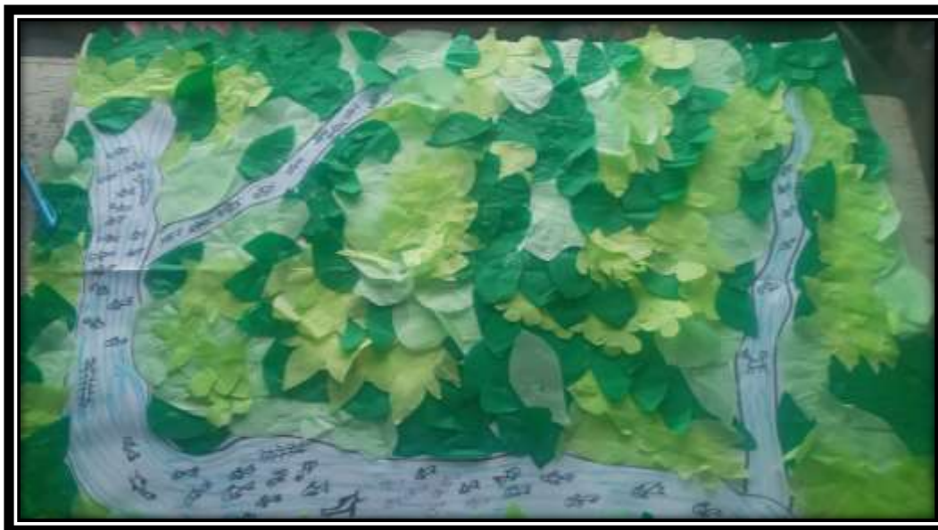
Ilustración 3: Cartografía del Pasado realizado por estudiantes de grado noveno I.E. Sestadero

Los estudiantes hacen un acercamiento teniendo en cuenta las experiencias de los abuelos y mayores del resguardo para su posterior elaboración del mapa. Según esto, anteriormente la reserva Zanja Honda albergaba gran diversidad de flora y fauna, en palabras de la comunidad Nasa se dice que aquel sitio sagrado permitía el desarrollo de rituales de armonización, la adquisición de remedios y plantas medicinales. “(...) se podía conseguir los remedios que pedían los médicos tradicionales, porque el lugar tenía muchas plantas que la madre tierra regalaba a la gente” (Entrevista realizada a Mayor 1).