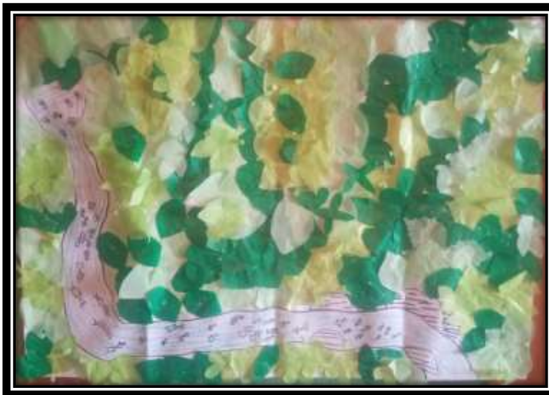
Ilustración 5: Cartografía del futuro.

En ese sentido es como se proyectan los estudiantes y se ve reflejado en la cartografía del futuro; un espacio donde los estudiantes y comunidades puedan ser partícipes en la recuperación del sitio sagrado, sueños como: “(...) después de que se logre recuperar esos potreros y pasen a ser monte o bosque... ahí los estudiantes podemos ir a aprender los temas que nos dan en las clases... así como decía la profe Felisa que ese lugar puede ser como un aula de clases... aprender de los reinos de la naturaleza y cómo funcionan los ecosistemas” (Estudiante 3).