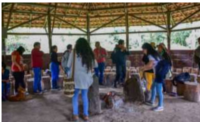
Ilustración 13. Méndez, L. (2023)

La socialización de la propuesta de restauración ecológica intercultural fue realizada el día viernes 5 de abril de 2023 después del mediodía por medio de un círculo de palabra, se tuvo el acompañamiento de los docentes, los estudiantes de grado 9 y padres de familia. Después de terminada la socialización por parte del investigador del trabajo, se procede a escuchar las opiniones de los participantes del círculo de palabra para lograr recoger contribuciones y mejoras a la propuesta.