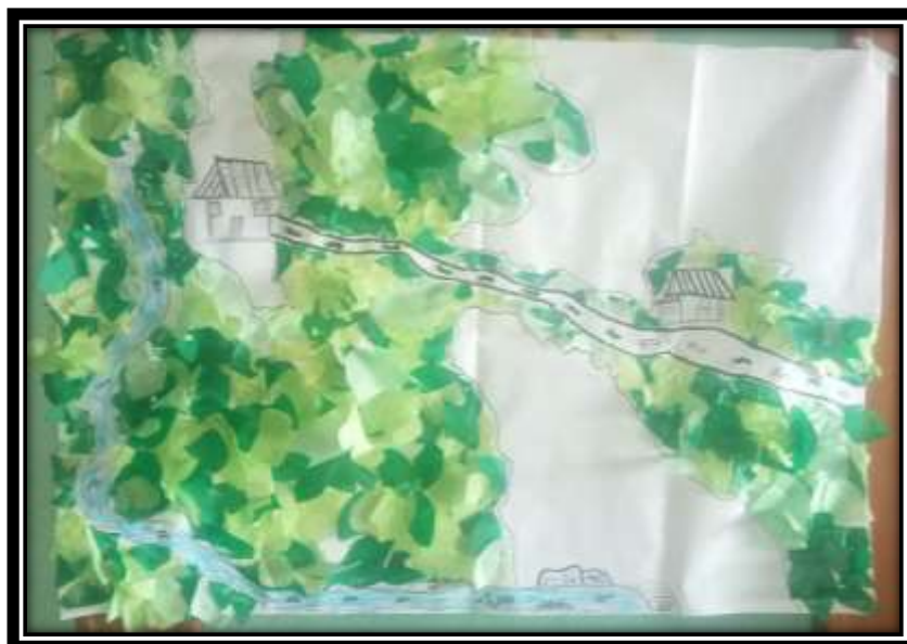
Ilustración 4: Cartografía del presente.

“aquí está representado donde se puede ver más árboles, solo se ve que hay en la parte alta de la reserva y cerca de la quebrada, en esos lugares es donde queda un poquito de monte, el agua ya no es como antes, la quebrada no tiene tantos peces” (Estudiante 4) “(...) se han cortado árboles, el potrero es más grande, yo creo que ahí el daño a la madre tierra es más fuerte” (Estudiante 1). Los espacios del territorio fueron cambiando, pero no por acción del pueblo Nasa en su momento, este se atribuye al proceso de aculturación proveniente de otros espacios geográficos; seducidos por dinámicas del modelo capitalista, donde el principal objetivo fue la explotación de la tierra para generar riqueza para un solo dueño.