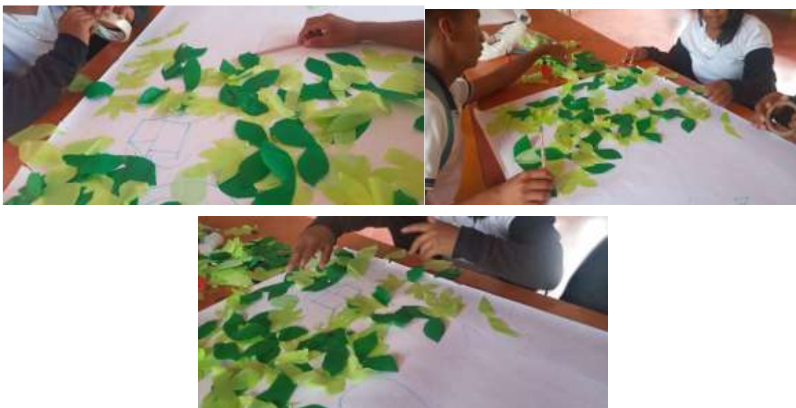
Ilustraciones 1. Momentos de elaboración Cartografía reserva Zanja Honda

Inicialmente se tenía planteado la elaboración de tres cartografías: presente, pasado y futuro. Por iniciativa de los estudiantes se determina hacer una cuarta cartografía también relacionada con la del futuro, donde se describen los posibles cambios negativos que puede llegar a tener la zona de reserva Zanja Honda si la comunidad no fomenta acciones para el cuidado, defensa, conservación y preservación de aquel sitio sagrado.