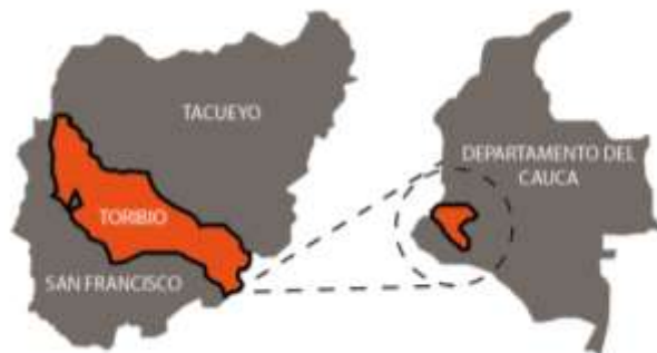
Ilustración 2: Municipio de Toribío - Resguardos y Departamento del Cauca.