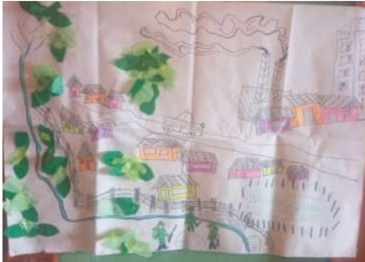
Ilustración 12. Méndez, L (2023)

Cartografía del futuro no deseado (referido al no cuidado y conservación de la zona de reserva Zanja Honda)