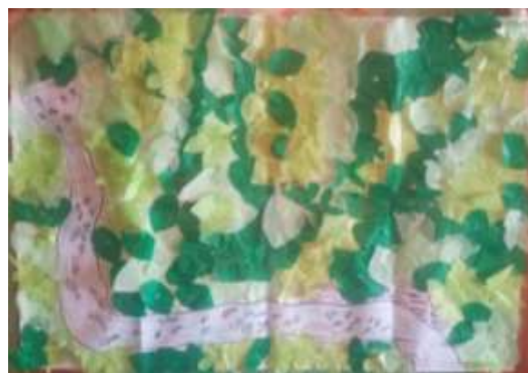
Ilustración 4. Méndez, L (2023)

Cartografía del futuro deseado (proyecciones para la zona de reserva Zanja Honda)