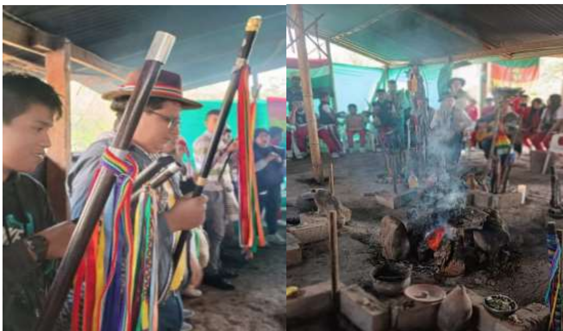
Ilustración 7. Méndez, L. (2023)

La pregunta resultó ser muy interesante para tres participantes, por lo que de inmediato decidieron levantar la palabra, se prosigue a enumerarlos y de ese modo se llevó un adecuado orden de la actividad.