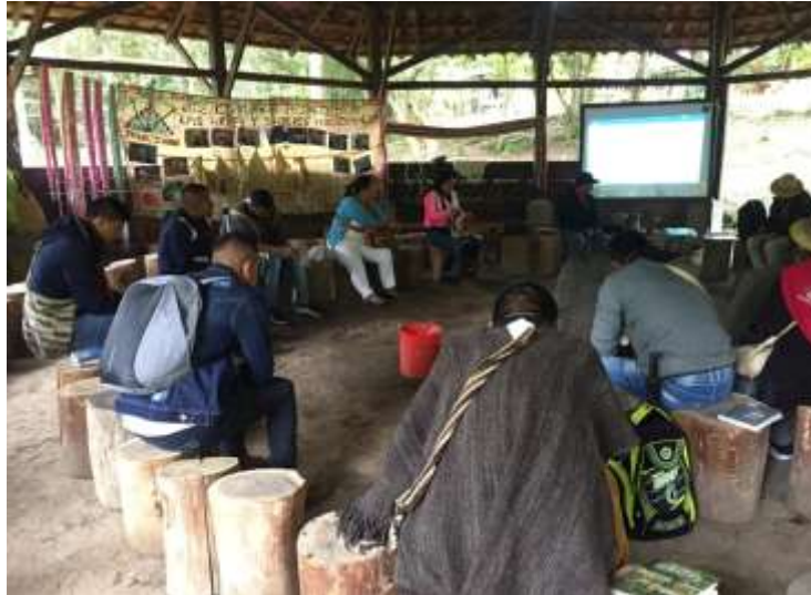
Ilustración 10 Méndez, L. (2023)

Actividad: Aplicación de entrevista semiestructurada a docentes del plantel educativo, sobre la proyección de la zona de reserva natural Zanja Honda desde la comunidad educativa.