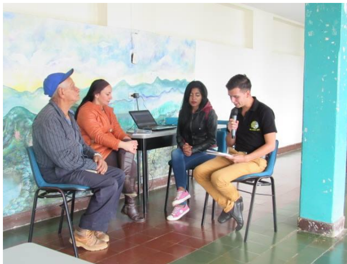
Fotografía 4. Ejecución de entrevistas