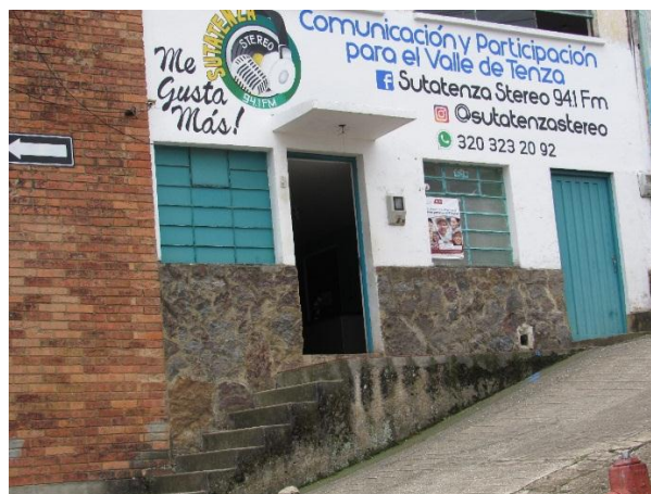
Fotografía 1. Instalaciones emisora Sutatenza Stereo