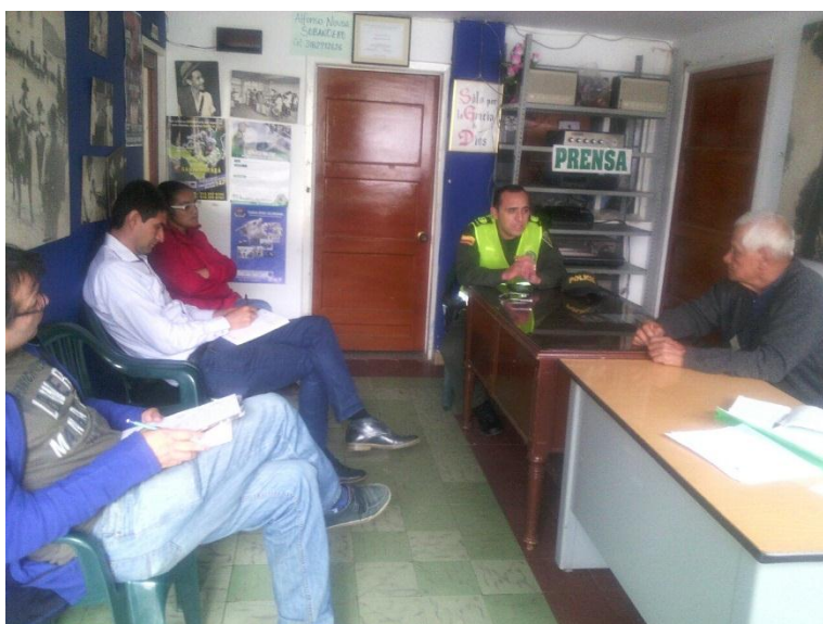
Fotografía 2. Conformación comité local