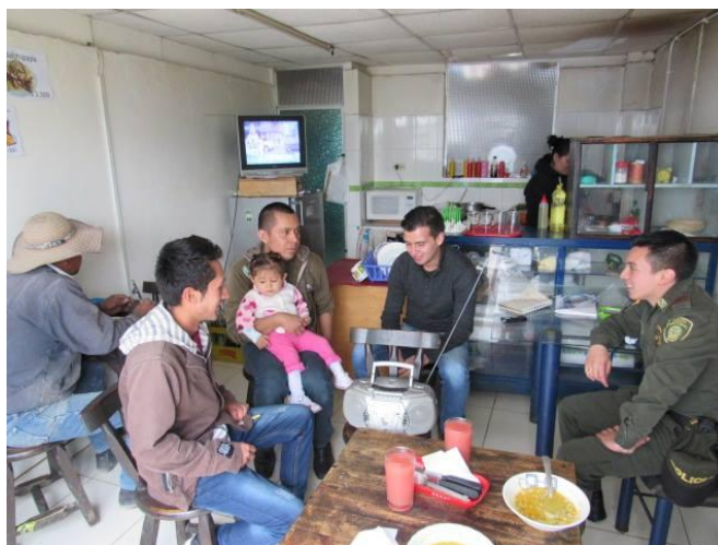
Fotografía 3. Emisión de los programas en compañía de la comunidad

Se escuchaban comentarios como “son programas muy buenos que muestran la realidad que muchos de nosotros no queremos ver” o “Yo conozco casos en mi vereda dónde el marido llega borracho y le da muendas a la mujer” y “hoy en día en esos colegios los pelados solo van a fumar marihuana y a insultar a los profesores” Esta es una pequeña muestra que realmente hay falencias dentro de nuestra sociedad, falencias con un trasfondo enorme que necesitan de atención por parte de las entidades encargadas.