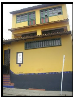
Imagen N° 3 Casa de la Cultura Suba Centro

Entonces para el año de 1997, teniendo presente que la Alcaldía Local de Suba había comprado un predio y que existían ya acciones artísticas y culturales moviéndose aceleradamente a nivel local, junto a la participación del “difunto Instituto de Cultura y Turismo” como lo llama Fernando, se da origen a la Casa de la Cultura de Suba centro como la casa matriz, pero no como la única pues en ese momento se consolidaron 5 casas: La Casa de la Cultura de Rincón Occidente, La Casa de la Cultura de Ciudad Hunza, La Organización La Cometa, que en un momento histórico dijo: “queremos seguir siendo una organización cultural popular urbana” (Fernando). Y por último, La Casa de la Cultura de la Gaitana que finalmente desapareció. En la actualidad de esas 5 casas, solamente 3 se encuentran dinamizando el proceso cultural en la localidad.