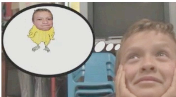
Imágen N° 12 Argumental Chocó Encuentra una mamá

SINOPSIS: Es un ejercicio Argumental en el cual por medio del lenguaje audiovisual dan vida a un cuento como choco encuentra una mamá, divertida historia que permite viajar por el mundo de la literatura y la animación.