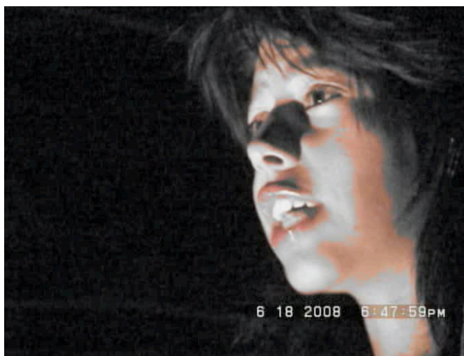
Imágen N° 9 Documental Suba en el Metal

SINOPSIS: Ejercicio Documental que evidencia como lo jóvenes de la localidad, comienzan a ser parte de las tribus urbanas, y como se comienzan apropiarse de diversos lenguajes y sentidos. Particularmente se habla sobre la cultura metal, recorriendo bares, calles y momentos espaciales a nivel local