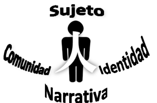
Figura N° 1 esquema diseñado por las investigadores

Desde esta categoría se dará un espacio para comprender una de las tantas miradas sobre el concepto de comunidad y las múltiples funciones que de ella se despliegan, puesto que este concepto abarca nociones de lo comunitario, lo identitario, la narrativa y la transformación de sujeto.