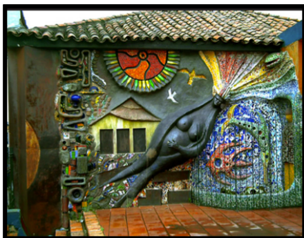
Imagen N° 5 Escultura madre tierra/2009 Colegio Distrital Simón Bolívar Plaza Fundacional Suba