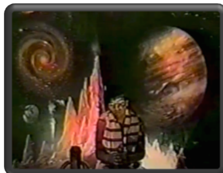
Imágenes N° 1 y 2 Documental el progreso sobre los hijos del

La llegada de nuevos pobladores y la división de los terrenos sagrados trae consigo cambios fuertes, cambios como el hecho de convertirse en municipio y posteriormente, en el año 1956 se convierte en localidad anexa al distrito capital, dejando de lado todo su legado cultural e indígena. Lo que entonces se llamaba pueblo comenzó a adaptarse a la gran ciudad, a un cambio en la expansión y demanda de las tierras para el uso de los cultivos de flores, ocasionando que la llamada localidad 11 comenzara a crecer desde la informalidad, generando nuevas agrupaciones de personas en búsqueda de una reivindicación de sus derechos, principalmente desde el uso de los servicios públicos “los barrios no tenían agua, el agua llegaba a través de pilas comunitarias y la gente colocaba mangueritas hacia las casas, no llegaba el agua directamente a las casas, sino que llegaba a puntos, esquinas y de ahí la gente cogía su agua, no había servicio de alcantarillado sino el agua pasaba por un vallado, eran como huecos, pasaban las aguas negras por los frentes de las casas hasta llegar al río Juan Amarillo” (Fernando 2 Comunicación Personal Oct 18 de 2012)