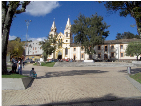
Imagen N° 7 Plaza Fundacional de Suba