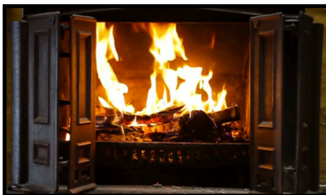
Imagen N° 4 Chimenea Casa de la Cultura de Suba

consolidación de su proyecto de vida, puesto que en ese momento se encontraba estudiando diseño gráfico y cultivando su gusto por el cine. Comenzó entonces a ir una vez a la semana al taller y en una construcción colectiva junto con todas las personas que asistían se configuró la definición de lo que es un Cine Club, siendo ésta una acción bastante significativa que motivó el ejercicio que pronto nacería y se arraigaría fuertemente en la Casa de la Cultura. Se organizó un equipo que semanalmente se encontraba para definir las funciones que cada uno tendría, buscando manejar una atmósfera llamativa e interesante para el espectador, realizando de esta manera el lanzamiento del que ahora se reconoce como CINE CLUB LA CHIMENEA, la cual para este momento no era un proyecto al azar sino que cumplía con unas necesidades del Sistema Local de Cultura y a su vez respondía a las gestiones de un grupo de artistas y acciones culturales que venían dando la pelea desde hace mucho tiempo por tener un espacio de encuentro, arte y cultura.