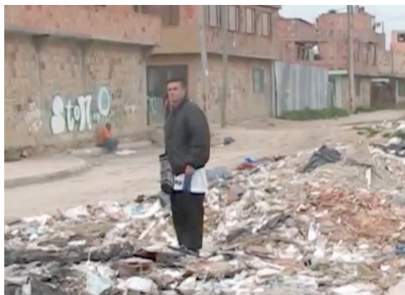
Imágen N° 11 Documental Todo tiene su comienzo

“ejercicio documental, basado en una historia real de uno de los participantes del taller”