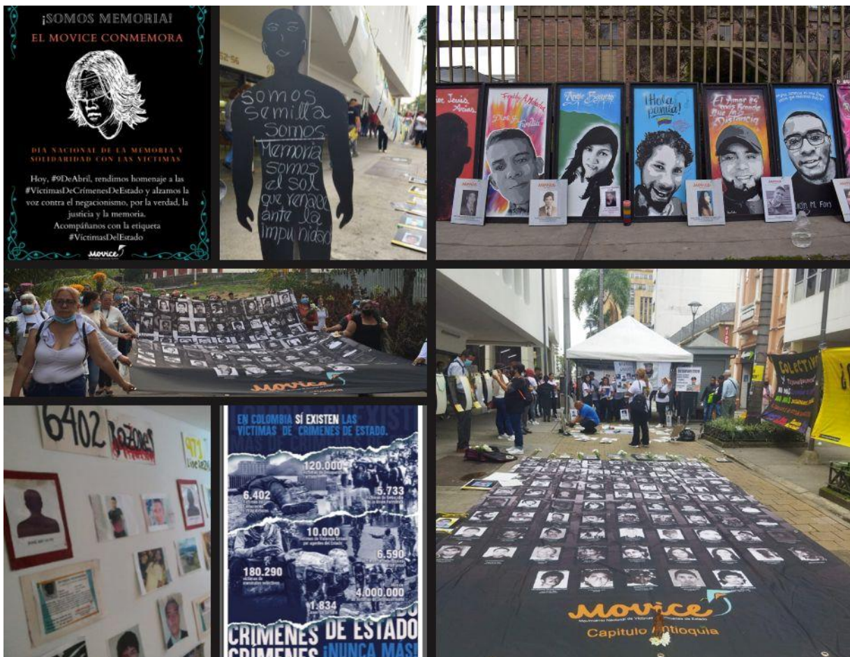
Ilustración 3. Propuestas de intervención del espacio público por parte de MOVICE.

Nota. Fotos tomadas del Instagram oficial del MOVICE, Collage realizado por mi autoría (2022). Día 8 de abril, en la ciudad de #Ibagué , se inaugura como Movice Capítulo #Tolima la exposición de Galería de la memoria en la Casa Dulima, que recoge la línea del tiempo de las luchas campesinas en el territorio, la lucha desde las cárceles, las víctimas del Paro Nacional y la Historia del MOVICE. Así mismo, proyecta y se conversa sobre el proceso de muralismo y memoria a través del Documental Lugares de Memoria, que recoge la trayectoria de procesos de muralismo desde las víctimas de crímenes de Estado. Día Nacional de la Memoria y Solidaridad con las Víctimas, el Movice capítulo *#Antioquia* lleva a cabo la acción “Las Víctimas se Toman Junín”. Día 26 de octubre, víctimas de varios municipios del Magdalena Medio participaron en una audiencia citada por la JEP para hacer seguimiento a las Medidas Cautelares en Puerto Berrío, Antioquía. La jornada finalizó con una caminata con antorchas y galerías de la memoria hacia el cementerio de este territorio, donde fueron adoptados, nombrados y enterrados los cuerpos que llegaron a este puerto después de ser desaparecidos en el río.