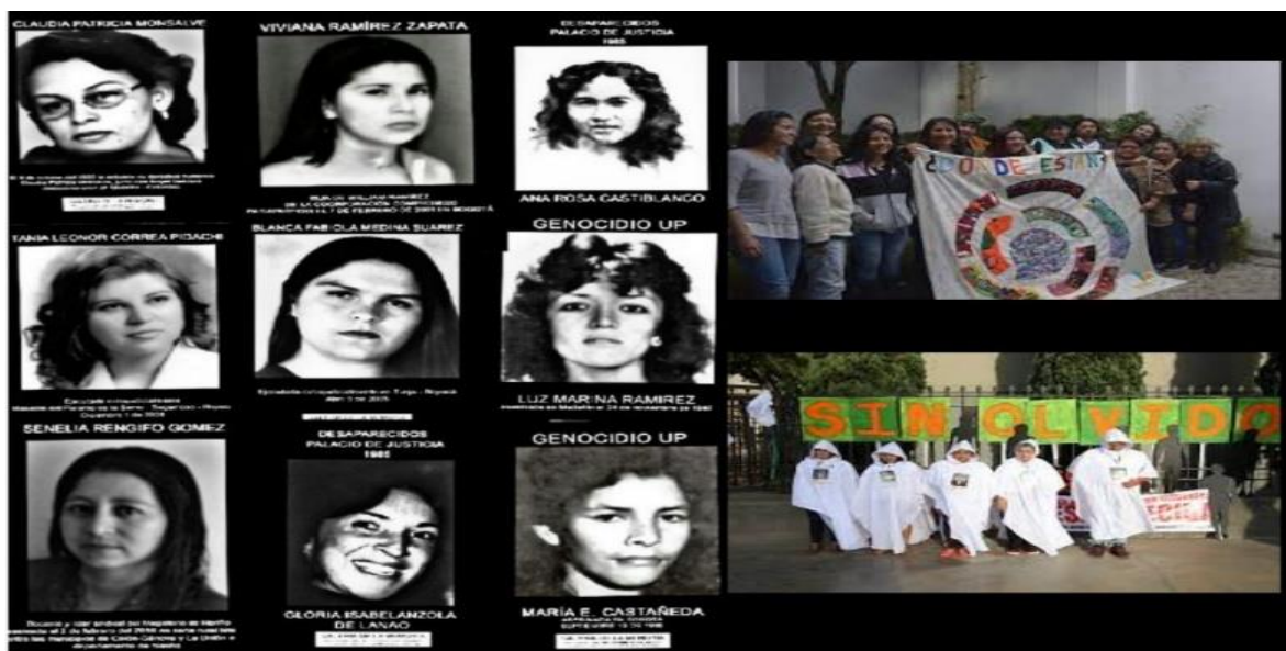
Ilustración 11. Performance en torno a las mujeres víctimas del conflicto. Sin Olvido.

Nota. Fotos tomadas de la página oficial del MOVICE Galería de la memoria, genocidio contra mujeres líderes y militantes. Plantón en contra del olvido, memoria viva.