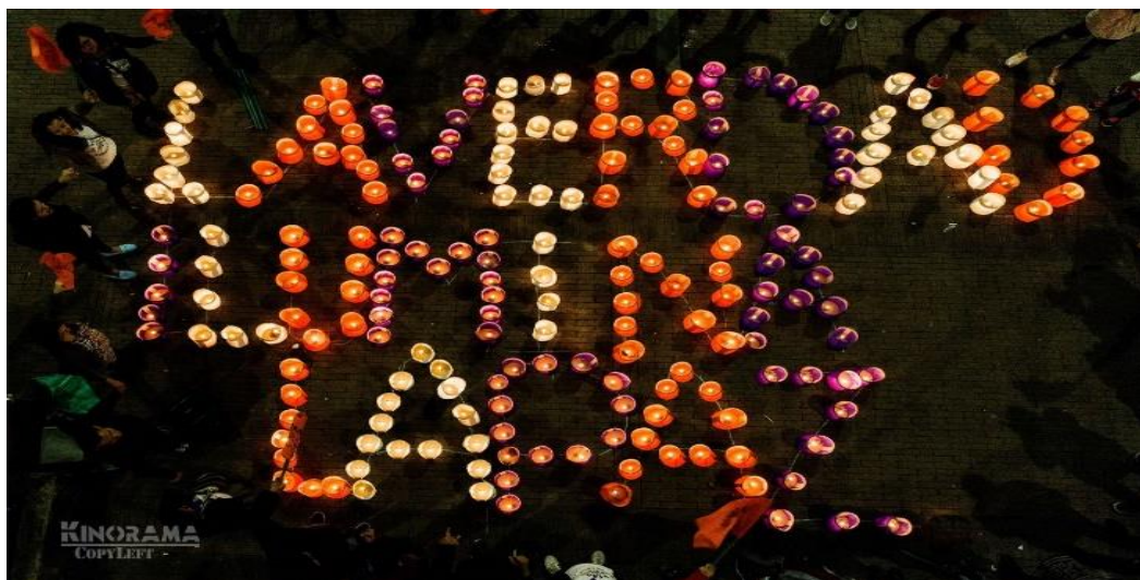
Ilustración 8. Intervención del espacio público “La verdad ilumina la paz”

Nota. Imagen tomada de la página oficial del MOVICE (2021), Familiares de Víctimas de Ejecuciones Extrajudiciales participan de encuentros por la verdad y piden esclarecer #QuiénDiosLaOrden