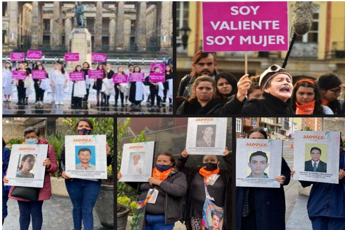
Ilustración 10. Performance Soy Valiente, soy mujer

Nota. Fotos tomadas del Instagram oficial del MOVICE, Collage realizado por mi autoría (2022). 8 de marzo Día Internacional de la Mujer Trabajadora, se conmemora a las mujeres que trabajan todos los días, desde hace décadas, por encontrar a las más de 120.000 personas desaparecidas en Colombia.