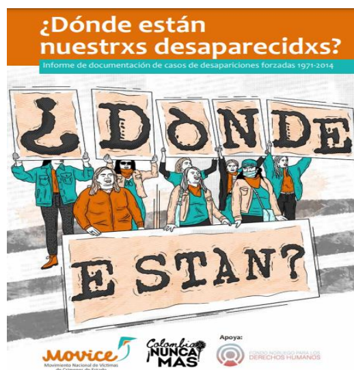
Ilustración 2. ¿Dónde están nuestras desaparecidxs?

Nota. Imagen tomada de la página oficial del MOVICE (2021), Informe de documentación de casos de desapariciones forzadas 1971-2014