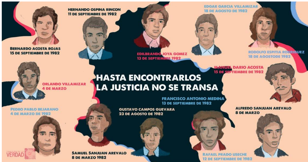
Ilustración 1. Hasta encontrarlos la Justicia no se transa.