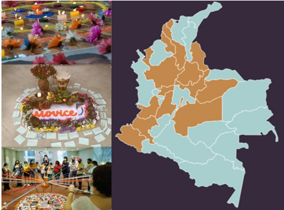
Ilustración 12. Actividades y mapa de incidencia de MOVICE.

Nota. Fotos tomadas del Instagram oficial del MOVICE, Collage realizado por mi autoría (2022). Escuela de formación realizada en Ibagué, Tolima.