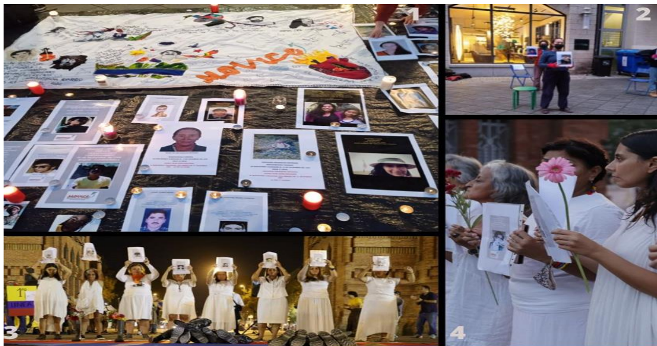
Ilustración 7. Actos performativos dentro del espacio público

Nota. Fotos tomadas del Instagram oficial del MOVICE, Collage realizado por mi autoría (2022). 30 de agosto en Barcelona se conmemoró el día internacional de las víctimas de desaparición forzada. La jornada fue convocada por el Movice y organizaciones internacionales para exigir la búsqueda de los desaparecidos en Colombia a través de actos simbólicos y el performance de los 6.402. Acto simbólico realizado en Berlín (Alemania) el pasado 10 de diciembre de 2021, Día Internacional de los Derechos Humanos, donde se expuso la galería de la memoria para la no repetición.