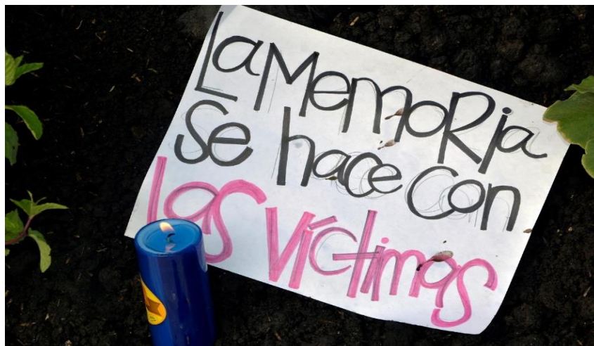
Ilustración 9 Cartel “La memoria se hace con las víctimas”

Nota. Imagen tomada de la página oficial del MOVICE (2018), La memoria se construye con las víctimas.