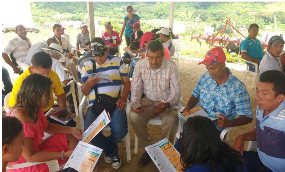
Ilustración 13. Talleres de formación y organización realizados por el MOVICE

Nota. Imagen tomada de la página oficial del MOVICE (2018), Estrategia de Escuelas de la Memoria para la No Repetición.