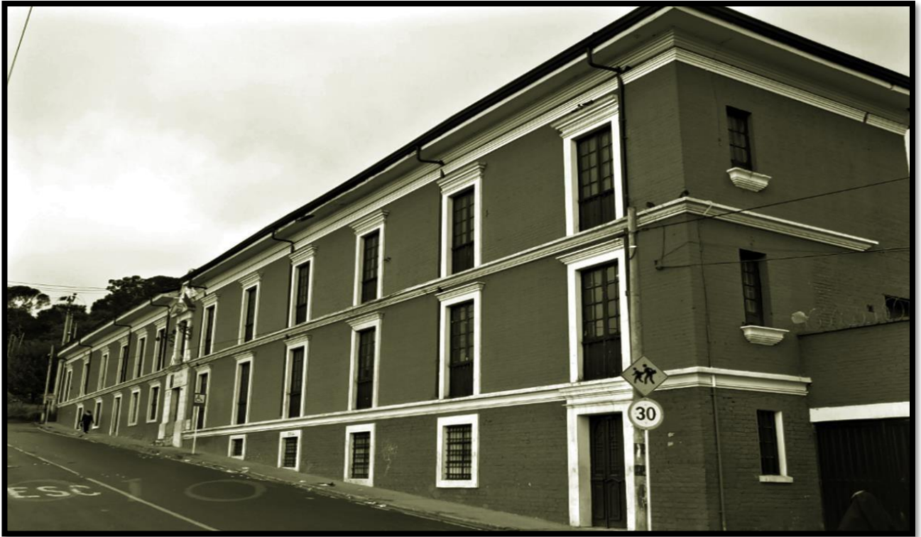
Ilustración 3 Edificio Instituto de Ciegos Fotografía: John J Ruiz/ 2005