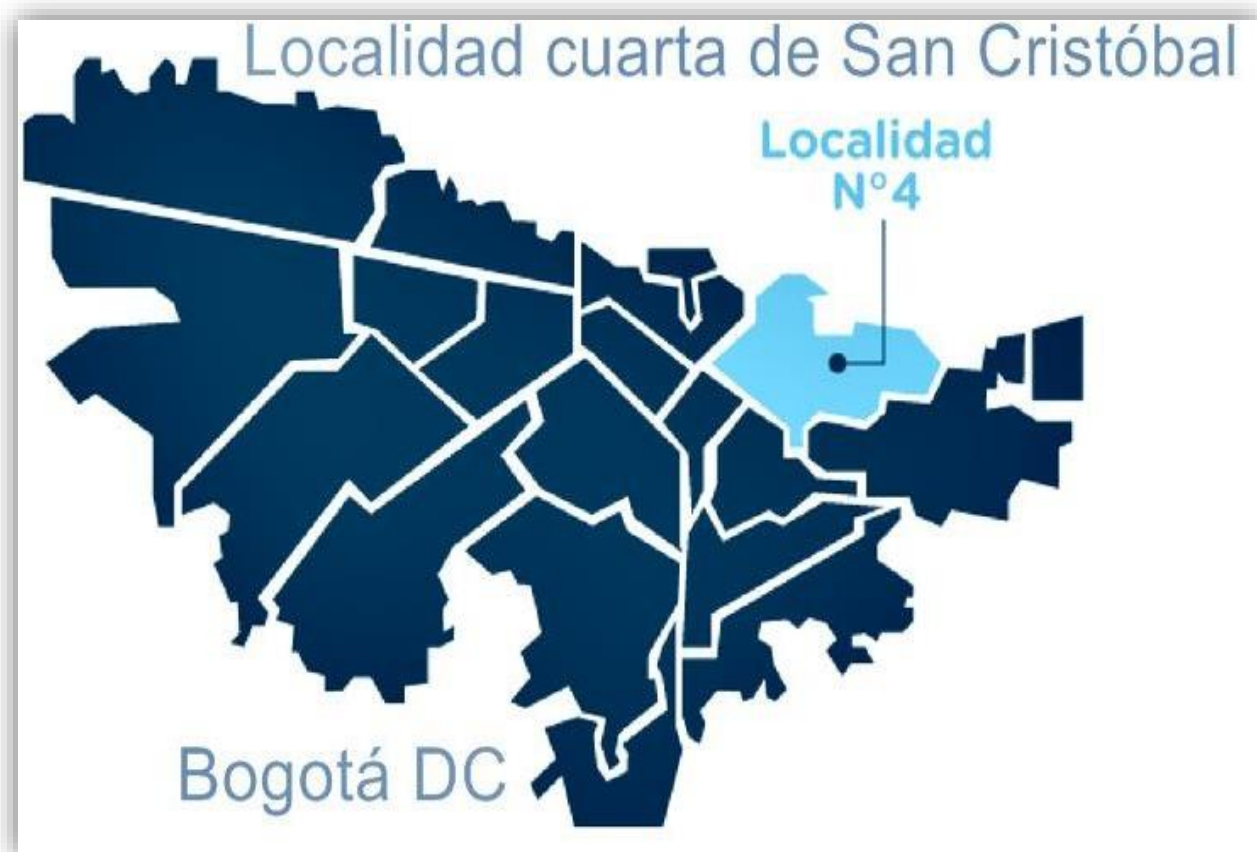
Ilustración / Mapa de la Localidad 4 de San Cristóbal

La Localidad cuarta de San Cristóbal se encuentra ubicada en el sur oriente bogotano una localidad con el aire más puro según la mediciones de 2019, con una población aproximada de 404 3500 habitantes, con un patrimonio materia e inmaterial soportado por las construcciones que aún perduran, con un epicentro de crecimiento en las riveras del Rio Fucha y sus vastos territorios conformados por la hacienda la milagrosa de donde provienen caseríos como San Cristóbal, las Mercedes entre otras que consolidaban un asentamiento proveniente del chircal, fábricas de ladrillo y tubos de gress, en 1911 se funda villa Javier el primer conjunto cerrado de Bogotá, donde se origina el circulo de obreros de Bogotá, nacimiento del hoy banco caja social, en su territorio todavía prevalece erguido en el tiempo una edificación que se encuentra catalogado como patrimonio material inmueble local por su contexto histórico arquitectónico hacedor de historias como muchas que se tejen en la localidad