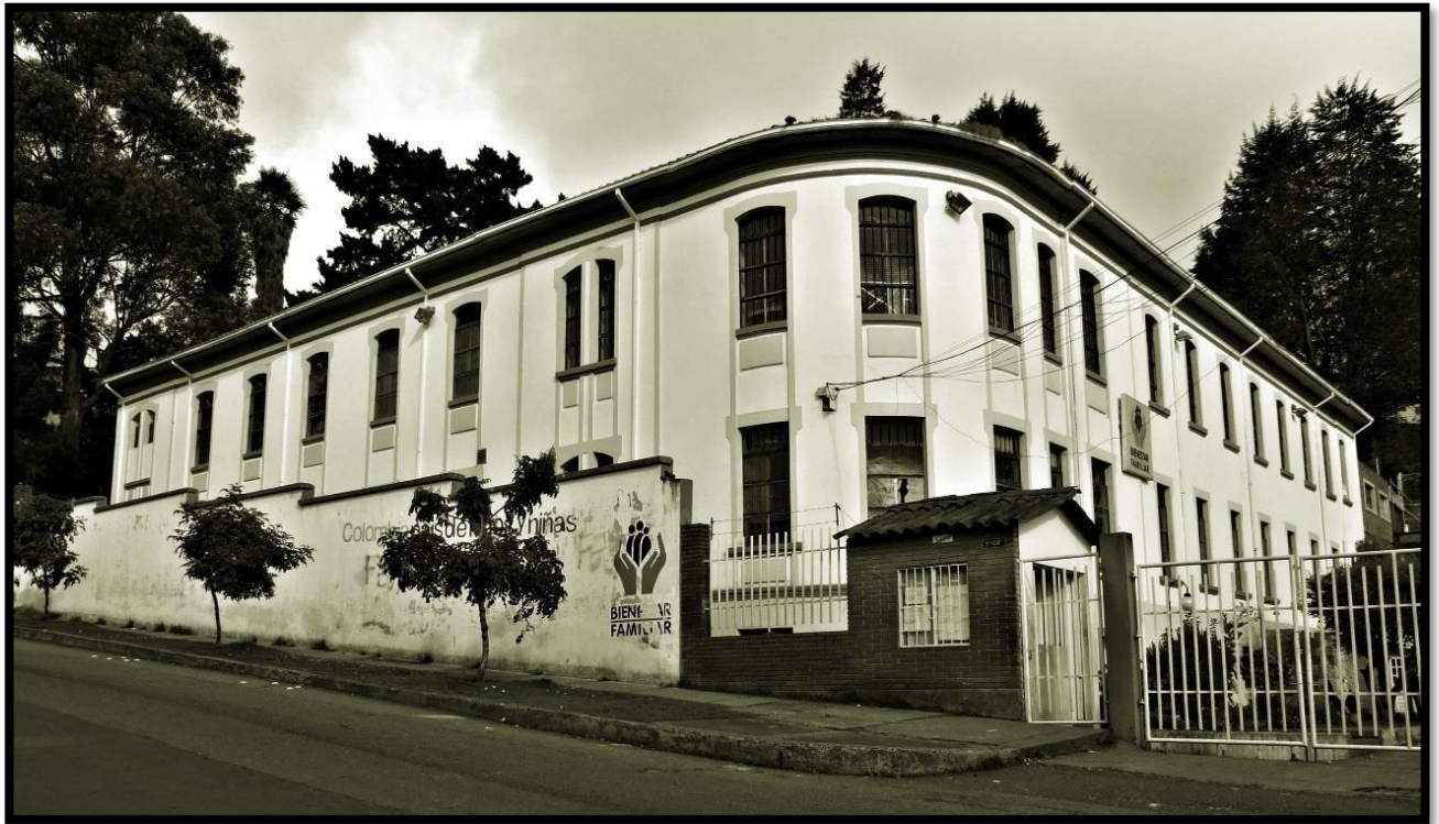
Ilustración 2 Edificio Instituto de Bienestar Familiar ICBF / "Asilo de las Locas" Fotografía John J Ruiz 2010

el “asilo de las locas” llamado así por los habitantes de la época que hoy es el centro del Instituto Colombiano de Bienestar Familiar ICBF, antes que su traslado fuese al municipio de Sibate, las primeras y las últimas construcciones del memorable arquitecto Rogelio Salmons, el conjunto María Marulanda, la urbanización La Coruña su nombre por se da por ser la ciudad de España donde nació el padre Campo Amor fundador del barrio Villa Javier, el jardín San Jerónimo de Juste en el territorio del barrio aguas claras, La Eneida, villa Ana Julia un “palacio” enclavado en la calle 11 con 6 construido en gres por el fundador de la fábrica de tubos vencedor, donde por muchos años los lugareños observaron pasar el tranvía que subía a San Cristóbal y su último viaje que fue la ruta al barrio 20 de julio después del año 48