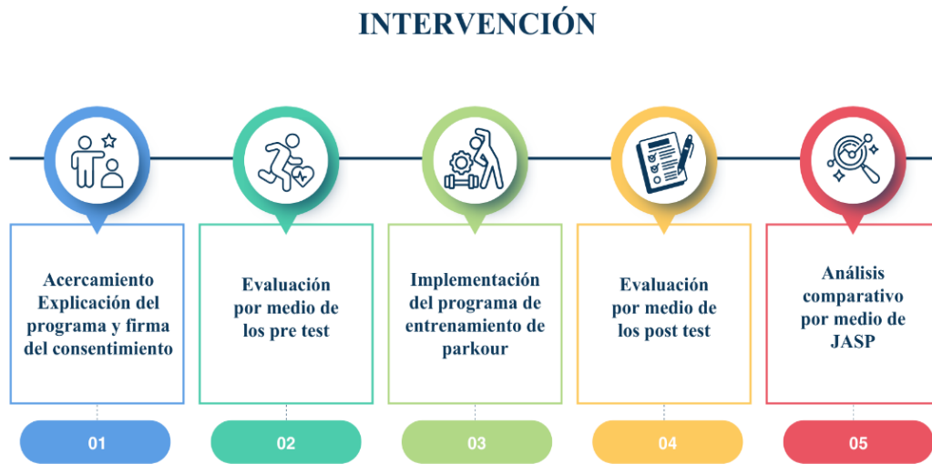
Figura 2 Cronograma general fases de la intervención