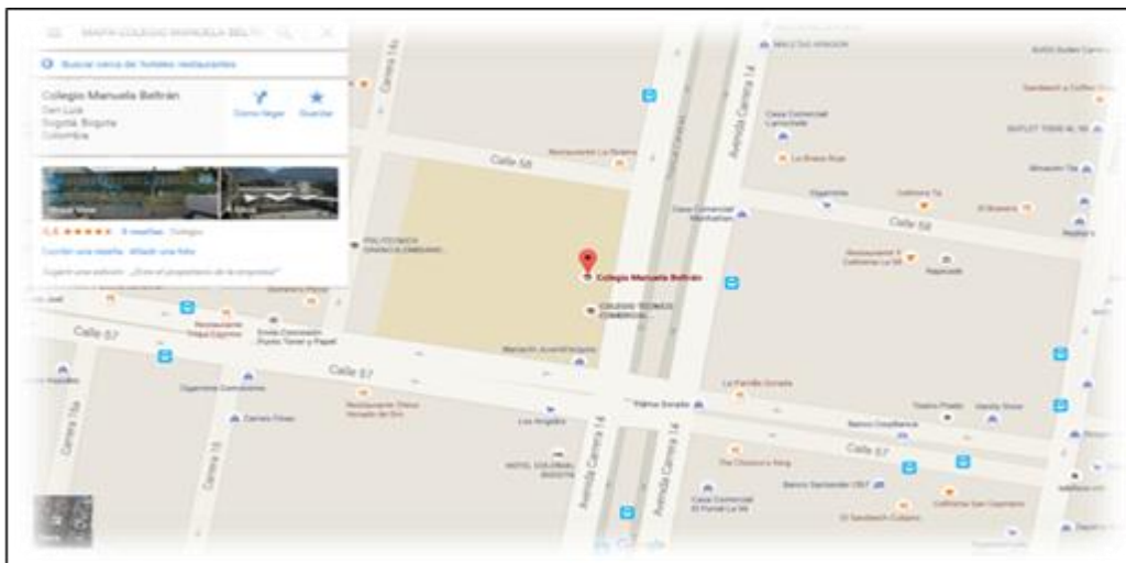
Figura 1 Ubicación Colegio Manuela Beltrán, adaptada de: https://www.google.com/maps/place/Colegio+Manuela

convenio con el SENA y otras instituciones.” (Manual de Convivencia, Colegio Técnico Comercial Manuela Beltrán 2015-2016 pág. 22)