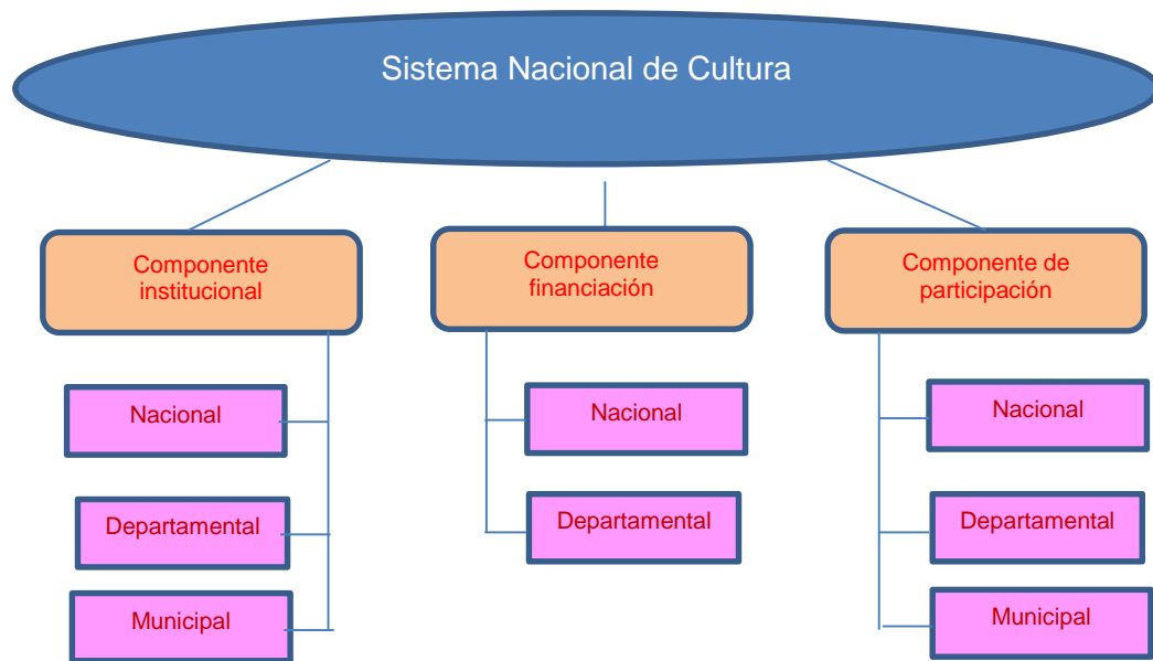
Diagrama 1: Organización del Sistema Nacional de Cultura.

prácticas culturales garantizando y promoviendo la creatividad de los colombianos. (Acevedo, 1997).