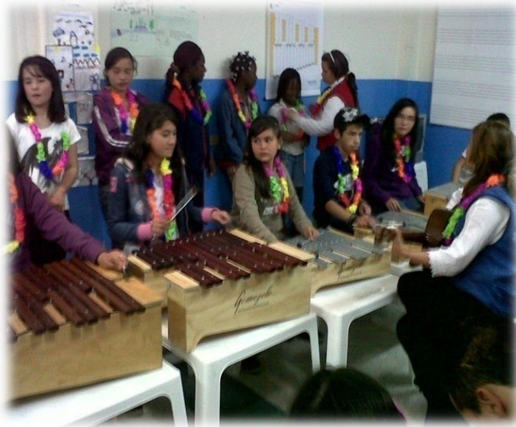
Fotografía 6. Clase de pre-orquesta