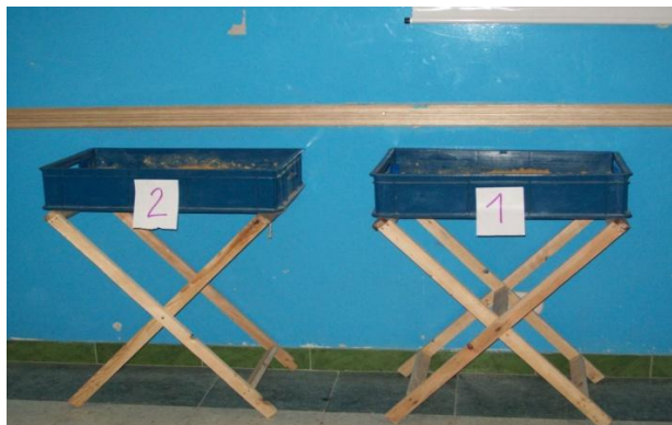
Fotografía 26. Cajas