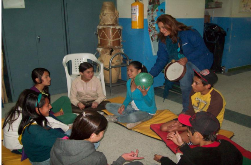
Fotografía13. Niños Sentados