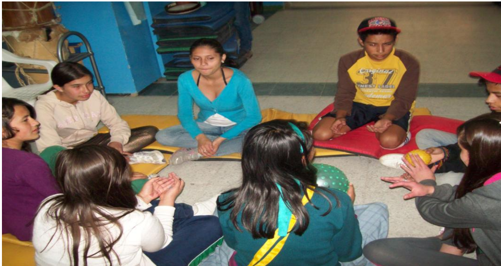
Fotografía 20. Niños cantando la rima