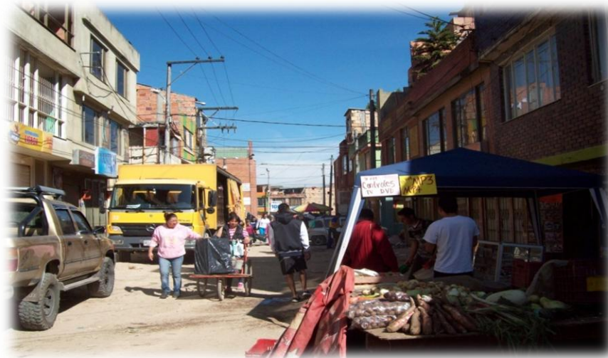
Fotografía 8. Barrio Lisboa