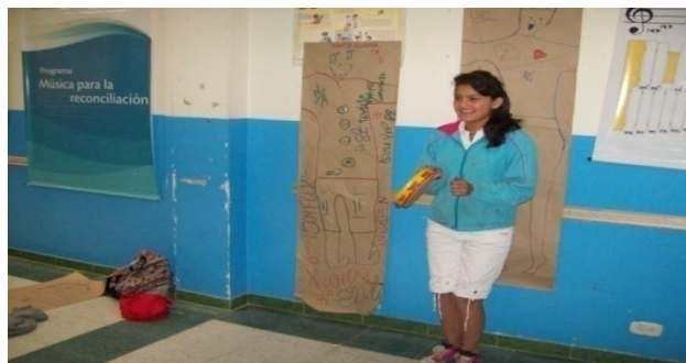
Fotografía 37. Niña Tocando

Se propone realizar composiciones utilizando el lenguaje e instrumentos de percusión escogidos por los participantes, alrededor de las siluetas, cada uno hará una composición de acuerdo con las cualidades escritas y al final se unirán todas y formaran solo una composición.