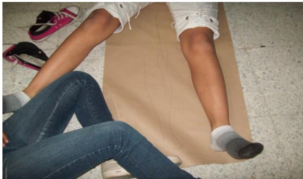
Fotografía 31. Niñas Dibujando su Silueta

En la fotografía se observa a los niños iniciando el taller