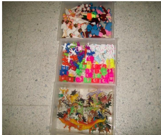
Fotografía 23. Figuras