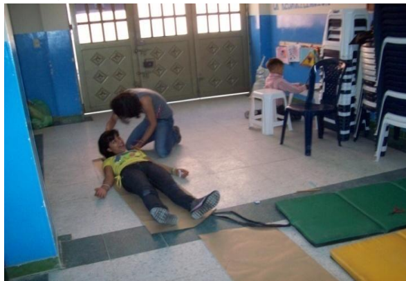
Fotografía 32. Niñas dibujando la Silueta

En esta parte del taller se deben sentir cómodos, por eso cada uno elige su pareja