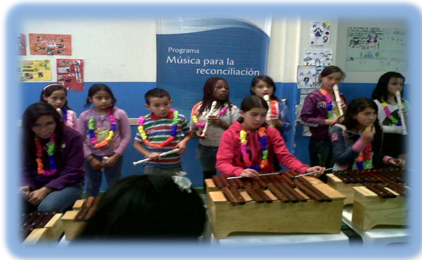
Fotografía 4. Niños, Niñas y adolescente en clase de Pre-orquesta