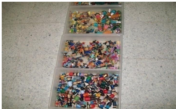
Fotografía 24. Figuras