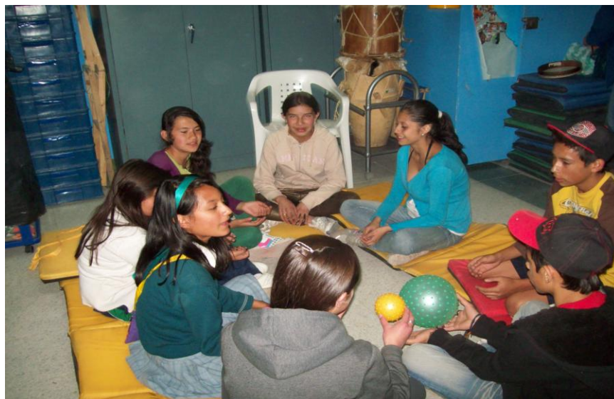
Fotografía 14. Niños sentados con las dos pelotas