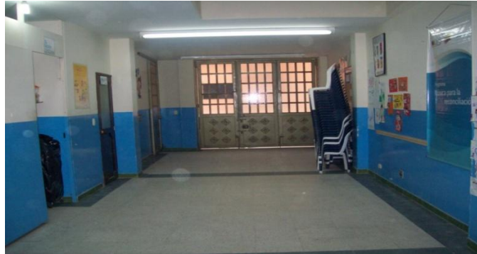
Fotografía 25. Espacio

Al iniciar el taller se sugieren una serie de figuras las cuales tiene personajes especiales para la realización de esta creación casas, personas, carros, etc.