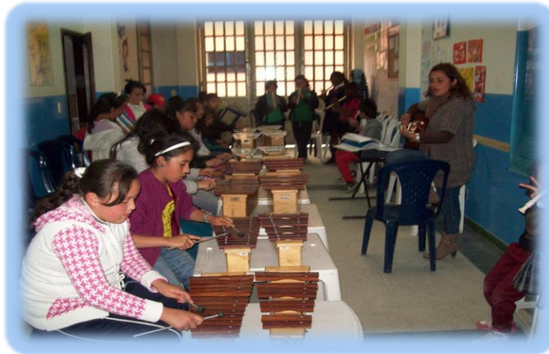
Fotografía 2. Iniciación Musical