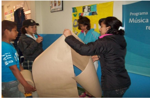
Fotografía 30. Niños del Taller