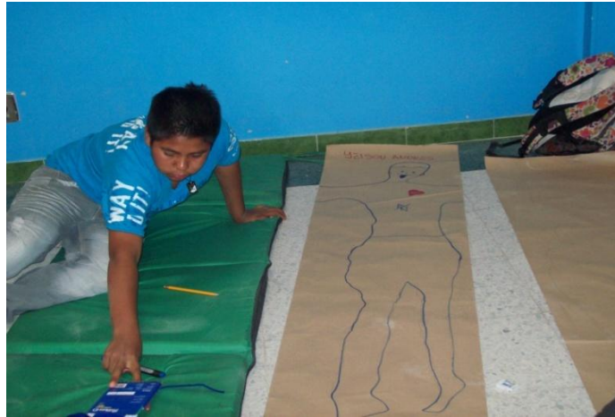
El niño escribe sus cualidades