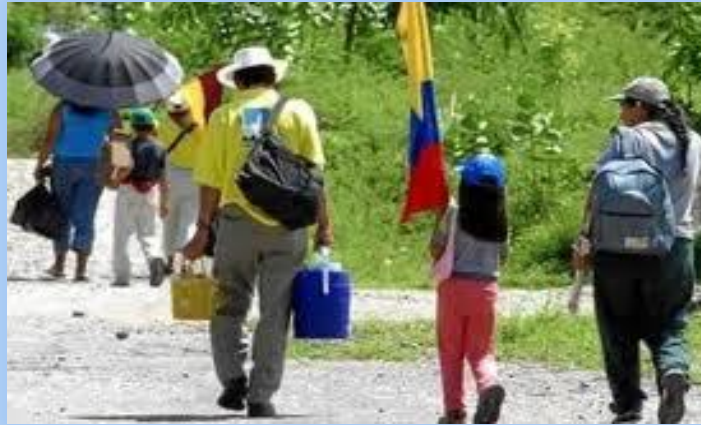
Fotografía 7. Personas Desplazadas