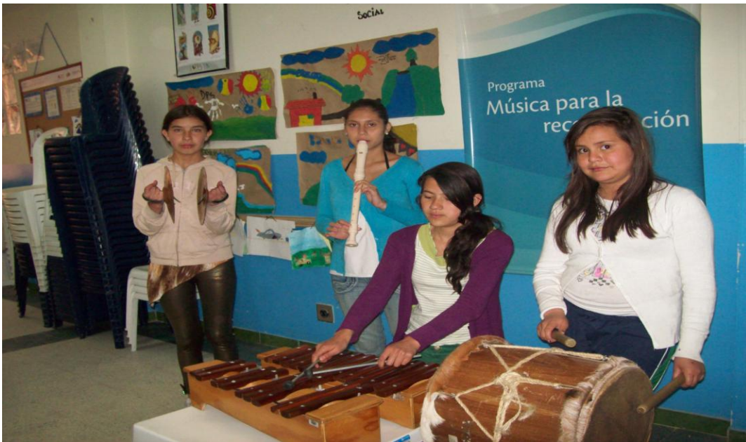
Fotografía 18. Niños tocando