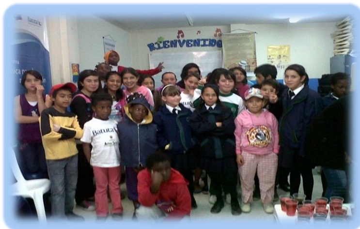
Fotografía 1. Niños Resilientes