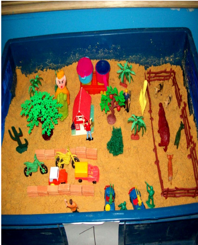
Fotografía 28. Evidencia 1