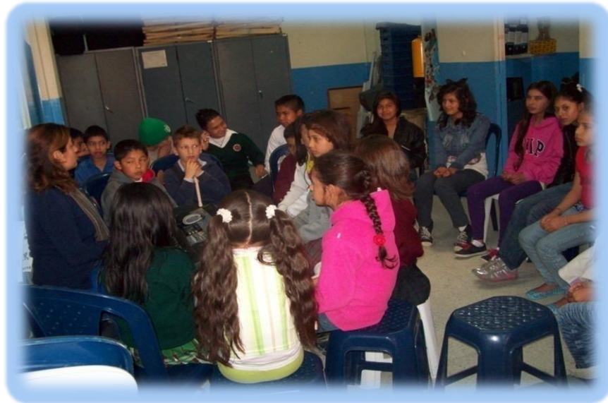
Fotografía 5. Clase de Coro