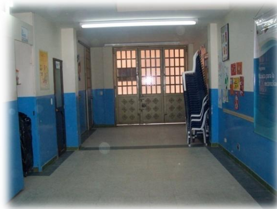
Fotografía 10. Centro Orquestal Interior

El C.O cuenta con 3 espacios, El salón donde se desarrolla a las clases de música tiene la siguiente dimensión: 11.70m de largo x4.70m de ancho, La oficina donde esta ubicado el computador y el archivador y un baño. El salón cuenta con buena iluminación.