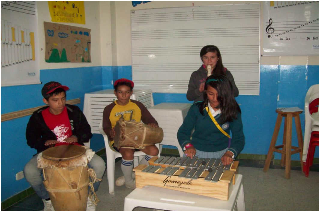
Fotografía 19. Niños tocando