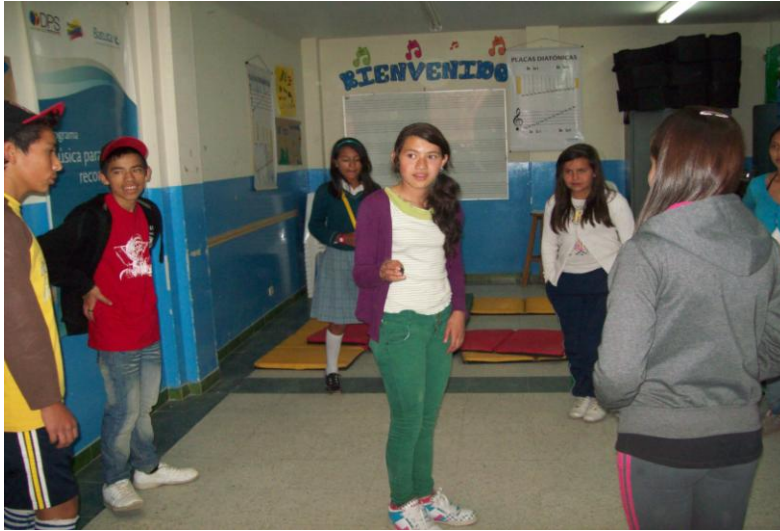
Fotografía 17. Niña Voluntaria