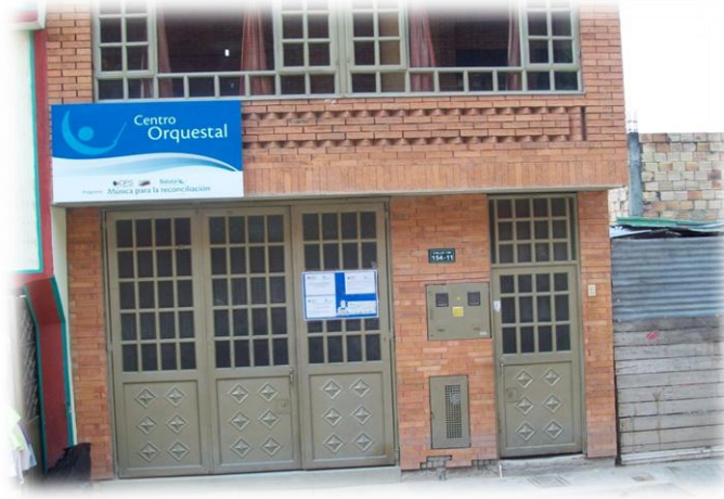
Fotografía 9. Centro Orquestal Batuta Lisboa Exterior