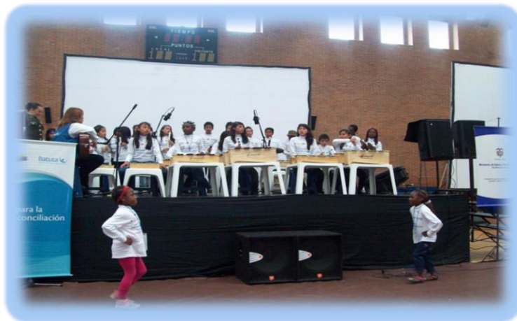
Fotografía 3. Niños, Niñas y adolescente Tocando