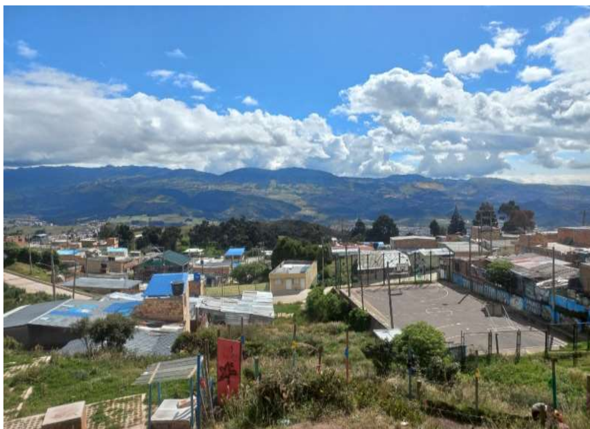
Foto del barrio San Pedro tomada desde la Huerta Sanpedrina.