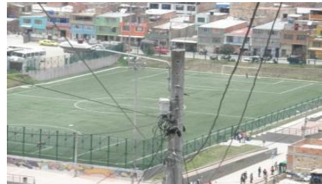
Imagen 3. Cancha de fútbol del parque Illimaní