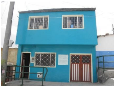
Imagen 1. Fundación Héroes Anónimos

Aunque la estrategia se plantea grandes retos frente a la restitución de derechos de la infancia desde las modalidades en las que se desarrolla la misma (Casas de Memoria y Lúdica y Equipos Territoriales). y del abordaje a lo largo y ancho del distrito la estrategia no ha llegado a toda la infancia víctima del conflicto armado en parte por la reestructuración que ha tenido en el cambio de los dos planes de desarrollo en la que ha sido ejecutada.