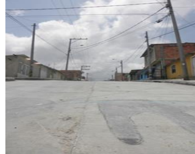
Imagen 2. Calle del barrio Bella Flor, de la localidad Ciudad Bolívar