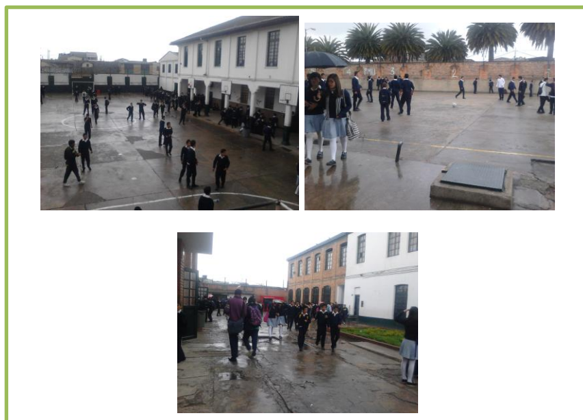
FOTO 5: Parte superior izquierda patio de las palmas, parte superior derecha patio de las palmas, parte inferior centro zona peatonal parte trasera del colegio. Fotos tomadas por: Francy Lorena Rodríguez 22 de julio 2013.

Si nos desplazamos hacia la parte trasera del colegio encontraremos dos edificios, uno de ellos construido recientemente el cual consta de 3 plantas donde funcionan los salones de artística (música y artes plásticas) y el gimnasio o salón de educación física, junto a otros dos salones. Conjuntamente, encontramos la fábrica de reciclaje de papel y un edificio más donde funcionan improvisados salones en el segundo piso y el baño de hombres en el primero.