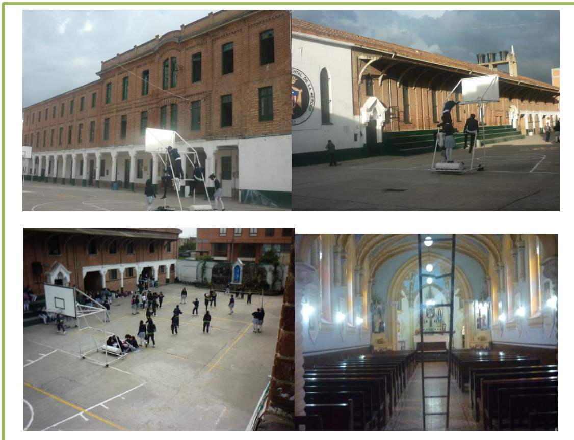
FOTO 3: Parte superior izquierda edificio 1, parte superior derecha edificio 2, parte inferior izquierda cancha de baloncesto y voleibol y parte inferior derecha capilla en restauración. Foto tomada por: francy lorena rodriguez, 22 de julio 2013.

por las graderías, el segundo edificio consta de dos pisos en el primero se encuentra el baño de las niñas y la capilla de la institución donde reposa la imagen de la virgen de La Merced y que también funciona como escenario para la realización de celebraciones religiosas enmarcadas dentro del rito católico como son las primeras comuniones y las eucaristías que se realizan al momento en que la institución recuerda su fundación junto con la sacristía de la misma.