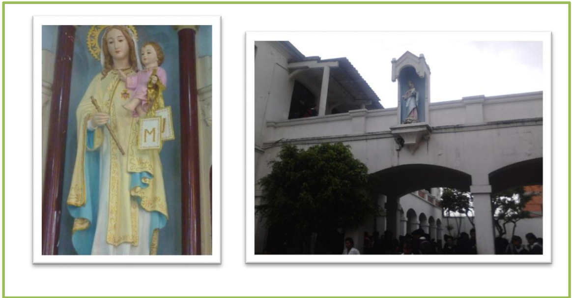
FOTO 1: A la izquierda la virgen de la merced y a la derecha maria auxiliadora. Foto tomada por: Francy Lorena Rodriguez, 22 de julio 2013.

Para el año 2010 el municipio de Mosquera es certificado en sus procesos de educación a raíz de la restructuración administrativa el colegio cambia al nombre de “Institución Educativa La Merced” y con el cual continua educando en el municipio de Mosquera.