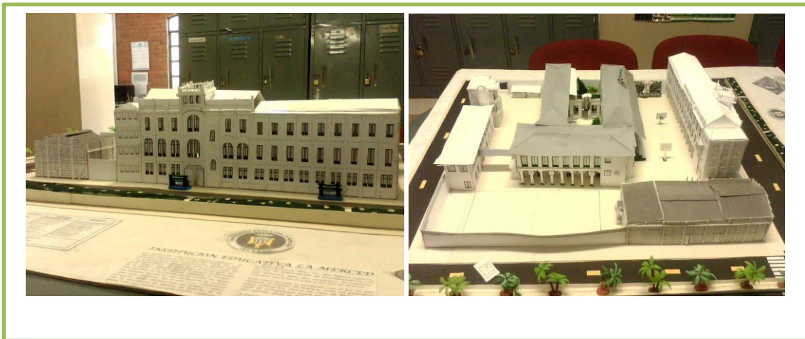
FOTO 2: A la izquierda, maqueta de la fachada de la institución y a la derecha maqueta completa de la estructura física de la actual institución la merced. Foto: Francy Lorena Rodríguez 2 de abril del 2013.

Esta institución en su sede principal ubicada en la calle 3 N° 2 – 50 posee unas instalaciones físicas que constan de 6 estructuras o plantas físicas que ocupan una cuadra completa del centro del municipio, limita al oriente con la carrera 2 donde se encuentra ubicado el edificio donde funciona la personería municipal y la sucursal bancaria Bancolombia; al sur limita con la calle 3, el parque principal de municipio y la iglesia María Auxiliadora; al occidente con la carrera 3 o vía de Las Palmas y al norte con la calle 4 donde se encuentran ubicadas casas de antigua arquitectura.