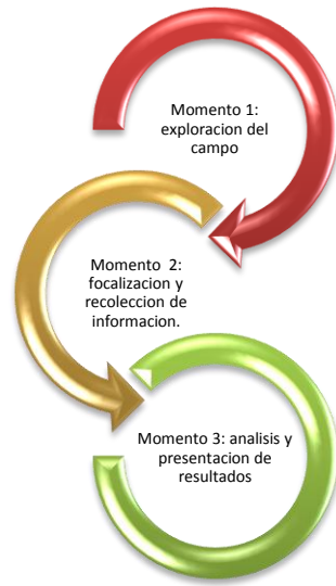
FIGURA 1: Esquema explicación fases y diseño metodológico.