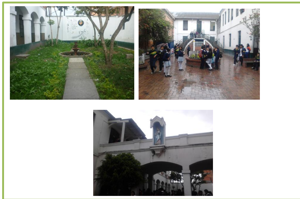
FOTO 4: Parte superior izquierda patio de Las Rosas, parte superior derecha patio Bulevar, parte inferior centro puente conector con la imagen de María Auxiliadora. Fotografía tomada por: Francy Lorena Rodriguez, 22 de julio 2013.

En la segunda planta encontramos el laboratorio de física y dos salones. Este edificio conecta con un puente al tercer y cuarto edificio donde se encuentran la mayoría de salones de clase. El puente atraviesa el tradicional patio de las rosas y El Bulevar; un lugar donde las estudiantes pueden reunirse a disfrutar de su refrigerio escolar y departir un poco. En el centro de este patio se encuentra un conjunto de escaleras que consta de una escalera principal central con una división de la misma en dos escaleras curvas estas dan ingreso directo a los salones del 4 edificio donde se imparte clases de inglés, sociales y biología. Es importante resaltar que en este colegio las estudiantes son las que rotan por los salones a diferencia de otros que el maestro es el que desplaza por las diversas aulas para impartir su clase. En este espacio también se encuentra la entrada a la cafetería escolar. En este lugar se encuentra una de las imágenes de la virgen en su título de María Auxiliadora que está ubicada en un costado del puente.