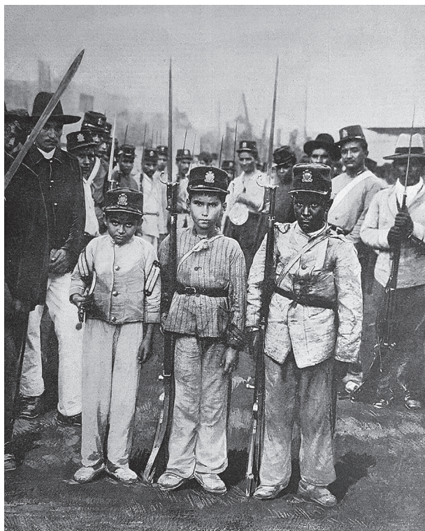
Figura 3. Niños soldados del Ejército del Gobierno