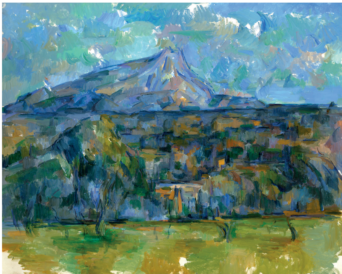
Imagen de cubierta