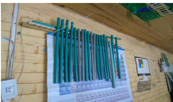
Imagen 11. Flautas de PVC, salón de artística