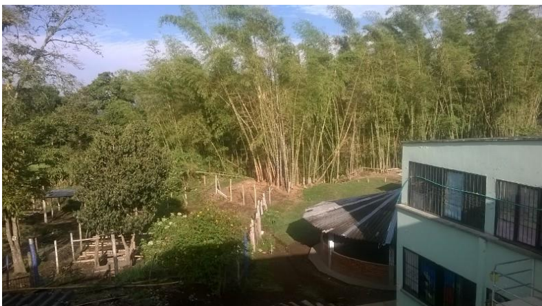
Imagen 9. Instalaciones de la EAAKMP.