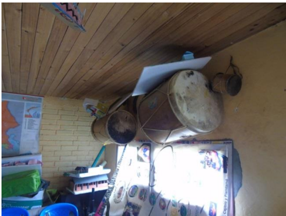
Imagen 10. Salón de clases artística de la EAAKMP.

flauta son las principales y cuáles son las que “segundeán”. Por otra parte, los tambores son de distintos tamaños para que se acoplen a la estatura de los estudiantes, y no es muy clara la diferenciación entre el tambor macho y hembra, los cuales son trascendentales a la hora de ejecutar la música propia.