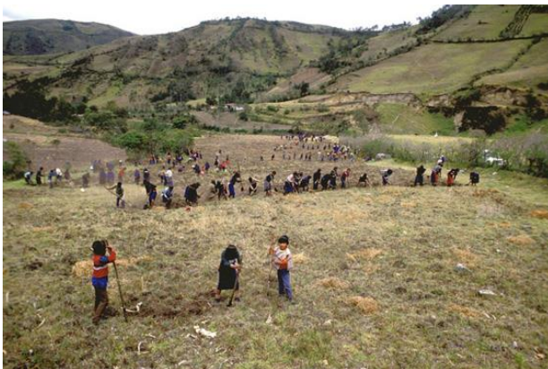
Imagen 6. Minga en territorio Misak.

Como se puede observar en la imagen 6, los niños, adultos y músicos participan de una minga en la cual siembran alimentos para una familia Misak, que pronto será retribuida en otra cosecha.