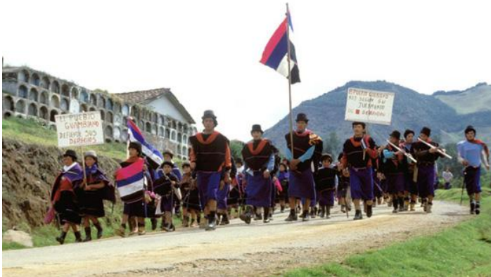
Imagen 8. Marchando por todos.