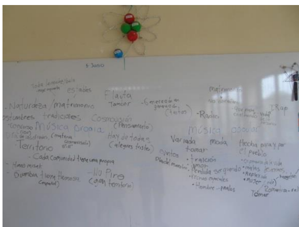
Imagen 12. Caracterización de los estudiantes

En el segundo taller se hizo un diálogo de saberes, esta vez con los conceptos de música propia y música popular, como se puede observar en la siguiente fotografía se hizo una lluvia de ideas, el cual buscó agrupar y sintetizar las principales nociones que tienen los estudiantes sobre estos dos conceptos.