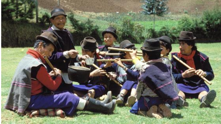
Imagen 7. Cosmovisión de flautas.