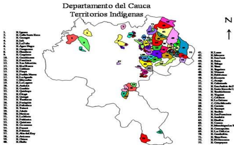
Mapa 1. Territorios indígenas del Cauca