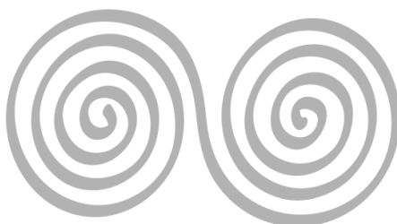
Imagen 3. Espiral doble