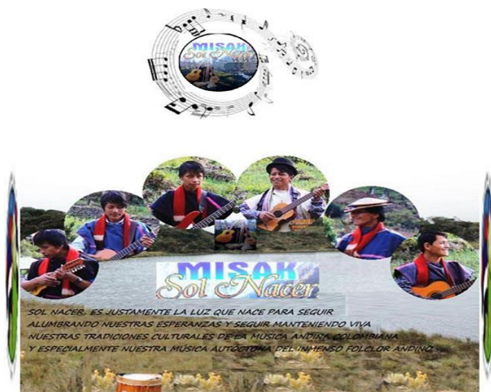
Imagen 13. Grupo Musical Sol Nacer

Fuente: http://festivalmononunez.com/expresiones_cuatro.html , Consultado en 2019