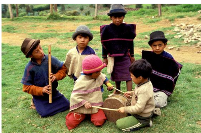
Imagen 5. Luzpal Θ.

Después deja de llover y ya y se aclara sale el sol y salen los pájaros y empiezan a llamar a avisar, de ahí proviene la flauta. De la Torcaza y del chiguaco porque ellos son indicadores. Ellos avisan cuando algo va a pasar, dan señal de que alguien va a fallecer, entonces el pájaro habla cuando está contento, cuando está triste.