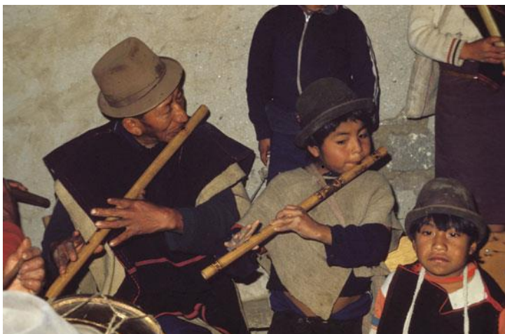
Imagen 4. Dos generaciones de flautistas