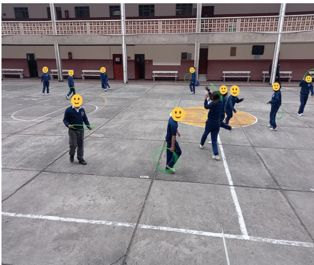
Imagen 3 Intervención pedagógica

Iniciando con el juego de la GOLOSA, se trabajará el lanzamiento partiendo que los estudiantes tienen que lanzar las fuchis que se les asignan, teniendo en cuenta en qué aro cayó la fuchi, los estudiantes tendrán que realizar el recorrido saltando los aros que en este caso están a una distancia más lejana, es decir que los estudiantes tendrán que tomar mayor impulso para realizar el salto. En esta sesión se están trabajando los patrones básicos del movimiento de locomoción en este caso el brincar que se está evidenciando en los saltos que se realizan atravesando los aros, y los de carácter manipulativos en los lanzamientos de las fuchis que se lanzan a la golosa de aros.