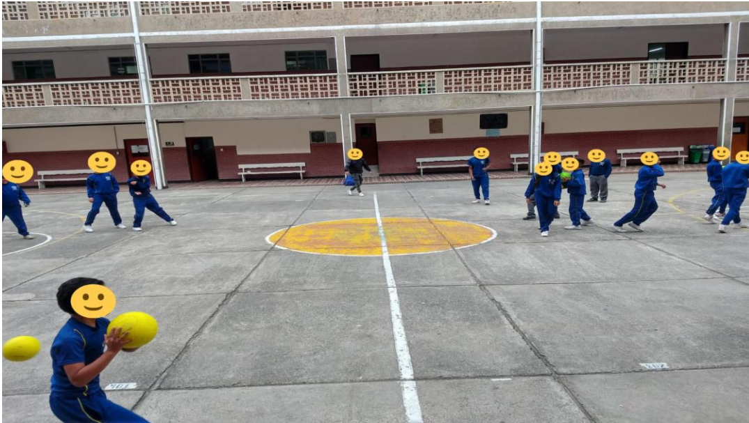
Imagen 1 intervención pedagógica.

Ahora bien, se intentó potenciar en el salto en un apoyo y a pie junto en el juego llamado CHICLE, el cual consistía en delimitar una cuerda de manera paralela a la altura de la rodilla de los niños, en donde debían saltar siguiendo un ritmo y una frecuencia dadas por el maestro, evidentemente, este juego debía realizarse de manera individual, pero en coordinación grupal, es decir, que todos los niños deben seguir un solo ritmo para que la cuerda no pierda su forma. Cabe destacar, que las variantes utilizadas en este juego iban direccionadas hacia salto en un apoyo intercalado, es decir, se saltaba en un apoyo y después sobre la otra pierna, creando confusión al momento de cambiar el ritmo por medio de aplausos.