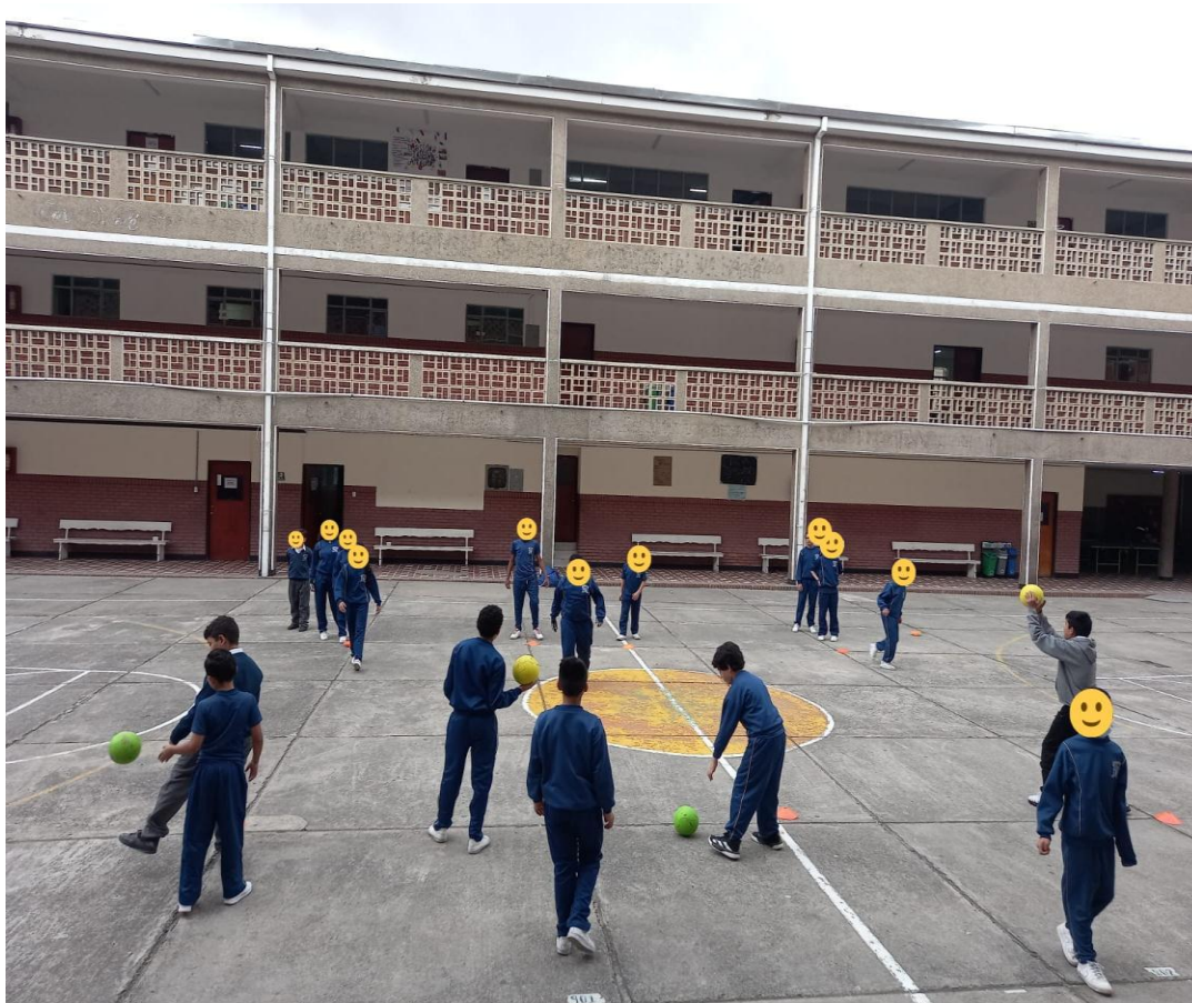
Imagen 2 Intervención Pedagógica

Como base y fundamento de esta cuarta sesión de clase, se tuvo en cuenta los diarios de campo que se utilizaron en la anterior sesión para poder comprobar cómo se han ido evidenciando las ejecuciones de las habilidades motrices básicas y los patrones básicos de movimiento, en donde se recaía en las malas posturas a la hora de realizar un movimiento, por ejemplo, cuando se propone el juego de los ponchados con la variante del pateo, la carrera antes de llegar al balón se ve muy mecánica y poco armoniosa por lo cual en esta sesión de clase se abordaron este tipo de problemáticas.