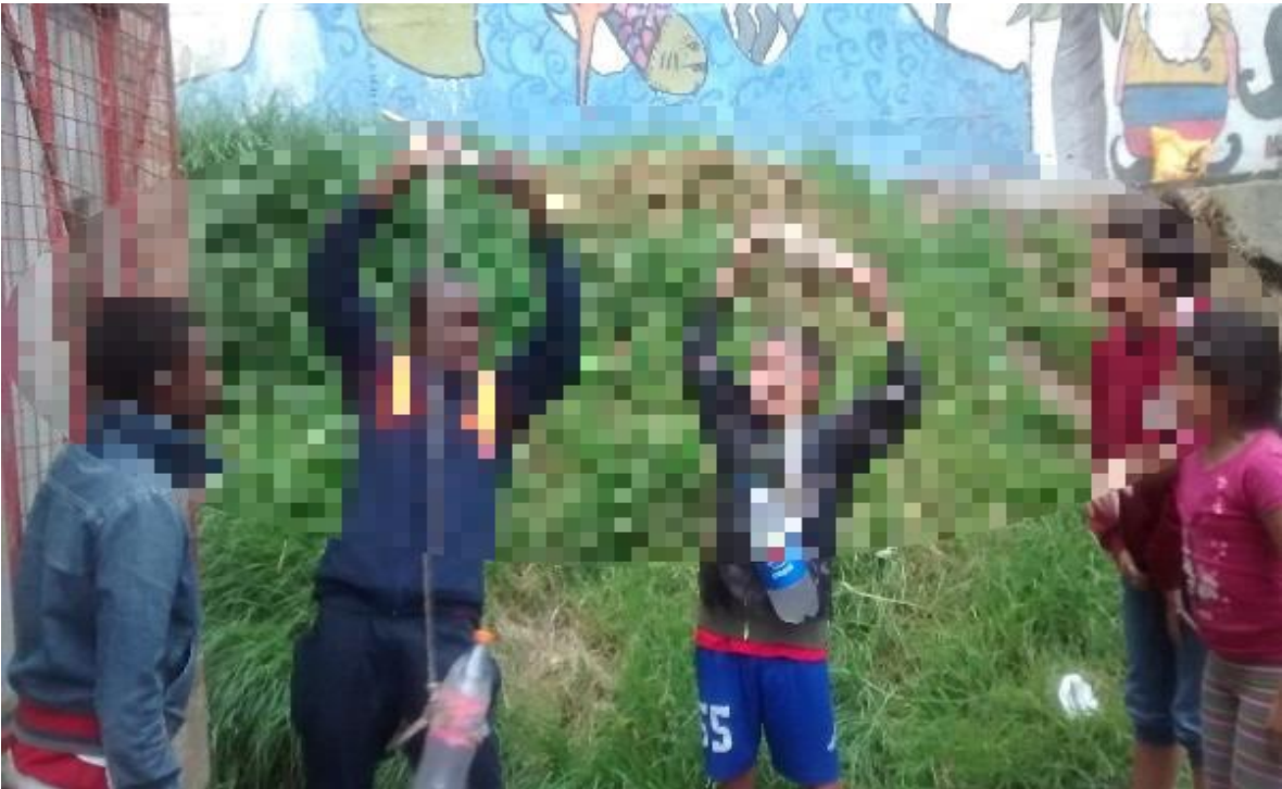
fotografía 6 estación fuerza ancestral