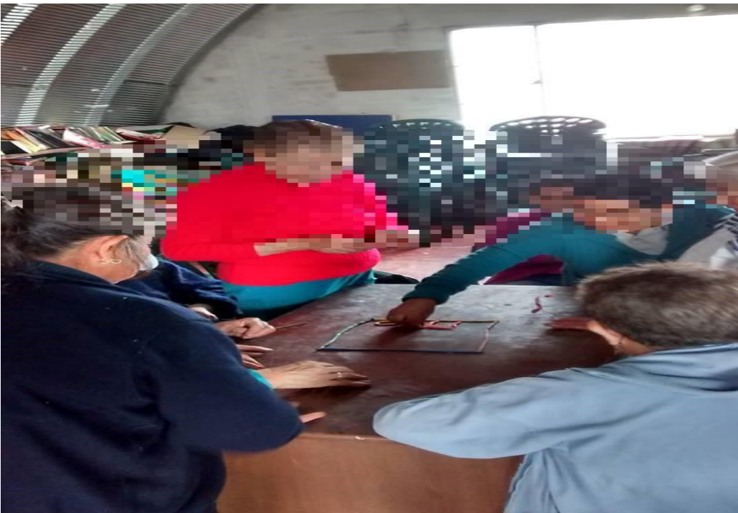
fotografía 2 motricidad fina