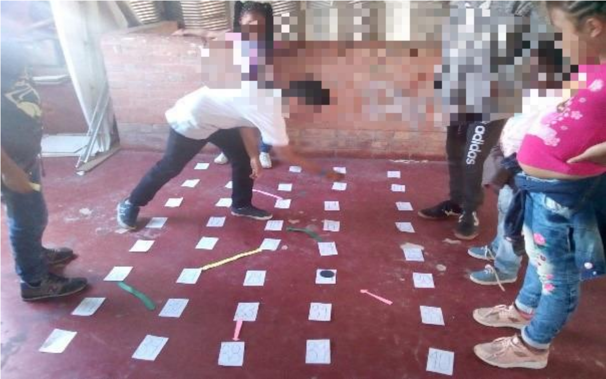
fotografía 5 estación escalera