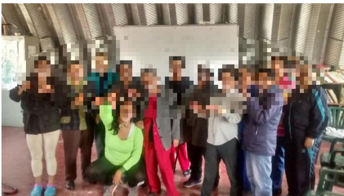
fotografía 3, 31 de octubre

Para el 31 de octubre de ese año ya habíamos hecho el ridículo muchas veces de modo que la actividad propuesta, lejos de todo fundamento en la actividad física, fue pintarse uno a otros la cara como si fuera algún animal. En algún momento pasado del proceso, muchos se habrían opuesto, pero ese 31 de octubre todos demostraron disfrute en las burlas y en la ayuda al otro para lograr sus animales. Todas y todos se pintaron la cara, y esta experiencia tal vez no le enseñó nada a nadie, pero fue importante porque nadie dudó en participar, fue importante porque la única razón para hacerlo fue verse pintado, fue porque todos se permitieron jugar sin pensar en que había en la casa alguna labor más importante que esto y que esperar. Además del hecho lúdico de la representación de un animal, esta jornada de pintura fue un primer acercamiento físico espontáneo entre los integrantes del grupo de trabajo, un acercamiento que en anteriores jornadas no se había dado con tanta confianza como ese día.