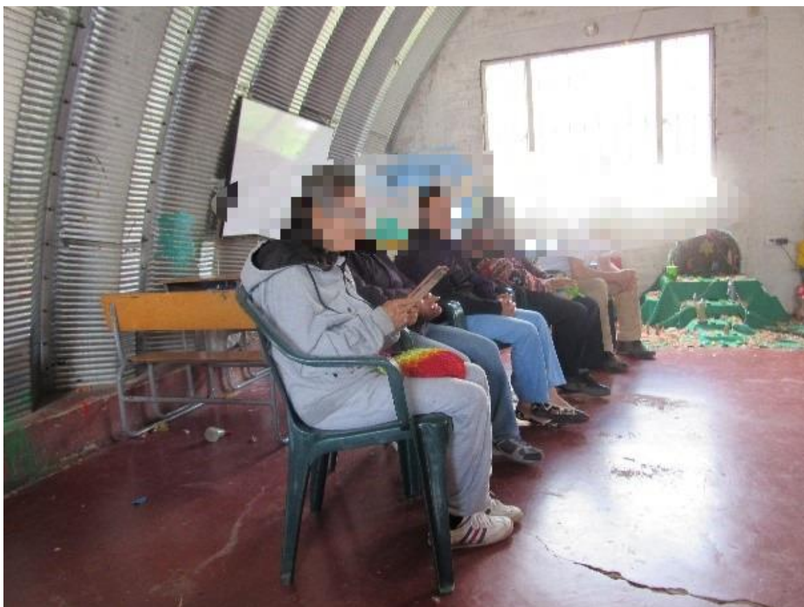
fotografía 4 jornadas de diálogo

de estos se crearon canales de confianza que facilitaron los demás ejercicios de trabajo en equipo a través del diálogo y la escucha activa.