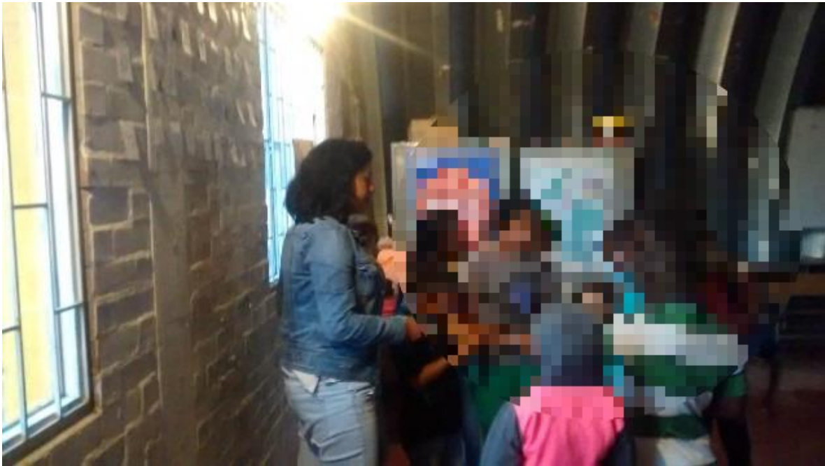
fotografía Testación acertijos

Estas interacciones permitieron establecer algunos intereses y necesidades de los niños y jóvenes y es así como planean y organizan actividades recreativas en común acuerdo con los participantes y con las circunstancias de tiempo y espacio. Durante dos años consecutivos se lleva a cabo la preparación y ejecución de actividades recreativas encaminadas a la realización de una novena de aguinaldos. La primera de ellas propuesta por las personas que orientaron el trabajo, pero apoyada por los integrantes de la comunidad, sobre todo por los niños.