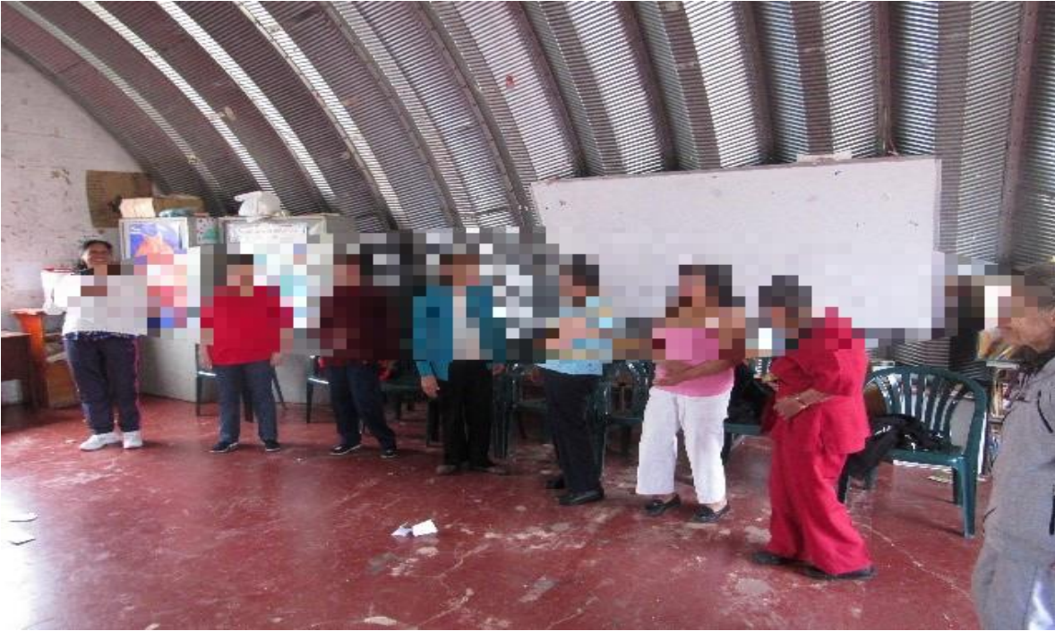
fotografía 1 creación de coreografía