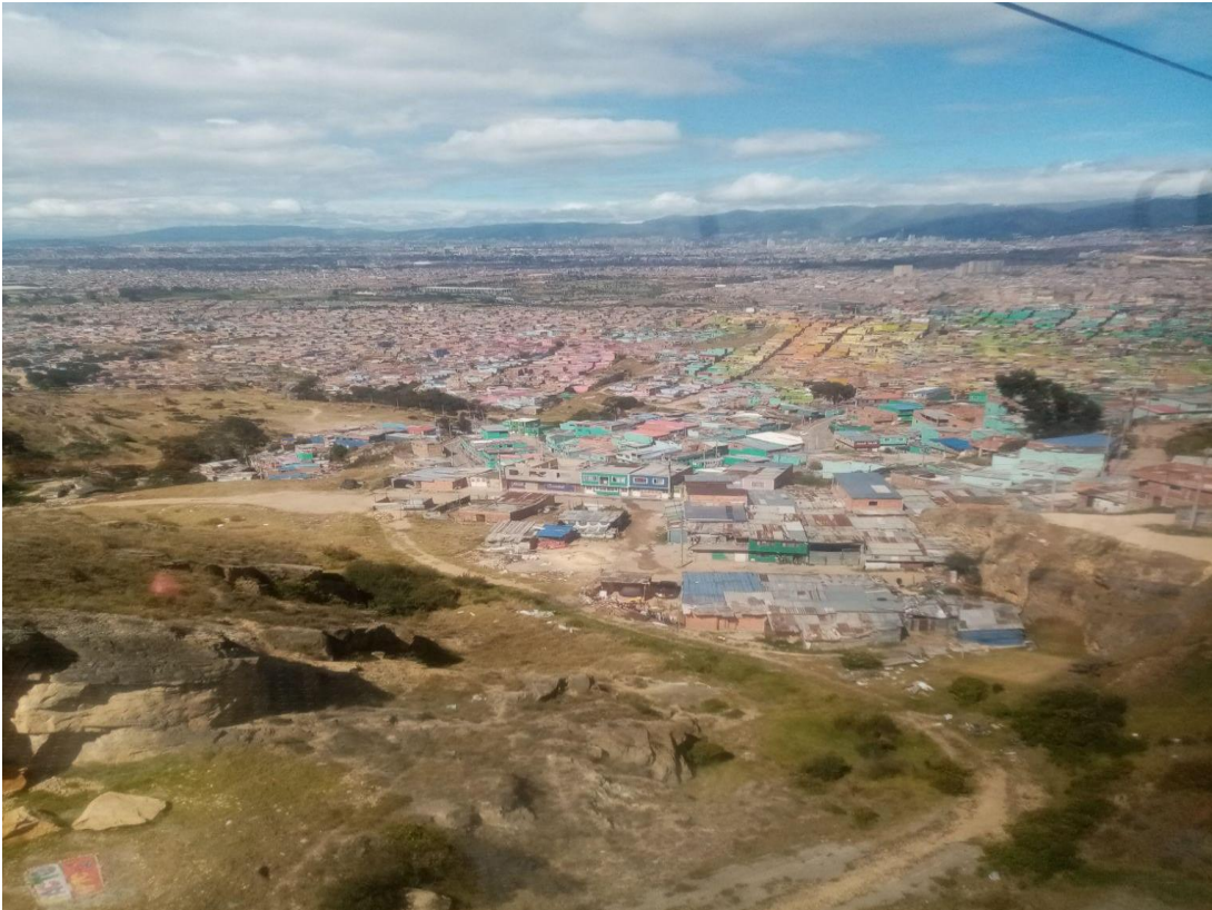
Figura 2. Creación Propia: Toma desde la parte media del cerro seco de la montaña en Ciudad Bolívar (2023)