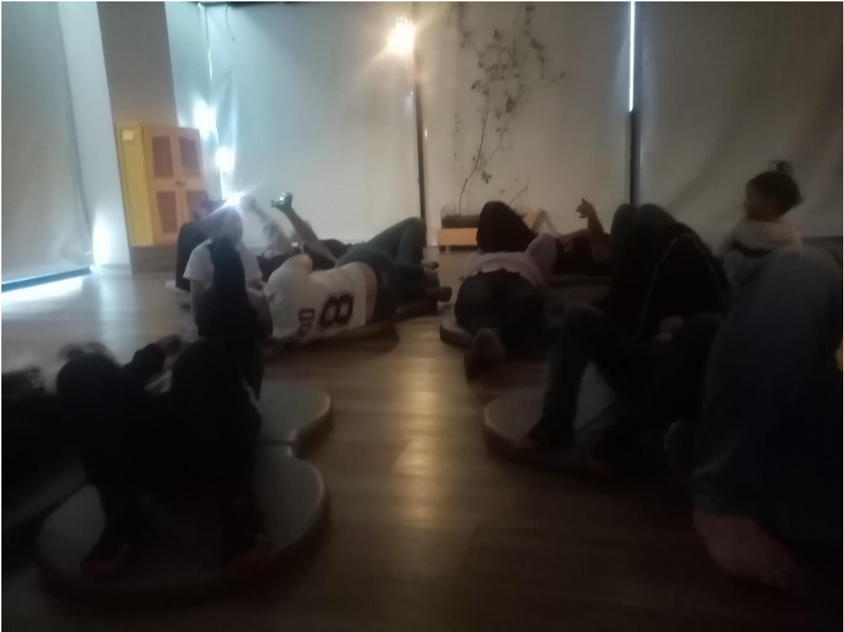
Figura 3. Actividad Lluvia de brillos, creación propia (2023)

A pesar de estas tensiones, programas como Nidos han mostrado que la creación artística puede transformar paisajes urbanos estigmatizados. En Manitas, la intervención en una escalera convertida en centro cultural permitió reconfigurar dinámicas comunitarias y fortalecer la organización popular, incluyendo a niñas y niños (Estupiñán, 2018). Así, la integración de familias, docentes y artistas constituye una base sólida para construir geografías de las infancias en clave de justicia espacial, agenciamiento del espacio social y democratización cultural.