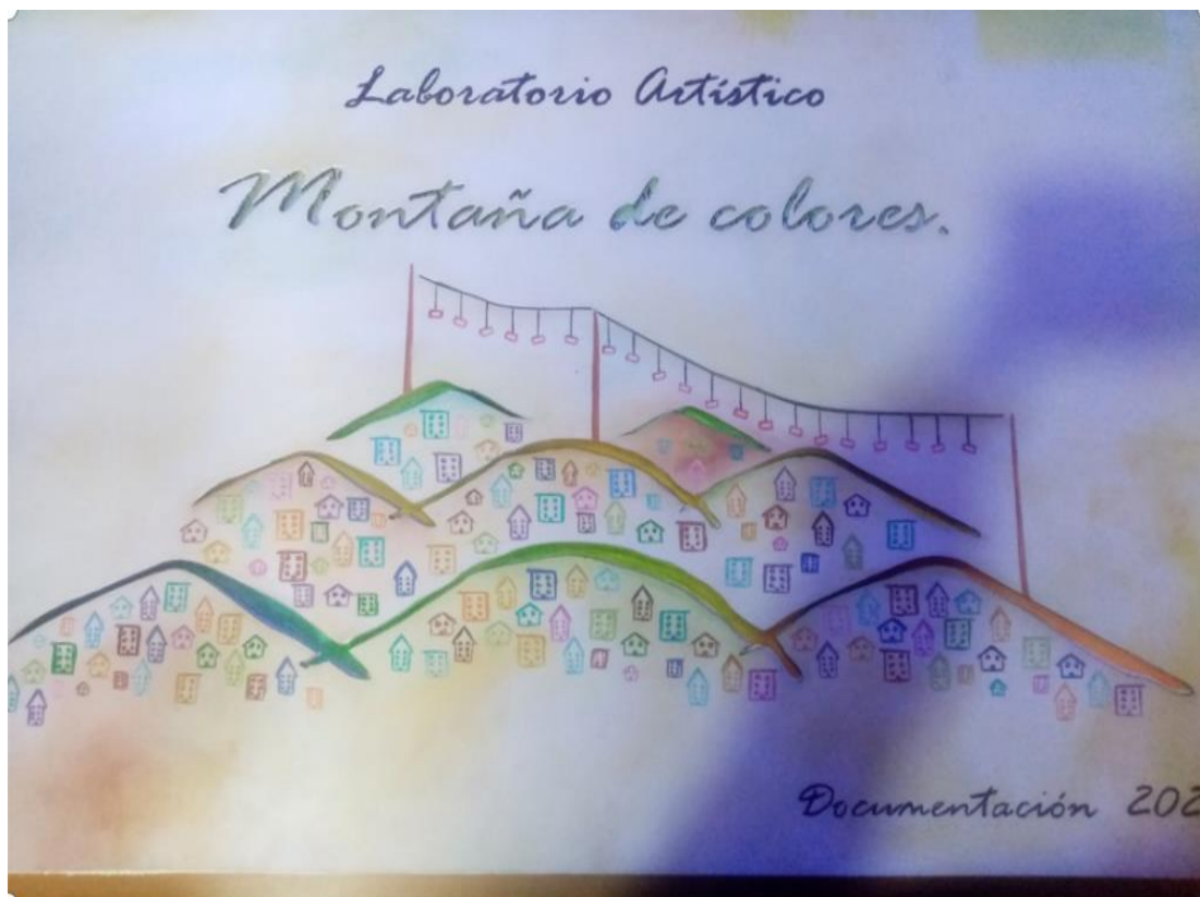
Portada FLAP Laboratorio artístico NIDO Montaña de Colores, 2023, creación propia.

“apalabra palabrero, palabras apalabradas apalabrando palabras palabrero “palabrea”