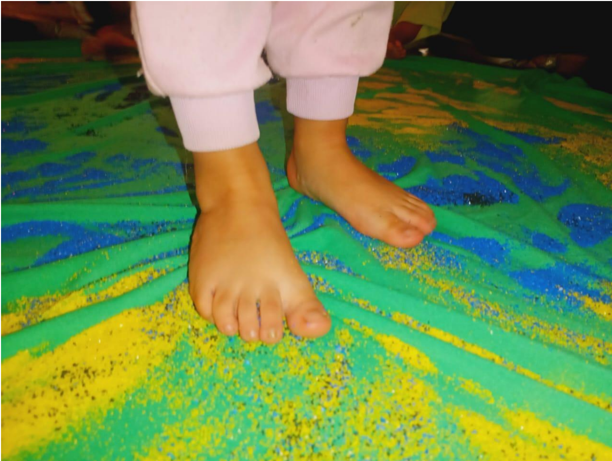
Figura 7. Actividad Montaña de Colores, creación propia (2023)