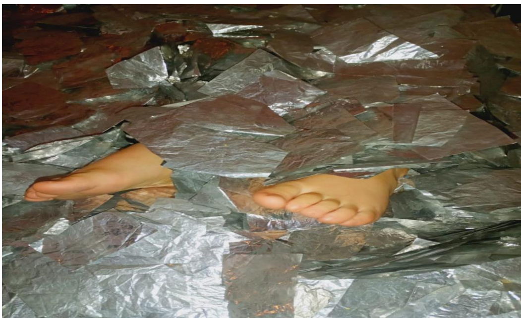
Figura 6. Actividad Lluvia de brillitos, creación propia (2023)

respuestas no están en los contenidos de textos enciclopédicos, sino en la experiencia vivida, en el cuerpo que explora y en la palabra que intenta comprender.