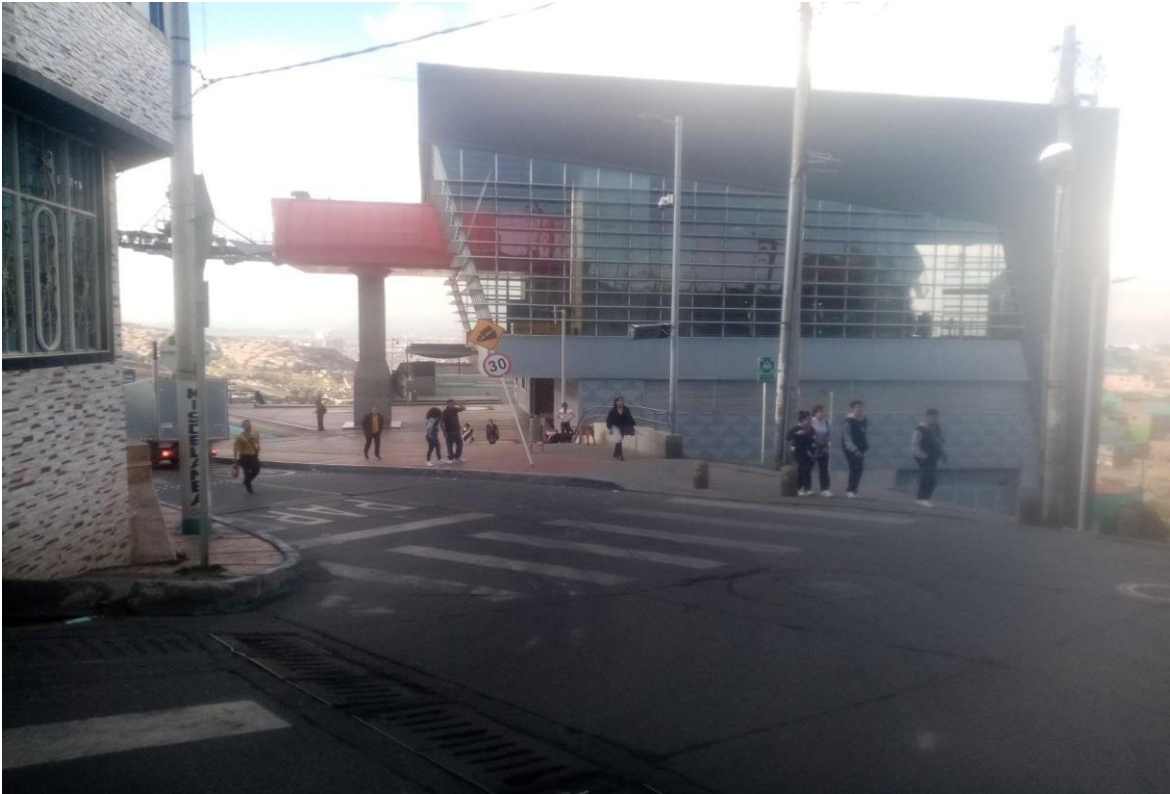
Figura 1. Estación de TransmiCable “Manitas”, parte lateral. Creación propia (2023)

El núcleo de intervención fue el Nido Montaña de Colores (Programa Nidos – Idartes), localizado en el CREA Manitas, concebido como laboratorio artístico-pedagógico para la primera infancia y diseñado a partir de los intereses de la comunidad (Nidos/Idartes, 2019, Voces del territorio , pp. 10–13). Dicho laboratorio funciona como un espacio de mediación cultural para niñas, niños, familias y mediadores/as, donde se promueven prácticas artísticas que potencian la imaginación, la escucha y la apropiación del entorno (Idartes, 2023, Portafolio de servicios , p. 46).