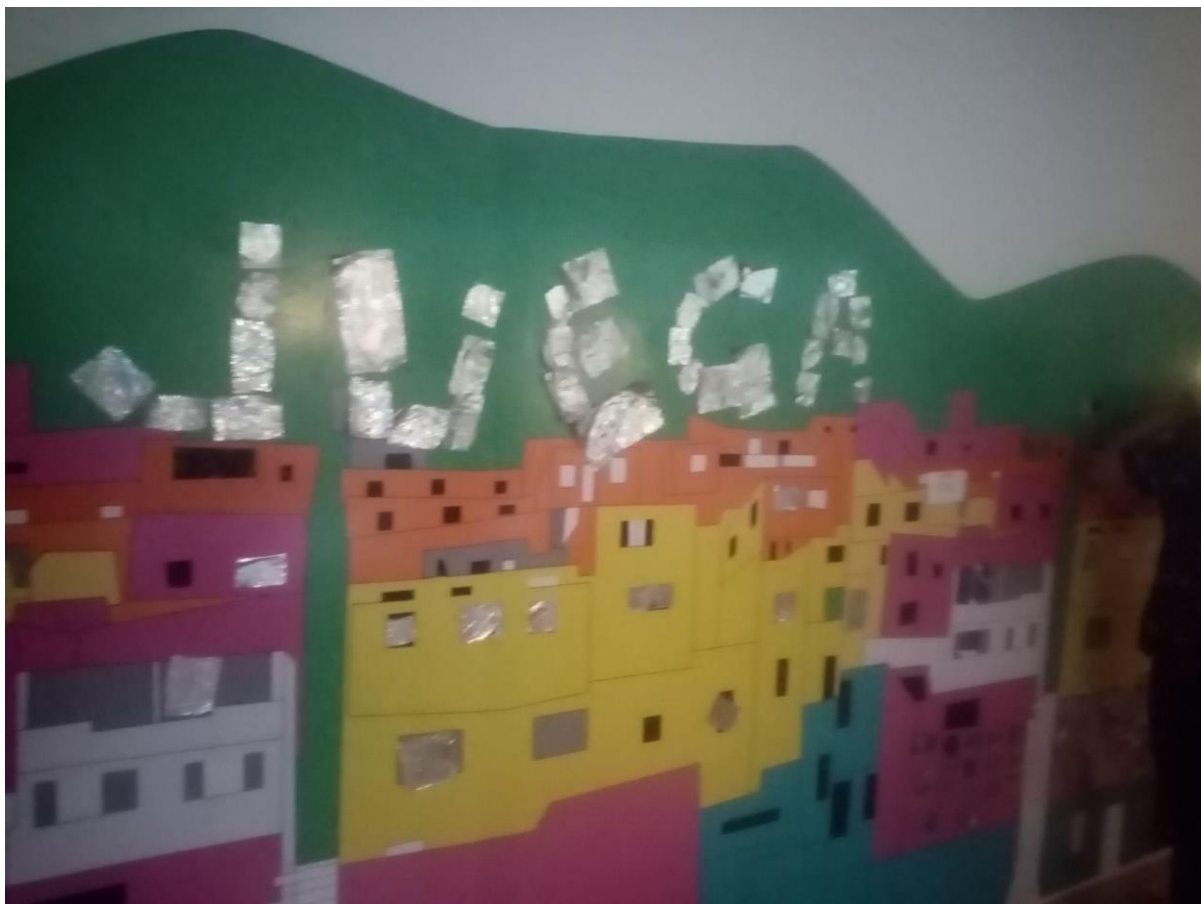
Figura 8. Pared del laboratorio luego de una experiencia