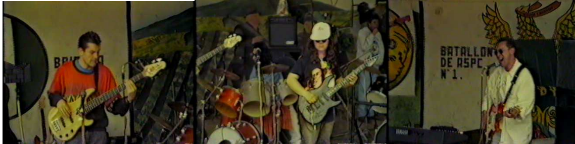
Figura 12. Gaia Ozono.