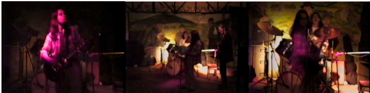
Figura 9. Asor.