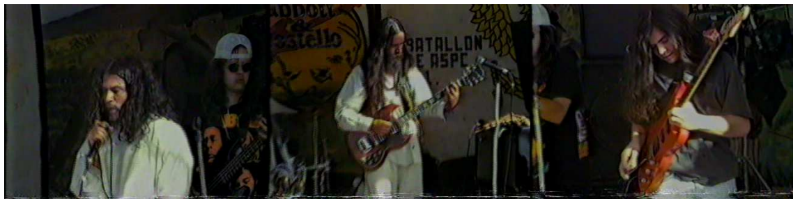
Figura 13. Vientos del sur.