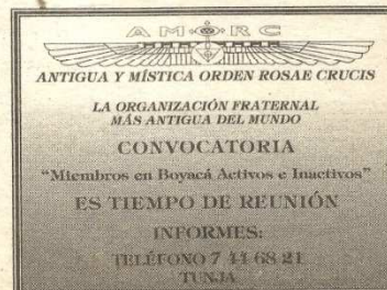
Figura 35. Recorte Boyacá 7 días.

*Gestor Cultural Asociación de Artistas Plásticos