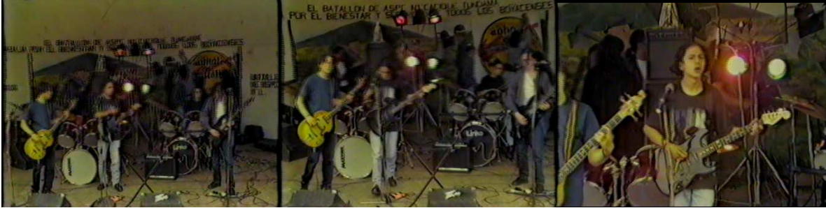
Figura 20. Insomnia.