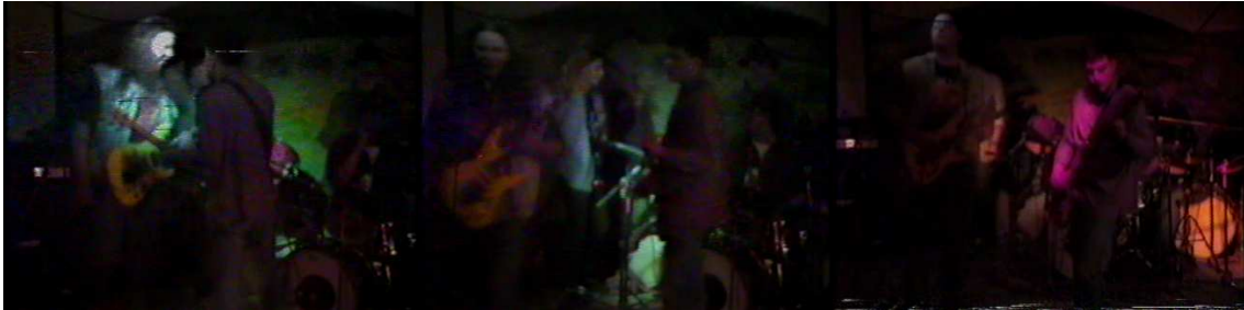
Figura 8. Cuerdas de acero.