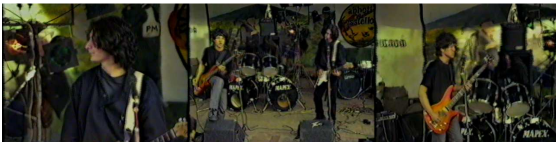
Figura 15. Abu Jaul. Fuente. Autor