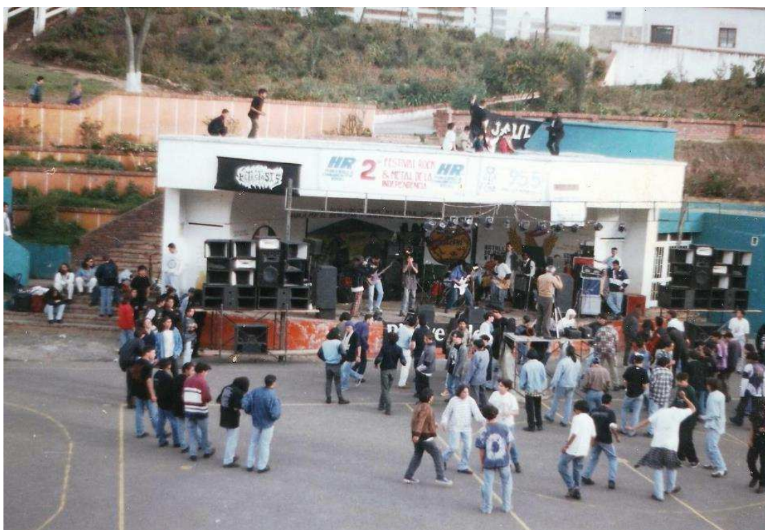
Figura 1. Segunda edición del Festival Rock de la Independencia 1997 (media-torta Parque Santander Tunja).

Los fotogramas de las agrupaciones que se sacaron de los videos en formato Betamax y vhs , son organizados inicialmente en orden de aparición de las agrupaciones que participaron en las tres primeras ediciones del Festival.