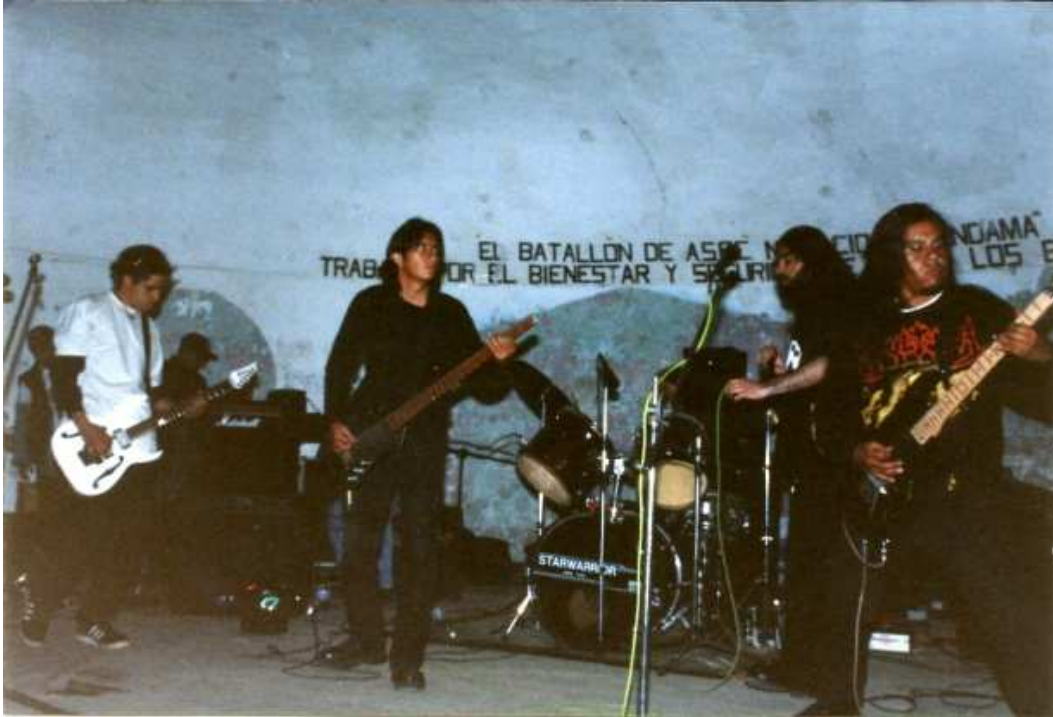
Figura 24. Socavon.