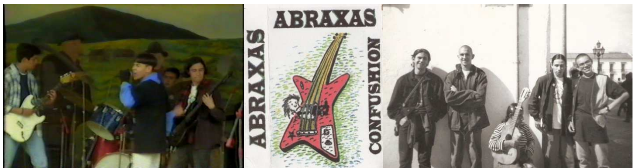
Figura 3. Abraxas.