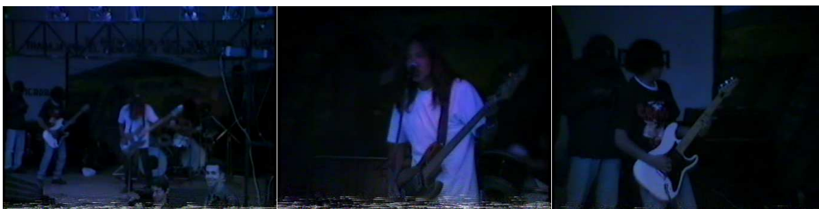
Figura 23. Karkum.