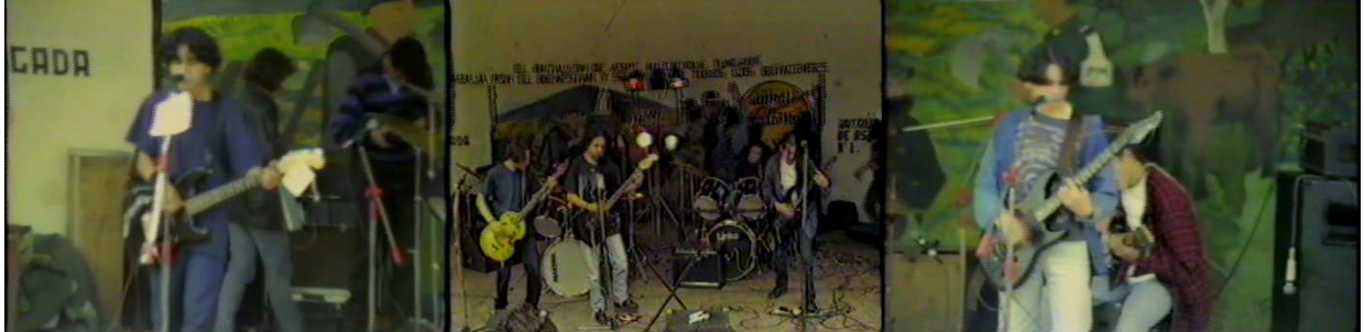
Figura 2. Insomnia.