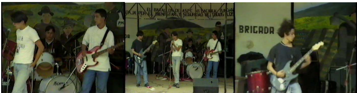
Figura 5. Calle del purgatorio.