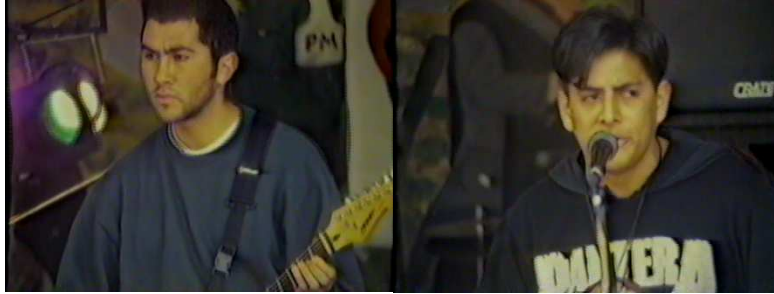
Figura 16. Fantasma de Aber Deem. Fuente. Autor