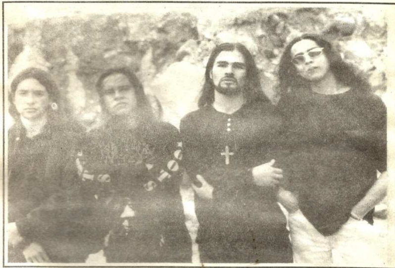
Los integrantes del grupo Socavon

Con ocasión de la fiesta de la Independencia, el pasado 20 de julio, se cumplió en la ciudad de Tunja, el Segundo Festival de "Rock-metal de la Independencia". El evento se llevó a cabo en el Parque Santander y desde las 10 a.m., los jóvenes tunjanos disfrutaron de los ritmos modernos hasta las 10 de la noche, hora en que se dió por terminado el espectáculo.