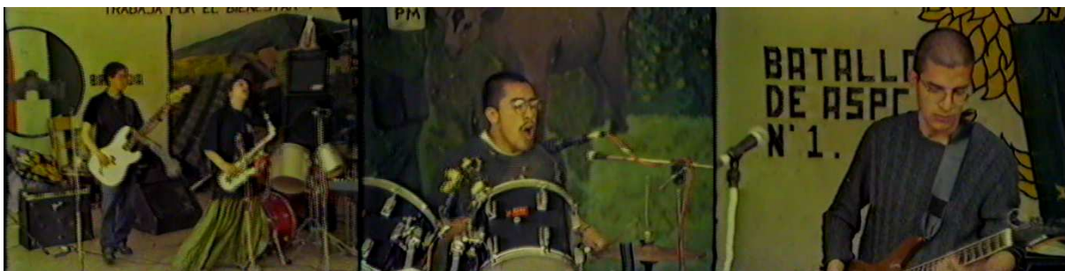
Figura 11. Supermaquina.