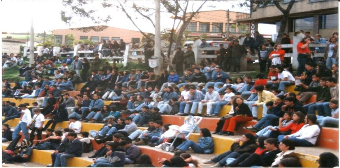
Figura 26. Público media torta del parque Santander. Tunja 20 de Julio 1996.