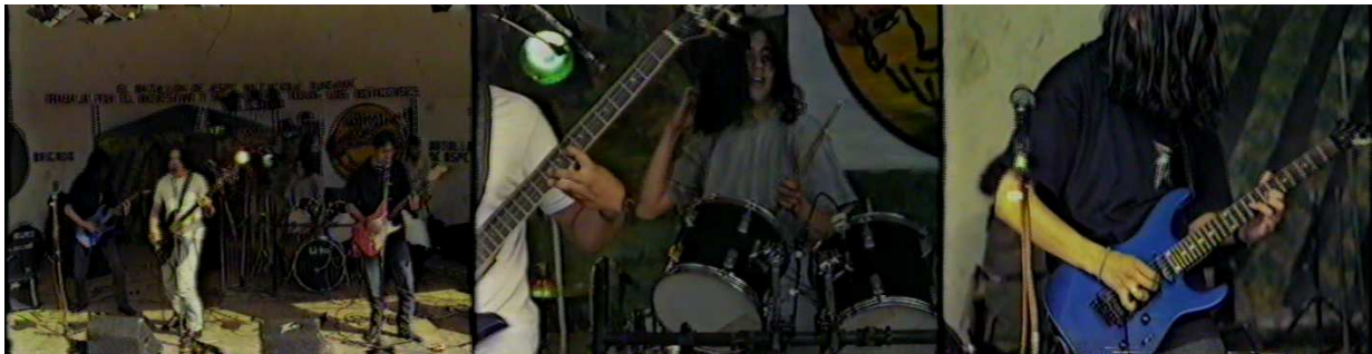
Figura 21. Blue.