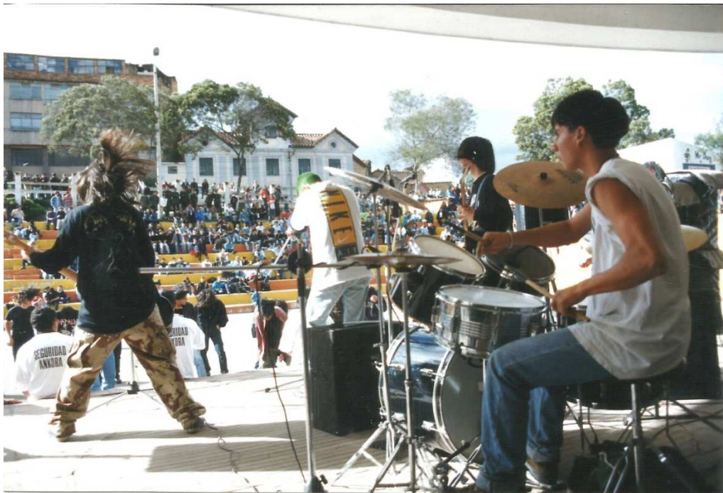
Figura 25. Inicio del festival, Tunja 20 de Julio de 1996, media torta Parque Santander ( Astaroth en escena), Fuente.