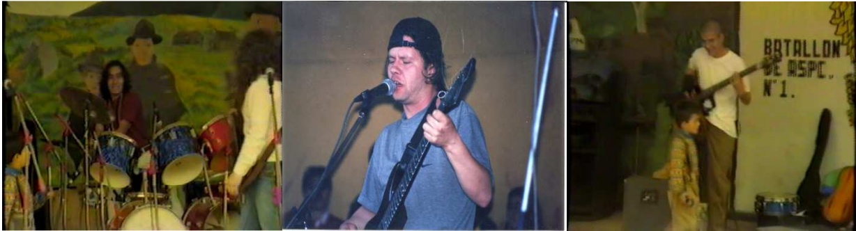
Figura 4. Caronte. Fuente. Autor