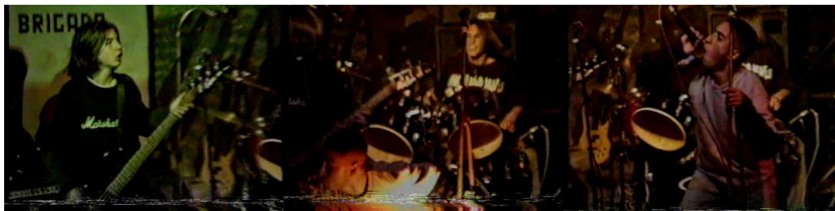
Figura 22. Astaroth.