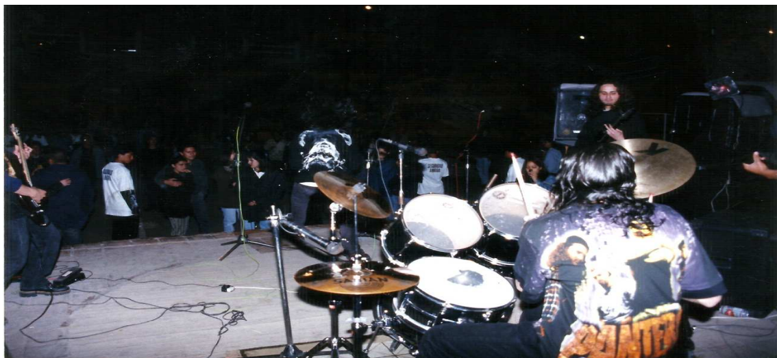
Figura 28. Media torta del parque Santander. Tunja 20 de Julio 1998 (Calle del Purgatorio).