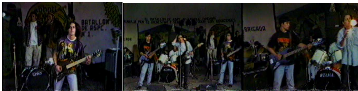
Figura 18. Calle del purgatorio.