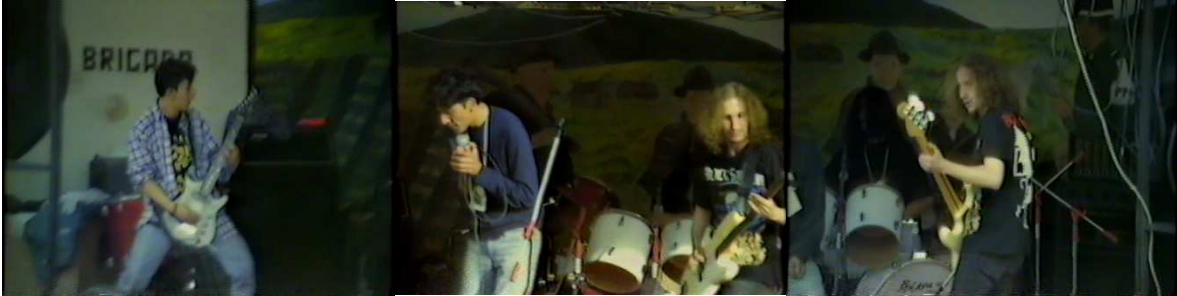
Figura 6. Arkanus. Fuente. Autor