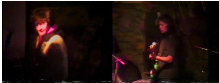
Figura 10. Socavon. Fuente. Autor

Para la Segunda Edición del Festival Participaron las siguientes Bandas