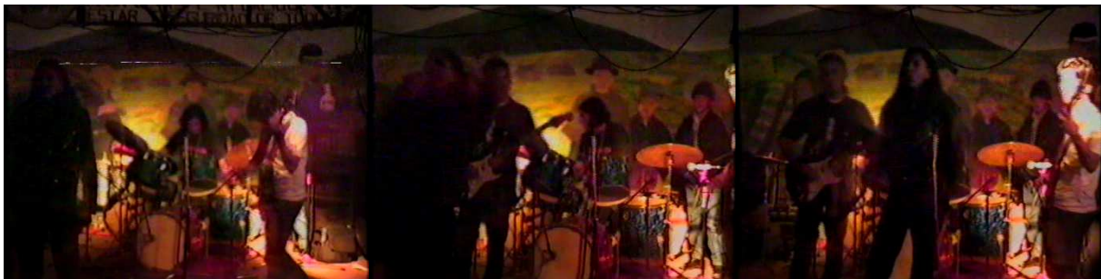
Figura 7. Corpus Cristo.