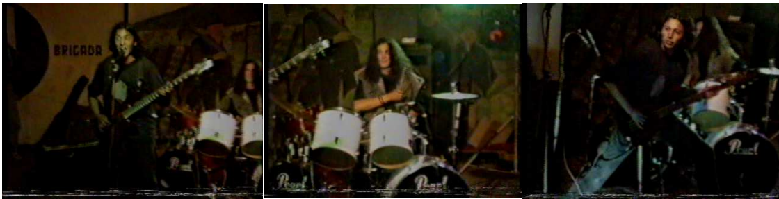
Figura 17. Arkanus.