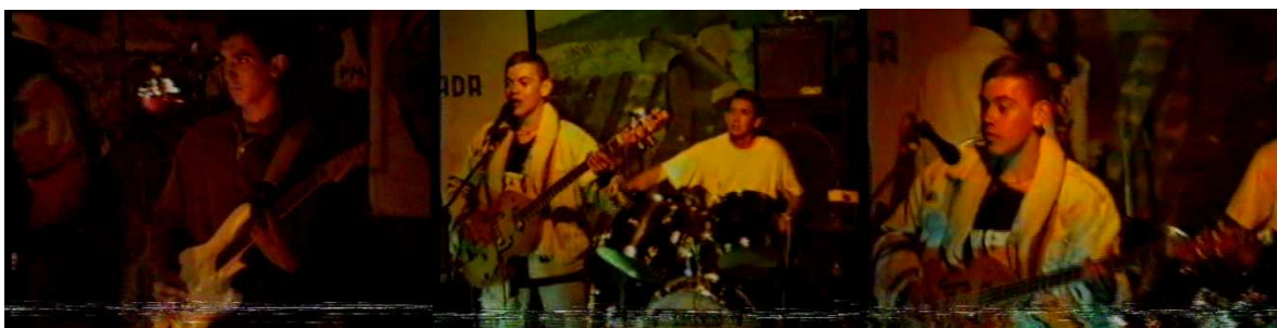
Figura 19. Abraxas. Fuente. Autor