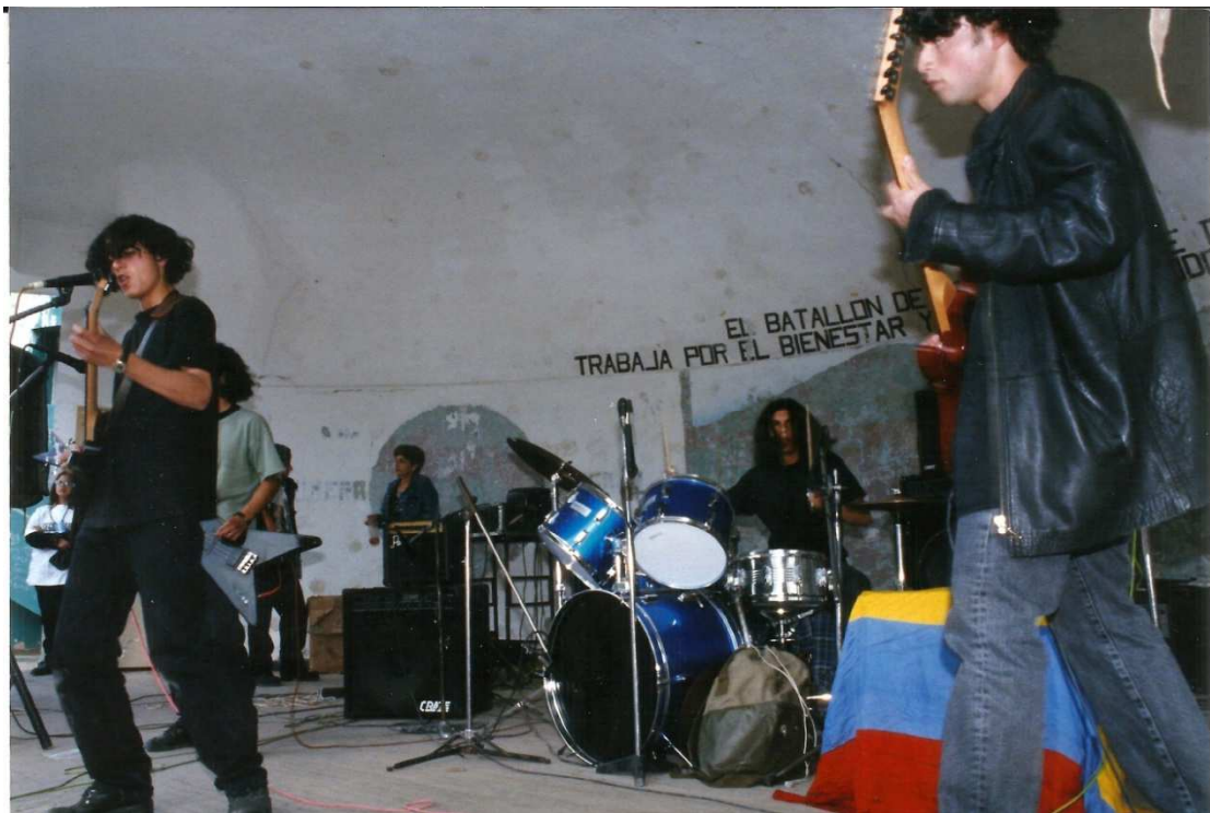
Figura 27. Media torta Tunja , 20 de Julio 1997 (Metástasis en escena).