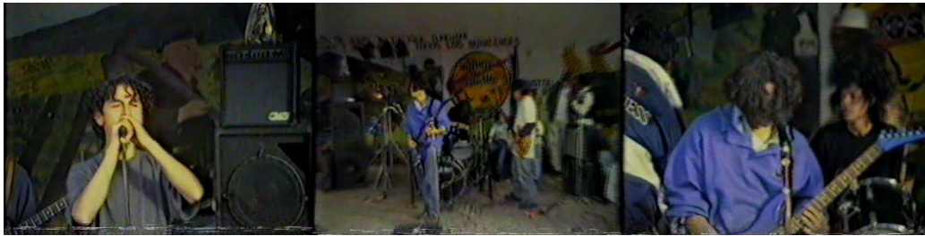
Figura 14. Metástasis.