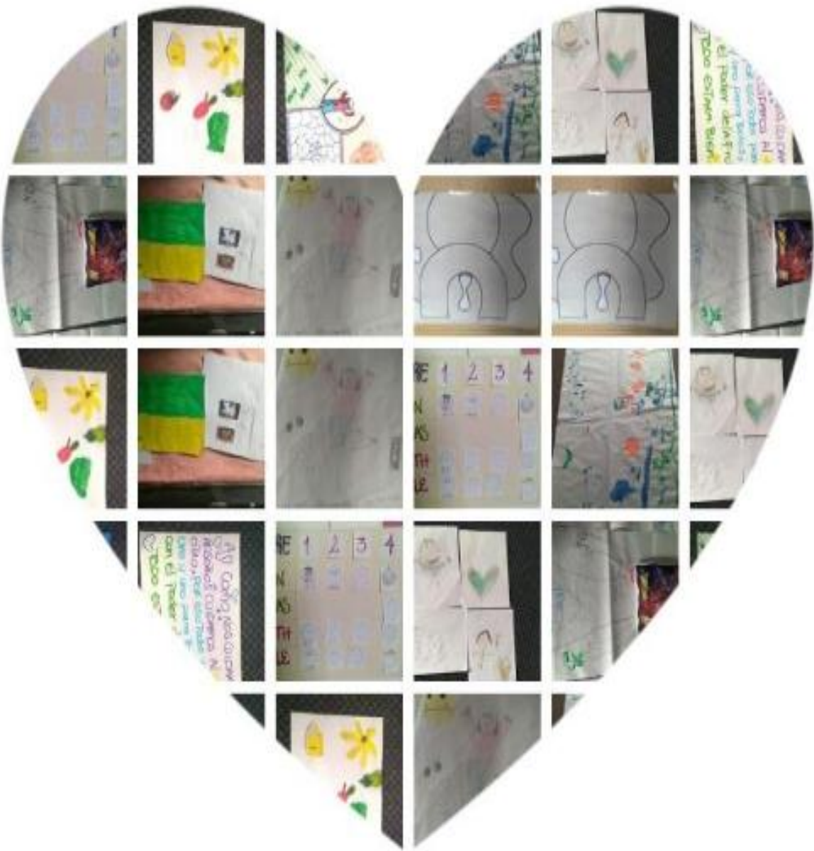
Ilustración 4 Producciones durante las Sesiones 2