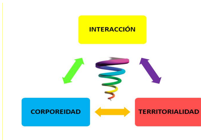
Graficas 1. Interrelación de los elementos de un sistema dinámico en el proceso de transacción.

sistemas anteriormente nombrados (constitución de diversos elementos, cuyas estructuras son dinámicas) un “proceso llamado transacción: la interacción simultánea y recíprocamente dependiente entre componentes múltiples” (Capra, 1992, p.144). Es decir, hacer de estos constitutivos la base que permita fundamentar la perspectiva integradora de los procesos evaluativos.