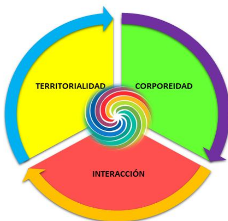
Graficas 2 La Complejidad como la religación de saberes sin fragmentarse, todo saber se da en relación de manera simultánea y recíproca.

Para ello, la complejidad proporciona que esta propuesta no se realice como objetos de estudio aislados, sin embargo, no rechaza el pensamiento simplificador. Es decir, reconfigura sus consecuencias a través de una crítica a una modalidad de pensar que como dice Morin (2006) “mutila, reduce, unidimensionaliza la realidad... el pensamiento complejo no excluye la linealidad, sino que muchas veces, la incluye en la visión y construcción de modelos recursivos para el conocimiento de la realidad” (p. 71).