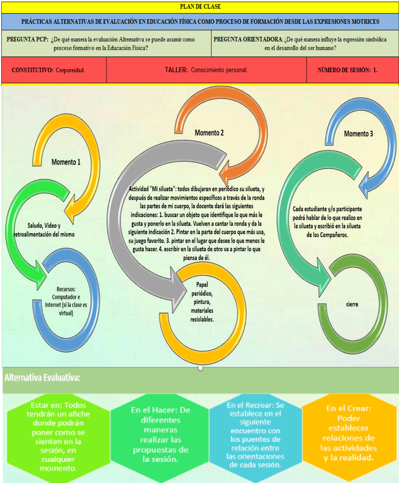
Tabla 5 Planeación.