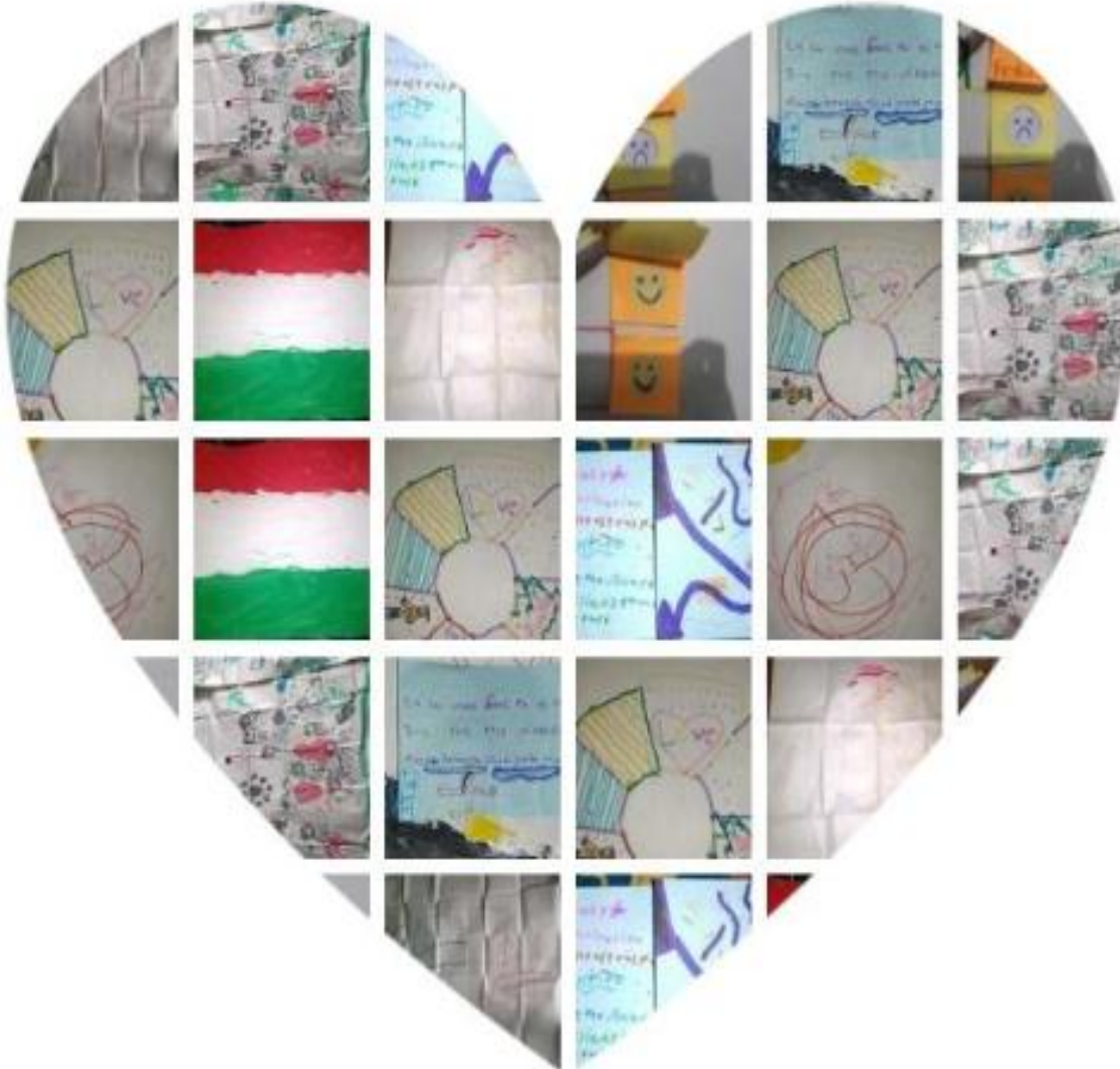
Ilustración 3 Producciones durante las sesiones

las siguientes imágenes corresponden a Producciones por parte de los niños participantes en el plan piloto durante las diferentes Sesiones.