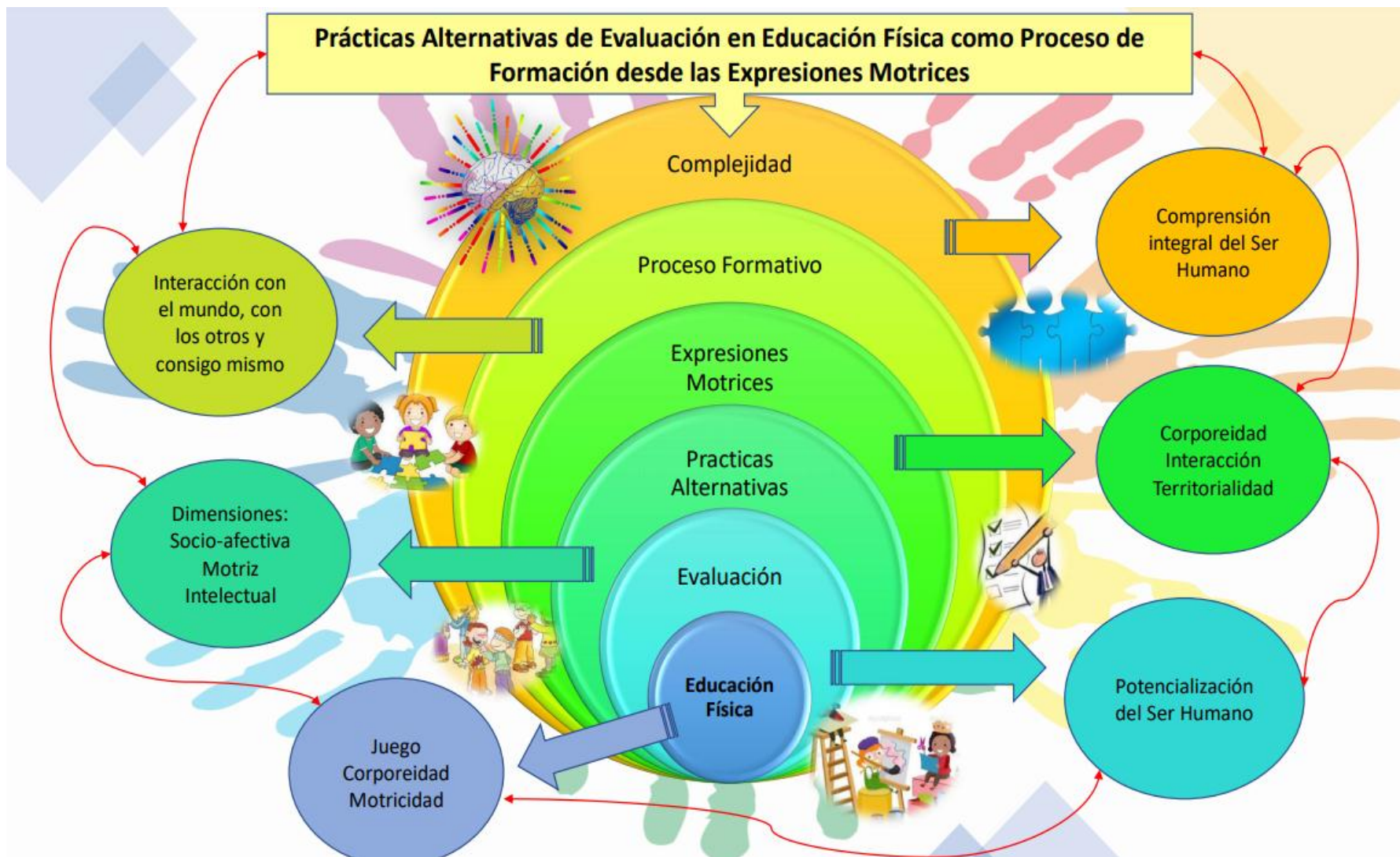
Ilustración 1 Contextualización, Creación Propia.