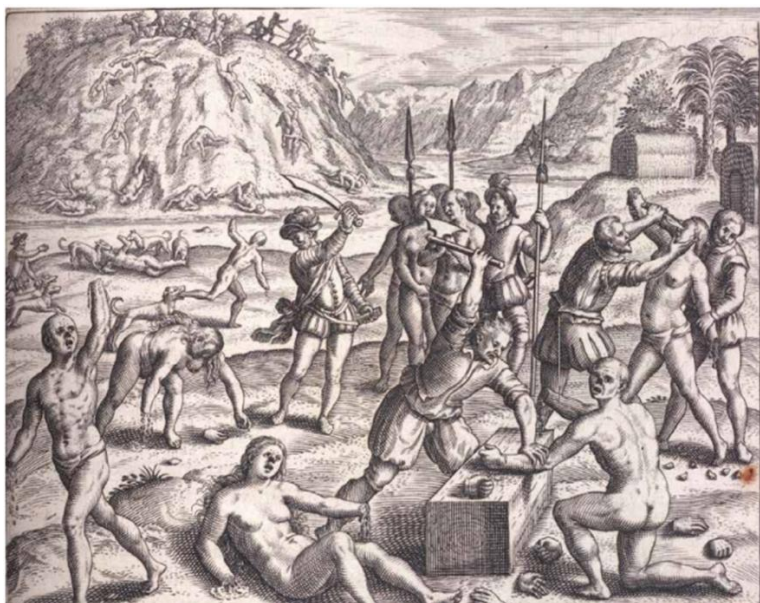
Ilustración 1. “Españoles cortando manos y narices a indígenas”. Escena que representa la matanza del peñon de Sutatausa acaecida en 1540. Grabado de Theodore de Bry para la obra Narratio regionum Indicarum per Hispanos quosdam deuastatarum verissima de Fray Bartolomé.