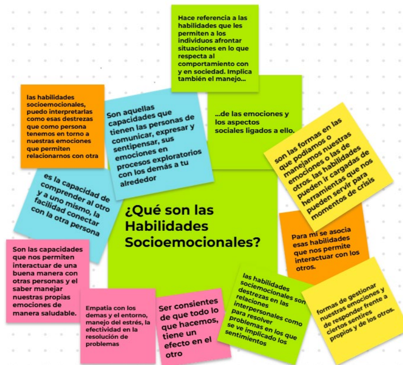
Figura 1. Lluvia de Ideas sobre Habilidades Socioemocionales en el Grupo Focal