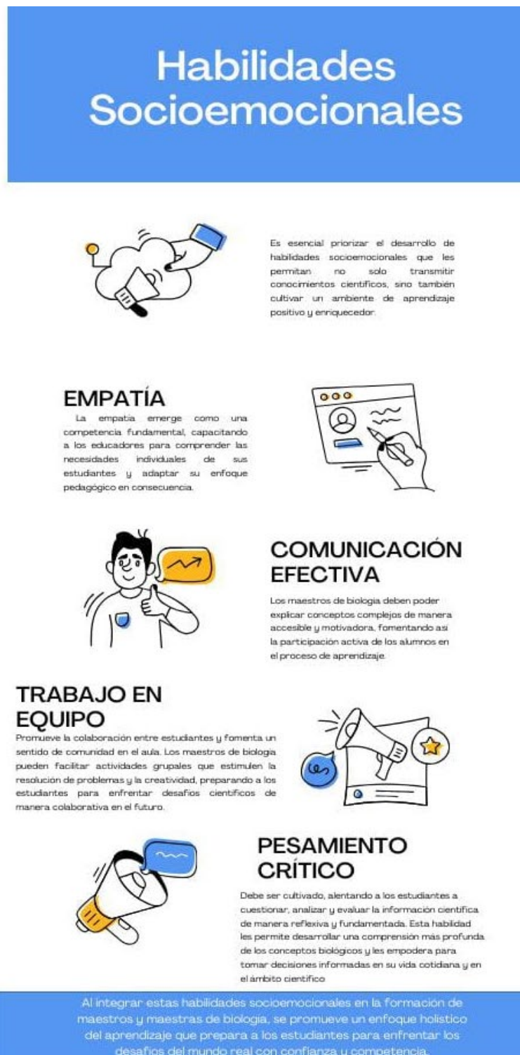
Figura 3. Infografía sobre Habilidades Socioemocionales realizada por E4 (2024).