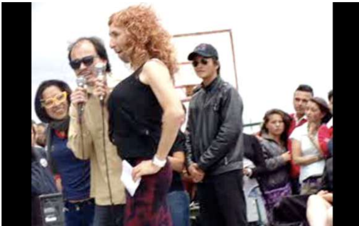
Figura 15: Foto obra: Esto ajusta con Maria Justa.