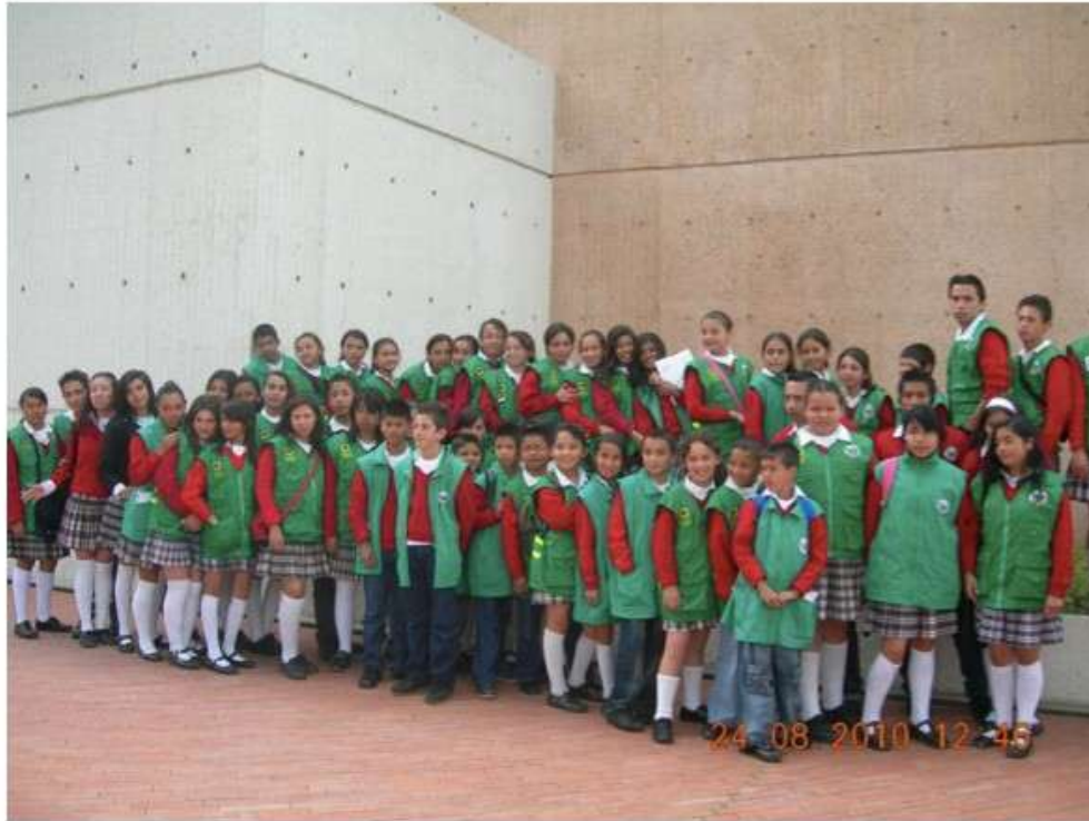
Figura 1: Estudiantes promotores y promotoras de convivencia.