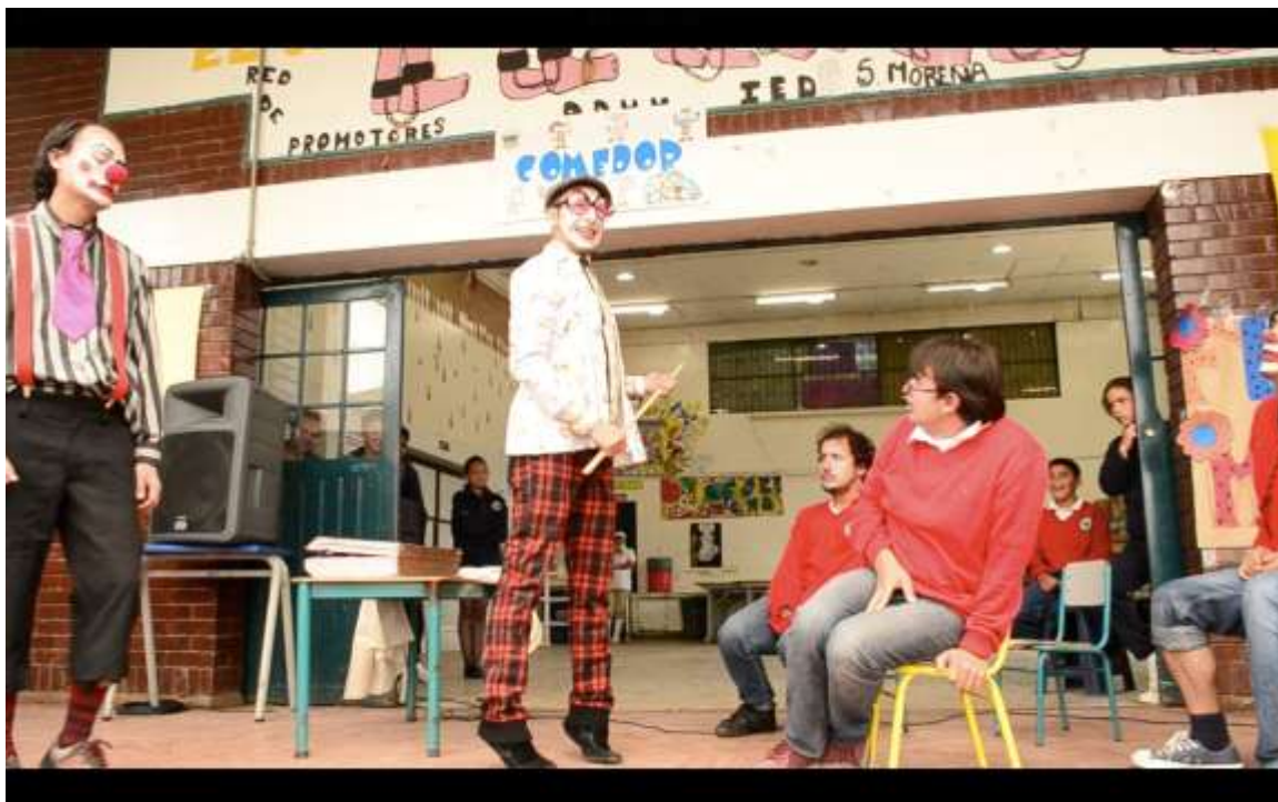
Figura 11: Foto obra: Un día de Viernes en el colegio