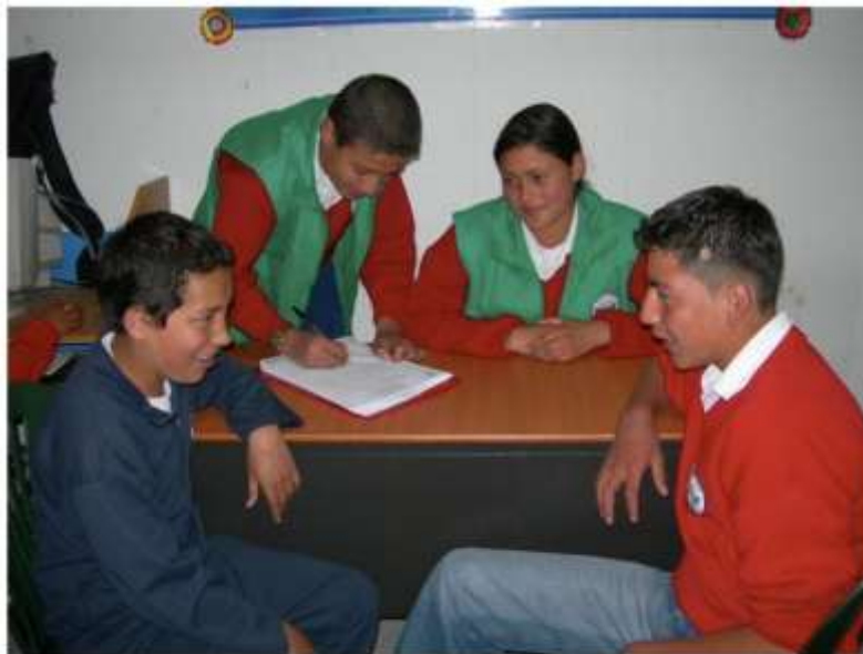
Figura 2: Audiencia de conciliación