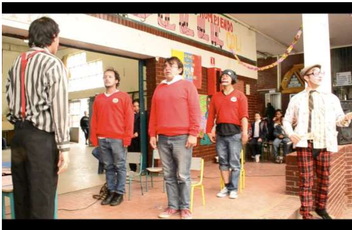
Figura 6: foto, de la obra de teatro clown: Un día de viernes en el colegio. 2013