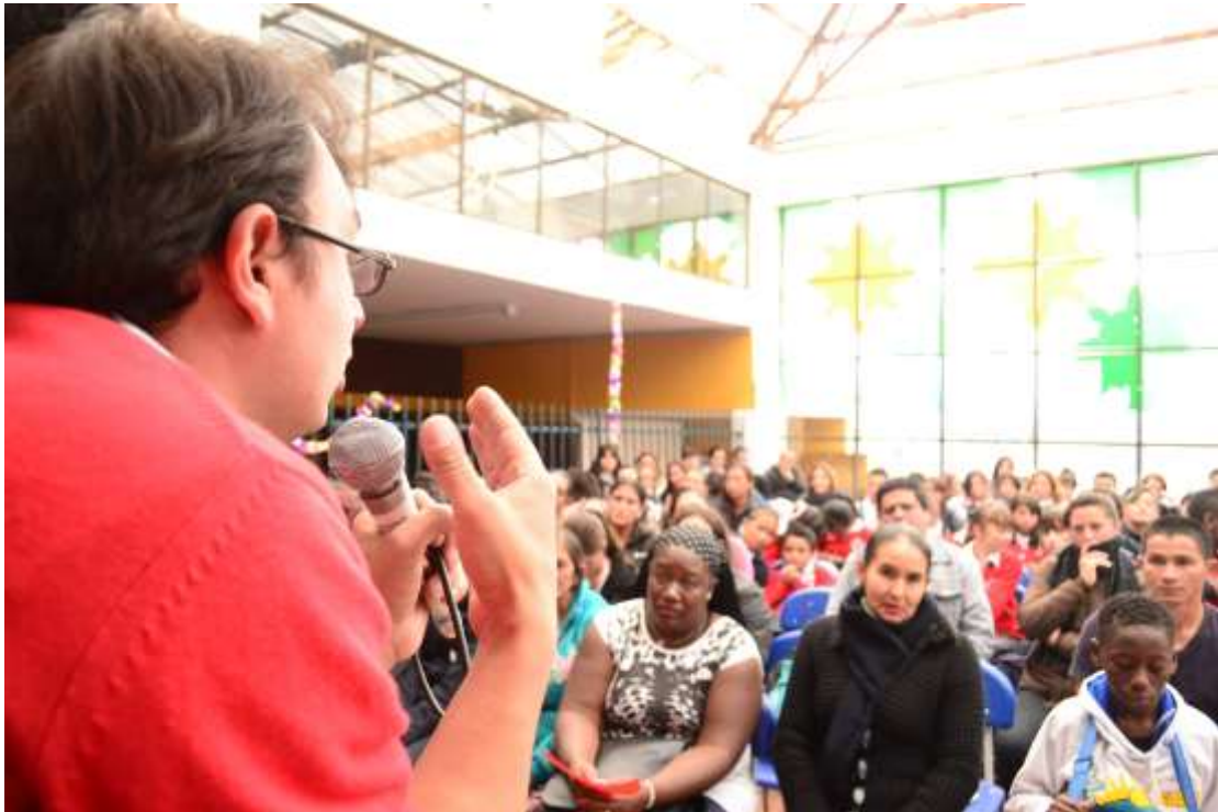
Figura 7: fotografía de la discusión con los estudiantes y los padres de Familia.

Por otro lado, los padres también fueron consientes de los espacios que apoya el Colegio como en Centro Estudiantil de Promoción de Convivencia CEPC R.A.C.E, para acercarse a los procesos académicos y de convivencia de sus hijos en el colegio, a propósito un padre solicitó una conciliación con un profesor por un malentendido