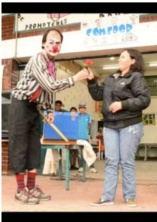
Figura 5: foto, de la obra de teatro clown: Un día de viernes en el colegio. 2013

TERCER ENCUENTRO: Círculo de Reflexión con los representantes de todos los cursos y padres de familia.