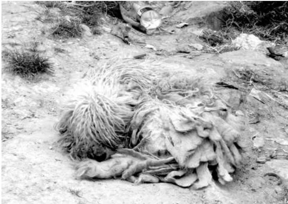
Figura 3: Fotografía del autor. 2012

Como elemento provocador se les entrego a cada estudiante una fotocopia de una Foto en la que se registra uno de los perros de los alrededores del colegio el cual se funde con el fondo por su color y posición.