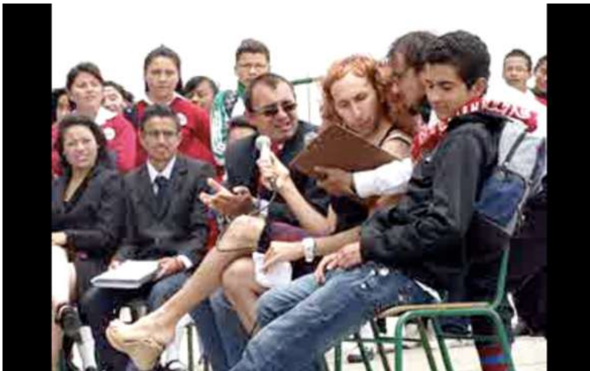
Figura 13: Foto obra: Esto ajusta con Maria Justa.