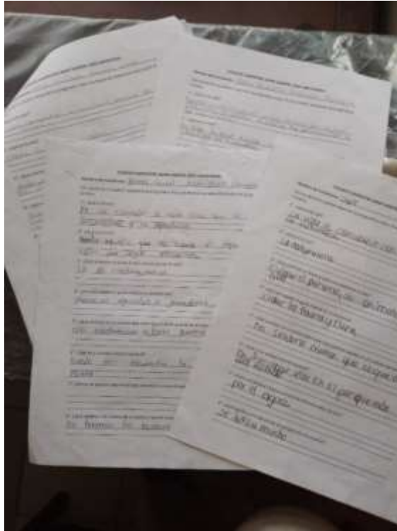
Imagen N° 6 Taller de conceptos (Pérez W, 2022)