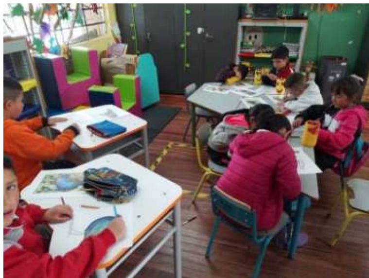
Imagen N° 7 Taller coloreo mi animal (Pérez W, 2022)