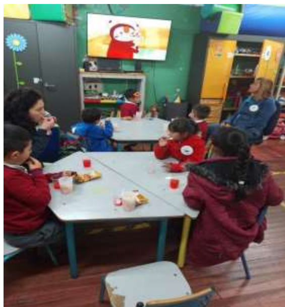
Imagen N° 15, compartir final (Pérez W, 2022)

La actividad de compartir al ser la actividad de cierre, finaliza con el agradecimiento de cada uno de los profesores de la escuela hacia el trabajo desempeñado desde este ejercicio, realizando la invitación a poder seguir trabajando con ellos, considerando que fue un trabajo enriquecedor de mutuo aprendizaje, tanto para los niños, como para los profesores de la escuela y por supuesto para nosotras. Todo termina con caras alegres y felices por parte de los niños y un gran aplauso.