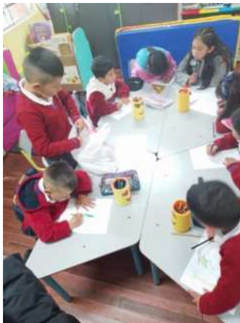
Imagen N° 4, Ilustrando Sumapaz (Pérez W, 2022)

Esta actividad se planteó con el objetivo de implementar un taller de ilustración enfocado en el Páramo de Sumapaz. Se inició con una breve explicación en torno al páramo de Sumapaz y las especies que habitan el territorio, asociando las respuestas de la actividad anterior nombrada Tejiendo el Páramo . Una vez los niños terminaron sus ilustraciones se pudo evidenciar que a pesar de que los niños viven en el páramo de Sumapaz, en cuanto a la riqueza de flora y fauna es muy poco lo que conocen. Sus dibujos y las representaciones que ellos quisieron plasmar se reducen en el caso de la flora, únicamente al frailejón e inclusive dibujaron al frailejón animado llamado Ernesto Pérez, pero ninguno dibujo otra planta distinta a la mencionada. Para el caso de los animales y representantes de la fauna del páramo, muchos de ellos dibujaron animales domésticos como vacas, caballos y patos, inclusive algunos dibujaron el oso de anteojos, pero ninguno dibujo aves, insectos, anfibios, roedores, o reptiles que hacen parte de la biodiversidad de los páramos.