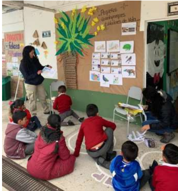
Imagen N° 13 Mural (Pérez W, 2022)