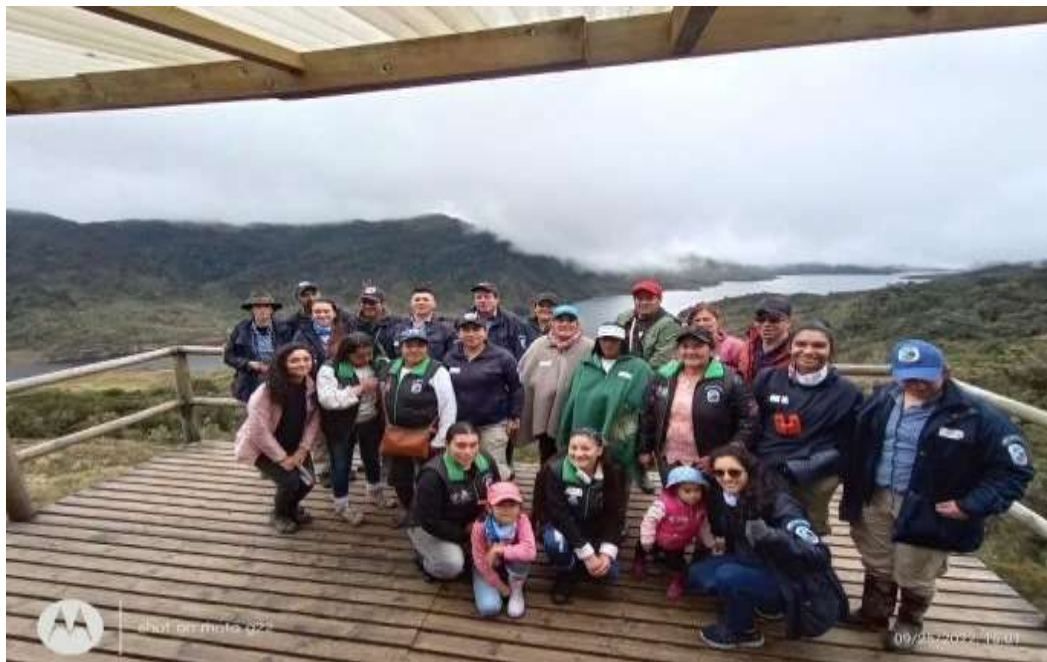
Imagen N° 18 Recorrido Parque Chingaza, (Pérez W, 2022)

restauración ecológica es llegar a estos lugares en donde han sido afectados por ganadería extensiva, entre otras afectaciones, luego se hace un estudio de las plantas propias de estos lugares, para realizar el proceso de restauración con esas mismas especies de plantas. Posteriormente se realiza un recorrido en forma de circuito por la zona de senderismo del parque, es una actividad que provoca muchos sentimientos sobre todo en el grupo de las Frailejonas ya que es inevitable que hagan comparaciones con su territorio en cuestiones del paisaje, ellas mencionan que es muy diferente y aun así, muestran un alto sentido de pertenencia, identidad, y apropiación hacia su territorio Sumapaz en donde no dejan de mencionar que no lo cambiarían por ningún otro. El recorrido también se realizó con la esperanza de poder ver al oso de anteojos y al venado de cola blanca, se observó 3 venados, y solo comederos de oso con la des fortuna de no poder observar ninguno como tal.