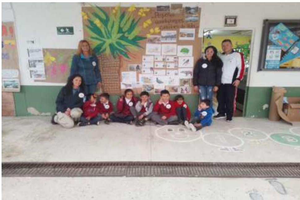
Imagen N° 14 Graduación Mini Guardaparques (Pérez W, 2022)