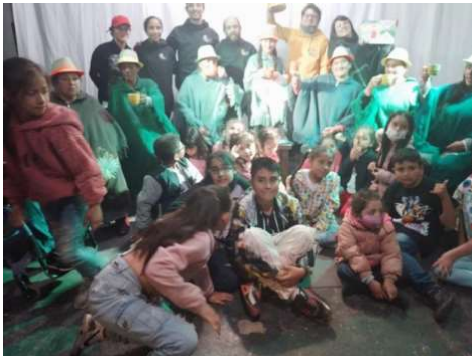
Imagen N° 21 Acompañamiento obra teatral