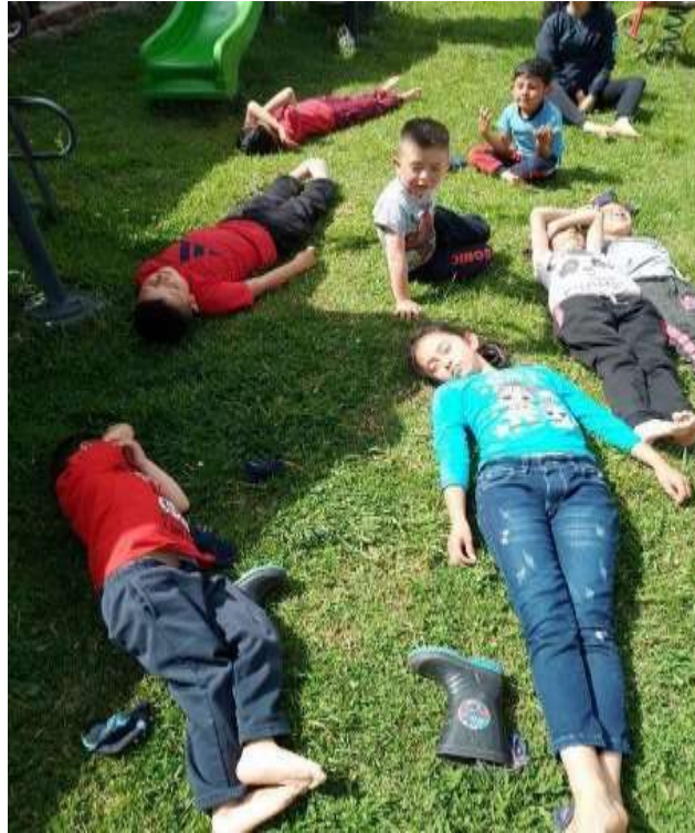
Imagen N° 8, taller de sentidos (Pérez W, 2022)