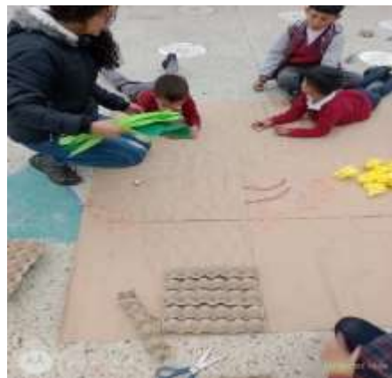
Imágenes N° 9, 10, 11 Taller de mural, (Pérez W, 2022)