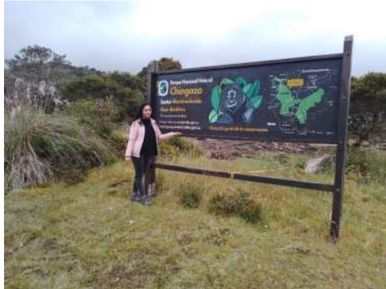
Imagen N° 19 Recorrido Parque Chingaza, (Pérez W, 2022)

La última actividad que acompañe fue la presentación de una obra de teatro de la Frailejonas que se lleva a cabo en la casa de las luciérnagas, ubicada cerca al humedal de Tibanica, “voces del páramo”, realizando un ejercicio de observación e interpretación del mensaje que pretende dar el grupo a través de esta obra de teatro, y es sobre la importancia de tener conciencia de las practicas realizadas dentro del territorio para el cuidado de la vida, diciendo no a la caza de animales, promoviendo el cuidado del agua, y de una ganadería controlada.