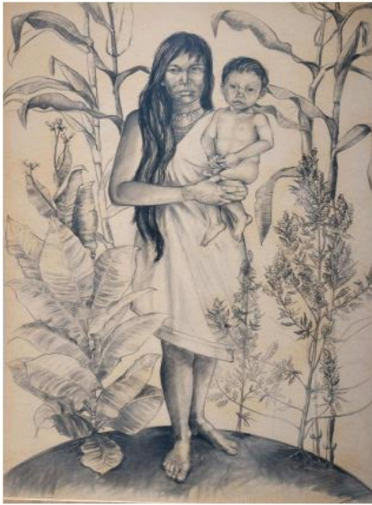
Libro de aproximación a la lengua muisca 1 (usado en el aprendizaje de la lengua muisca)

dicho espacio, los participantes compartieron y complementaron relatos personales sobre las prácticas culturales materiales o inmateriales presentes en las distintas familias y se ponen en dialogo con lo demás, por lo cual se organiza el Colectivo de Educación Propia Pedagogías Ancestrales (CEPA), lo cual se convirtió en el nacimiento de la comunidad CONA.