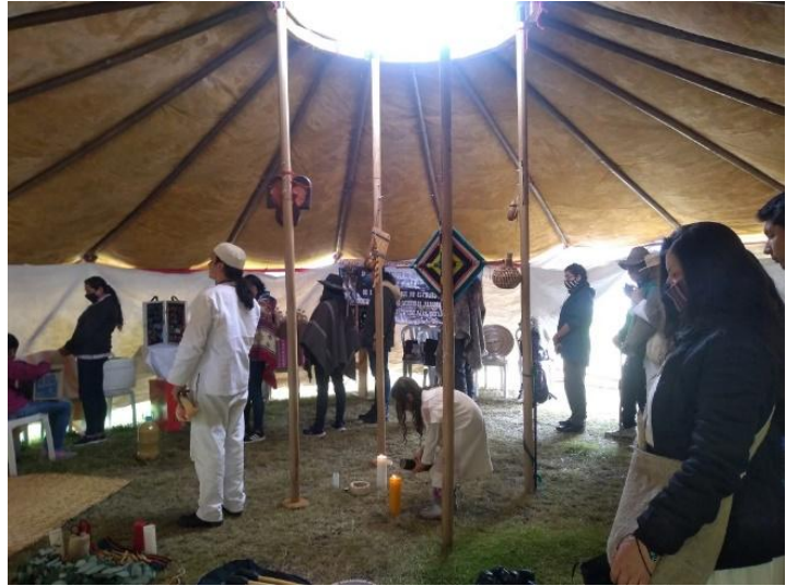
Ilustración 4 Participación de la comunidad en espacio interétnico y comunitario Festival del renacer muisca en Usme, archivo comunidad CONA 2021

Sin darme cuenta ya llevaba alrededor de tres años siendo parte de la comunidad, aprendiendo del compartir colectivo y, en especial, de la palabra y enseñanzas del mayor. En este camino, me fui acercando al uso, conocimiento y prácticas relacionadas con distintas medicinas, entre ellas el tabaco, planta que ya formaba parte de mi cotidianidad, pero a la que no le había reconocido esa dimensión introspectiva y espiritual que logré comprender a través del aprendizaje colectivo, pues es precisamente a través del uso y comprensión de las medicinas en que se llega a comprender la etnicidad, el sentido de las practicas, espacio fortalecido desde el ámbito familiar ya que a partir de los aprendizajes de estos encuentros, sentadas y trasnochadas en aprendía y enseñaba todos esos saberes que se utilizaban cada vez más cotidianamente.