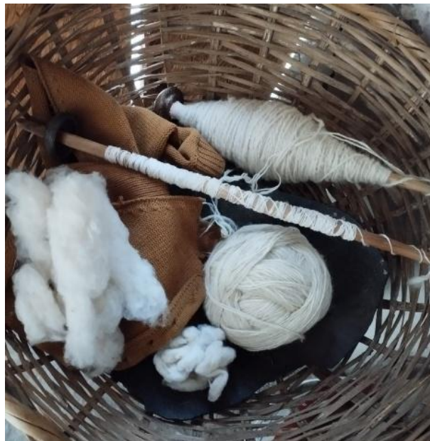
Ilustración 5 Ilustración 3 Husos y algodón de la comunidad, creación propia 2024

En este apartado no profundizaré en mi experiencia con la lengua, ya que más adelante se describe un segmento específico sobre ello. Sin embargo, sí quiero señalar un elemento que me llamó poderosamente la atención: la participación de comuneros muisca provenientes de otras parcialidades y cabildos. Esto me permitió comprender que la recuperación de la lengua, un proceso que convoca a todo el pueblo muisca, sin importar el lugar de origen o el espacio de enunciación.