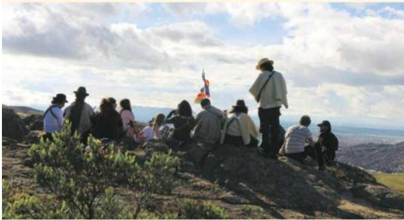
Ilustración 1 CHIÉ CHAFIB WA WI (somos de cerro seco) comunidad CONA y SIWENSIÉ en círculo de palabra en cerro seco, Fotografía Sergio Romero 2021.

En el caso de CONA, este sentido se construye a partir de la vivencia de los lugares habitados y del impacto que genera el contacto con la ciudad. Así, ciertos espacios adquieren un valor simbólico como las lagunas, las montañas y los riachuelos que, a pesar de la urbanidad, siguen presentes en Mykyta y continúan siendo referentes para la