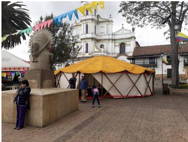
Ilustración 3 Casa de pensamiento itinerante

Desde la perspectiva de Henri Lefebvre, la comprensión del territorio y lo campesino cobra un significado importante, lo cual puede relacionarse con los fenómenos que ocurren en la comunidad CONA. En primer lugar, Lefebvre (1970) establece que la relación entre el campo y la ciudad atraviesa transformaciones profundas que no deben entenderse como hechos aislados, sino como parte de una mutación general en las estructuras sociales: “En la actualidad, la relación ciudad-campo se transforma, y esta transformación constituye un aspecto importante de una mutación general” (p. 20). Esta afirmación permite comprender cómo, en el caso de la comunidad CONA, diferentes fenómenos han posibilitado que la ciudad se configure como un espacio de encuentro, reorganización e incluso de resignificación territorial y cultural.