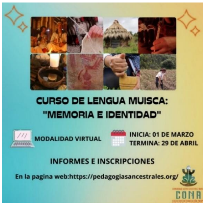
Ilustración 7 Curso de educación propia abierto al público 2021

Este no solo es una forma de comunicación entre sus hablantes, sino que también logra representar la cosmovisión, historia, e interpretaciones del contexto y en este caso la relación que tienen los Muisca con los lugares sagrados, creando una tradición oral que ha perdurado en la actualidad por medio del intercambio generacional o las prácticas principalmente campesinas