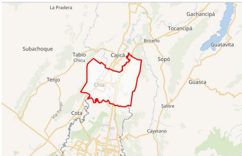
Imagen tomada de Google Mapas (2019)

De los once municipios analizados de la provincia, Chía y Zipaquirá, son los que más han contribuido al Producto Interno Bruto (PIB) en el 2005. La fuente de ingreso ha