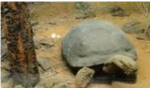
Google imagen (2020)