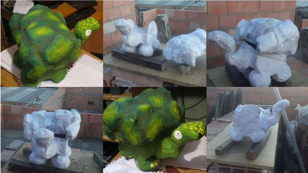
Elaboración propia autora Rodríguez, O. (2020)

Colas y elaboración del prototipo del personaje principal