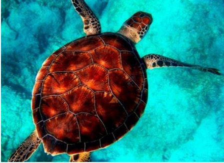
Google imagen (2020)